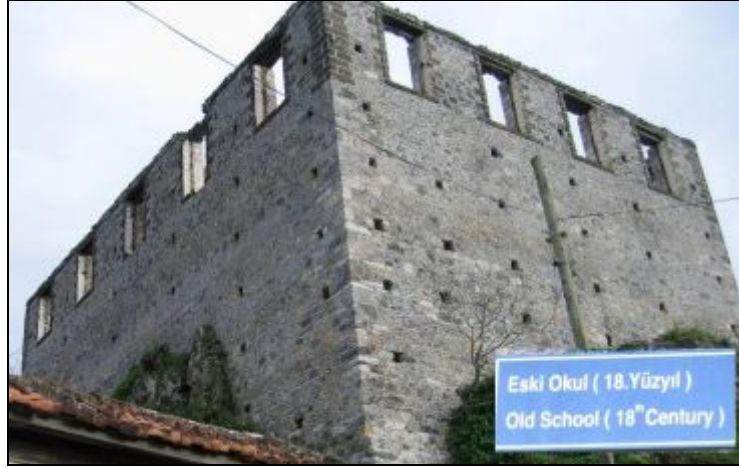
Foto 10. Kayaköy'de Turabi Çeşmesi'nin Üst Kısımındaki Kızlar Okulu

Kayaköy'de tanımlanabilen yapılardan diğer grubu yel değirmenleri oluşturmaktadır. Yerleşimin güneyindeki sırta Batı Şapelin yaklaşık 100 m batısında bulunan yel değirmeni, denizden gelen rüzgarlara açıktır. Diğer yel değirmeni Kayaköy'ün güneybatısında Değirmentepe'nin zirvesinde bulunmaktadır. İçten iki katlı olan yuvarlak planlı yel değirmenlerinden günümüze sadece beden duvarları ulaşmıştır.