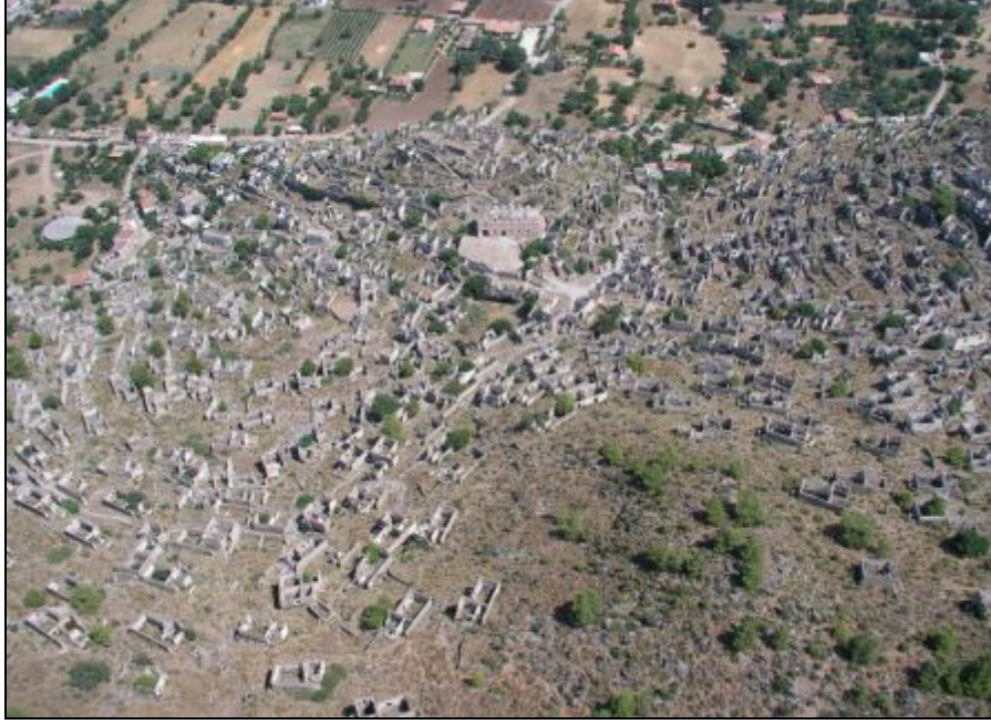
Foto 1. Dellal Tepe Yamacında Kurulan Kayaköy Yerleşim Merkezi ve Kayaköy Polye Tabanı

tabanın zamanla göl ve bataklık oluşturması, ovalık sahadaki toprakların tarımda kullanması, daha kolay savunma gibi coğrafi şartların önemli bir etkisi olmuştur.