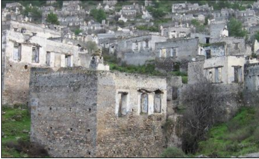
Foto 4. Dellal Tepe Yamacına Kurulmuş Olan Kayaköy Meskenleri ve Önde En Yaygın Meskenlerden İki Katlı Tek Odalı Taş Mesken.

Eski Kayaköy yerleşmesinde, Aşağı Kilise tarafında, (Kayaköy batısında) daha sade evler, Aşağı Kilise'den yukarı doğru çıkan yol, hafif eğimli rampalar ve ara basamaklar içermekte, evler yukarıya doğru giderek seyrelmekte, belirginleşmekte ve sadeleşmektedir. Aşağı Kilise'den Soğuksuya çıkan yol üzerinde tek katlı yapılar ve giriş mekanında sarnıç gibi eklentilerin olduğu yapı tipi evlere, köy meydanı etrafında ve eski Pazar yeri çevresinde ise çok eklentili yapı grubu evlere daha sık rastlanmaktadır (Bulhaz vd. 2002). Evlerin ana bölümleri, içinde ocağı, duvarlarda nişleri olan dikdörtgen bir mekândır. Meskenlerin kapı ve pencereleri ahşaptan yapılmıştır (Foto: 5).