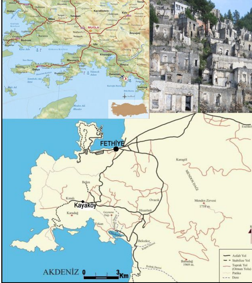
Şekil: 1- Kayaköy ve Çevresinin Lokasyon Haritası.