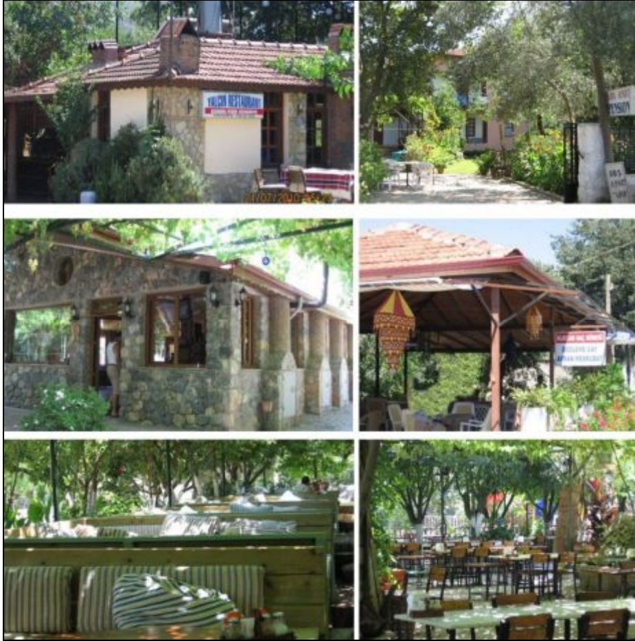
Foto 12. Kayaköy'de Turizm Alanında Hizmet Veren Pansiyon, Apart ve Restoranlardan Görünüm

Kayaköy turizm açısından özellikle 1990'lı yıllardan sonra gelişmeye başlamıştır. Kayaköy ve çevresinde turizme yönelik olarak düzenlenen birçok börek evi, restoran, apart otel ve pansiyon bulunmaktadır (Foto: 12). Kayaköy'ün otantik ortamı hem turistleri, hem de sanatçıları kendisine çekmektedir. Yaz aylarında Kayaköy'de fotoğraf ve sanat atölyeleri kurulmaktadır. Bu atölyelerde profesyonel sanatçı ve müzisyenler ile öğrenciler bir araya gelmektedirler.