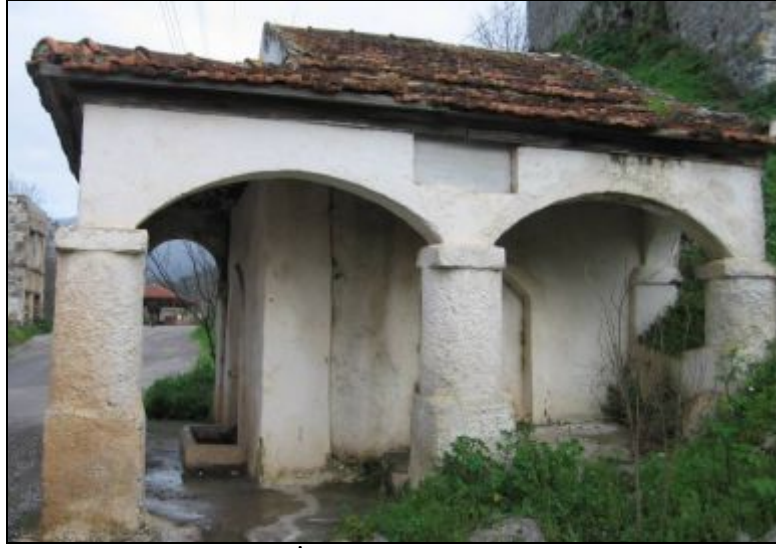
Foto 6. Kayaköy'ün İçme Suyu Karşılaman Turabi Çeşmesi

Kayaköy yerleşim biriminde kullanma suyu evlerin çatısı üzerine yağın yağmur sularının toplandığı sarnıçlardan temin edilmiştir. Sarnıçlar her evin kendine yetecek suyu depolamaktadır. Su sızdırmalarını önlemek için sarnıçların içleri sıvanmıştır. Sıvalar neredeyse sırlı denecek kadar düzgün yüzeylidir. Teras çatılarda biriken yağmur suları, oluklar vasıtasıyla sarnıçlarda toplanır. İçme suyu ise, Kayaköy'e Hisarönü Köyü yönünden girişte ve Kızlar Okulunun altında bulunan çeşmeler ve kuyulardan sağlanmıştır. Bu çeşmelerden Turabi Çeşmesi , önünden ve yanından geçen yollara revaklı cephe vermektedir. Çeşmenin üzerinde yapım tarihi ile ilgili kitabesi vardır (Foto: 6).