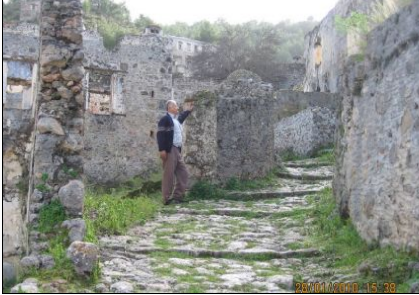
Foto 3. Taş Döşemeli Dar ve Teraslı Kayaköy Sokaklarından Görünüm