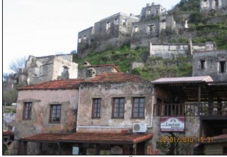
Foto 5. Kayaköy Meskenlerinden Özel Mülkiyette Bir Mesken

Kayaköy evlerinin büyüklüğü 50-60 m 2 arasında değişmektedir. Bu evler zemin üstünde yer alan iki kat şeklinde olanlar olduğu gibi zeminde yer alan iki oda bir sofa görünümünde de evler vardır. Daha çok ise giriş kat (depo olarak kullanılan) ve üst katta iki oda ve bir sofa şeklinde planlama olan konutlar yer alır. Odalarda kapı ve pencereler ışık alma şekline göre yapılmıştır. Çok basit yüklük, sarnıç, ocaklık ve banyo yapılacak küçük bir alanlar odanın birinde bulunmaktadır (Şekil: 3). Tuvaletler, dışarıda, evlerin köşesinde, mahremiyeti sağlayacak şekilde yapılmıştır. Bazı evlerde ikinci ocaklı odalar da yer almaktadır.