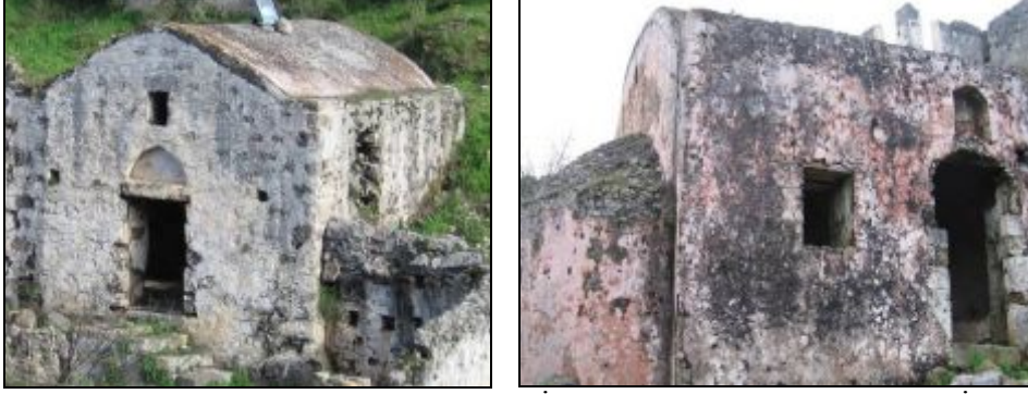
Foto 7. Kayaköy’de Halkın Günlük Dini İbadetlerini Yaptığı Şapellerden İkisi

Aşağı Kilise (Panayia Pirgotissa): Kayaköy’ün batısında bulunan orijinal adı Panayia Pirgotissa olan Aşağı Kilise, günümüze daha iyi korunarak ulaşmıştır (Foto: 8). Korunmasında en önemli etken, yapının 1960’lı yıllara kadar camii olarak kullanılmasıdır. Çevresi yüksek duvarlarla çevrili kilisenin bahçesine doğu yöndeki kapıdan girilir. Bahçenin güney-doğu köşesinde çan kulesi, kuzey-doğuda küçük bir mezarlık bulunur. Kilise tabanı çakıl taşlarından oluşan mozaiklerle kaplıdır. Bahçe duvarına güney yönden bitişik üç basamaklı oturma sırası, dini törenlerde ziyaretçilerin oturması için yapılmıştır.