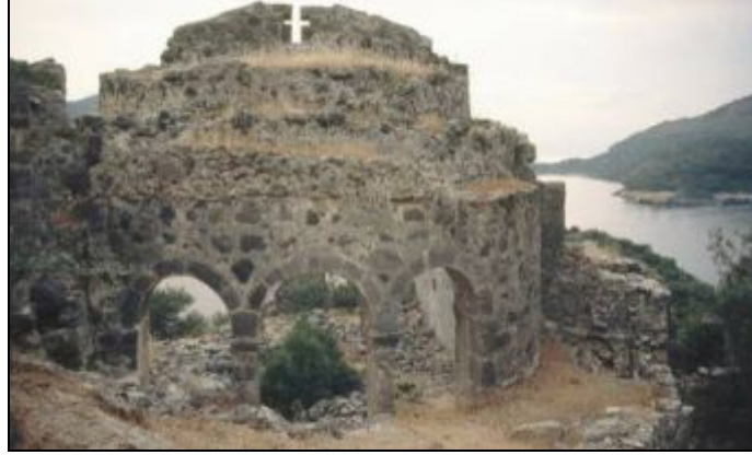
Foto 11. Gemiler Adasının Üst Kısımındaki Zirve Kilisesi Kalıntısı

Gemiler Adası: Kayaköy'den batıya doğru devam eden yolun sonundaki küçük koyun karşısında Gemiler Adası yer almaktadır. 5. yüzyıl'da önemli bir dini merkez durumuna gelen adanın 7. yüzyıl'da Araplarca yakılıp, yıkıldığı kabul edilir. Ortaçağ'da önemli bir yerleşim olduğu anlaşılan ada boydan boya surla çevrili; adada büyük ölçüde yıkılmış dört kiliseyle, birçok şapel ve iki kilise arasında uzanan kısmen yıkılmış tünel kalıntısı da vardır. Günümüzde yerli ve yabancı yatçıların uğrak yeri olan Gemiler Adası en yüksek noktasında yer alan bir kilise (Zirve Kilisesi) nedeniyle Ortaçağ'da Aya Nikola adası olarak adlandırılmıştır (Foto: 11). Zirve Kilisesinde yapılan kazılarda geometrik desenler ile mitolojik olayların yer aldığı taban mozaikleri bulunmuştur. Kilisenin büyük bir yangın sonucunda yıkıldığı sanılmaktadır.