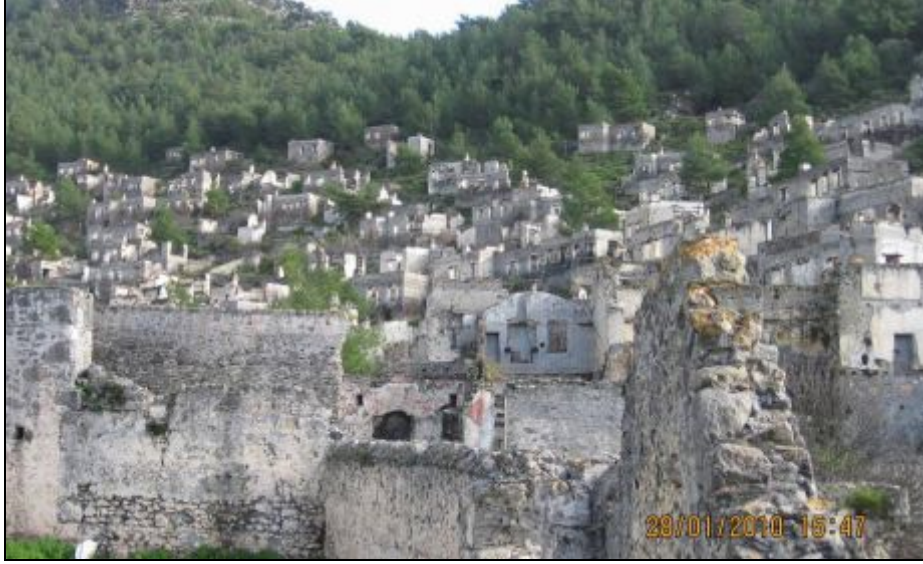
Foto 2. Hayalet Şehir Görünümlü Kayaköy Yerleşim Merkezi

Kayaköy’de 1935-1990 yılları arasındaki nüfus dağılımına bakıldığında zaman nüfusun 1935-1960 yılları arasında çok azda olsa arttığı görülürken, 1960-1990 yılları arasında da Türkiye genelinde olduğu gibi kırsal kesimden şehirlere olan göç nedeniyle az da olsa Kayaköy’de de nüfusun azaldığı görülmüştür (Tablo 1).