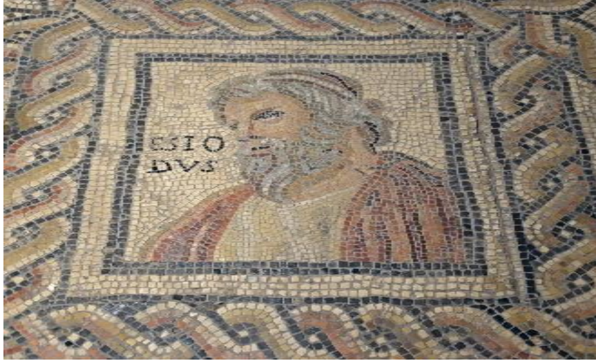
Görsel 2: Hesiodos'u gösteren bir Roma mozaiği (İÖ III. yüzyıl) . ( https://livingpoets.dur.ac.uk/w/The_Monnus-Mosaic_Hesiod [Erişim tarihi: 01/01/2023]).

Hesiodos, Erga kai Hemerai yani İşler ve Günler adlı eserinde ise insanın tarihine odaklanmış, hatta Hesiodos bu yapıtında kendinden önce gelmiş olan ve sonra gelecek olan nesilleri kapsayacak şekilde insanın geçmişi ve geleceği konusunda kendi öngörülerini ele almıştır (Ford, 1992, p. 95). Bu bağlamda Hesiodos ilk olarak kötülük sorununa değinmiş ve zamana bağlı olarak insanların nasıl kötüye doğru gittiklerini irdelemiştir. Ayrıca dünyanın adaletsizliğine de değinmiştir. Hesiodos, "Neden?" diye sorar, "dünya neden bu kadar kötülükle dolu?" ilk yanıtı en geleneksel anlamıyla efsanevidir. Bu efsaneyi ise Prometheus ve Pandora'nın öyküsü ile açıklamaya çalışmıştır. Hesiodos'un bu açıklaması Yunanlıların tarihleri boyunca ayinleri ve inançlarını açıklamak için kullandıkları tipik bir efsanevi cevaptır. Ardından duraksamadan devam eden Hesiodos, Pandora mitinden sonra insan ırklarının öyküsünü anlatmaktadır (Finley, 1987, p. 17). Hesiodos burada insanın niteliklerinin kötü bir gidişe doğru değiştiği görüşünü "Çağlar Öğretisi" de denilen bir temellendirme bağlamında ortaya koymuştur. Hesiodos bu öğretisinde insanlık tarihini birbirini izleyen beş döneme, çağa ya da kendi deyimiyle insan "ırklarına" ayırmış ve bu ayrımı ise şöyle kategorize etmiştir: