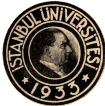
Resim 1. İstanbul Üniversitesi'nin 1933'te kurulduktan sonra tasarlanmış ilk logosu, (URL 6).

İstanbul üniversitesi Türkiye Cumhuriyetinin ilk ve en köklü üniversitesi olarak karşımıza çıkmaktadır. Osmanlı döneminden günümüze uzanan bir kurum olması açısından önemli bir değerdir. Kurumun, "Tarihten Geleceğe Bilim Köprüsü" sözü ile kendi sloganında da görüldüğü gibi köklü ve derin bir tarihle bağlarının olduğu ifade edilmektedir. İstanbul Üniversitesinin kuruluşunun 1453 yılına tarihlenmiş olmasından dolayı kurumu İstanbul'un fethi ve Fatih Sultan Mehmed Han ile ilişkilendirebilmek mümkündür. Osmanlı hükümdarları arasında ilmi ve sanatı sevmiş ve himaye etmiş olan Fatih Sultan Mehmed'in İstanbul Üniversitesi'nin temeline önemli katkılar yaptığı düşünülmektedir(Baykal, 2018:78). Bu bağlamda, Süheyl Ünver düşüncesini, "Fatih Sultan Mehmed medreselerine müspet ilimleri sokmakla büyük bir hamlenin başlangıcını yapmıştır" şeklinde ifade etmiş ve İstanbul Üniversitesi'nin ilk olarak Zeyrek ve Ayasofya medreselerinde kurulduğunu ve on sekiz yıl boyunca bu mekânlarda eğitim verdiğini anlatmıştır. Türkiye Büyük Millet Meclisi tarafından alınan kararla, 31 Temmuz 1933'te kapatılan Dârülfünûn'un yerine kurularak 1 Ağustos 1933'te resmi üniversite sıfatıyla kurulmuş olan İstanbul Üniversitesi, Türkiye Cumhuriyeti'nin ilk üniversitesi olma şerefine erişmiştir (URL 1).