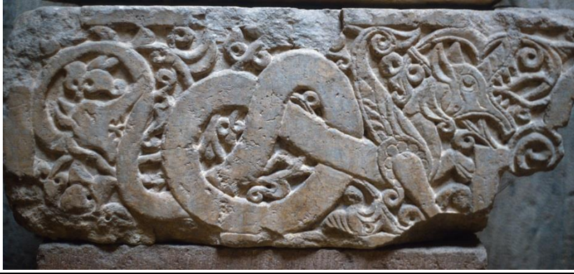
Resim 6. İnce Minareli Medresede bulunan bir Ejder rölyefi 13.Yy Selçuklu dönemi, (URL 10).

Resim 7’de görülen Hayat Ağacı - Bayterek, üç dünya “üst, orta ve alt” şeklinde tasvir edilmiştir. Ağacın üstünde “Üst Dünya” kutsal kuş “Samruk” ve geleceği temsil eden yavruları, ağacın kökünde “Alt Dünya” kötülüğün temsilcisi yılan ejderha, ağacın gövdesinin etrafında “Orta Dünya” hayvanlar ve okunu yılan ejderhaya doğrultmuş insan görülmektedir ve bu biçimiyle Kazak mitolojisine göre Hayat Ağacının özünde yatan felsefeyi ifade etmektedir (URL 5). Kazak mitine göre “Hayat Ağacı” bu şekilde tasvir edilmiştir. Burada ejderhayı, Hayat Ağacının köklerine dolanmış şekilde görmekteyiz ve ejderha kötülüğün simgesi olarak yorumlanmıştır. Ancak, daha yaygın bir bakış açısıyla Hayat Ağacının köklerine dolanmış olan ejder onu muhafaza etmektedir. Orta Asya Şaman inançlarına göre hayat ağacı dünyanın eksenidir, Şaman’a gökyüzü veya yer altı seyahatinde ağaç, merdiven veya yol vazifesi görür. Şaman ağacını, kötü ruhlardan koruyan yaratıklar ise arslan, ejder (yılan ejder) veya başka masal yaratıklarıdır (Alsan, 2005:158).