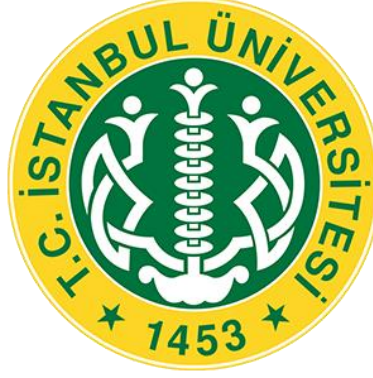
Resim 2. İstanbul Üniversitesi'nin Süheyl Ünver tarafından tasarımı yapılan logosu, (URL 6).

İstanbul Üniversitesi'nin ilk logosu 1933 tarihli ve Türkiye Cumhuriyetinin kurucusuna atfen Atatürk resmi merkeze yerleştirilerek tasarlanmıştır (Resim 1). Bu logonun 1946 yılında Süheyl Ünver'in tasarımına kadar kullanıldığı bilinmektedir (Alkan, 2011:63). 1946 yılında yeniden tasarlanan İstanbul Üniversitesi logosu (Resim 2), 1243 tarihli Selçuklu şifa yurdu motiflerinden esinlenilerek Süheyl Ünver tarafından yaratılmıştır (URL 2). İstanbul Üniversitesinin yeni logosu üzerinde üniversitesinin kuruluş tarihinin Süheyl Ünver'in ve birçok bilim insanının fikir birliği çerçevesinde kurumun temellerinin İstanbul'un fethinden bir gün sonrasına dayanmasından dolayı 1453 yılına tarihlendirildiği görülmektedir.