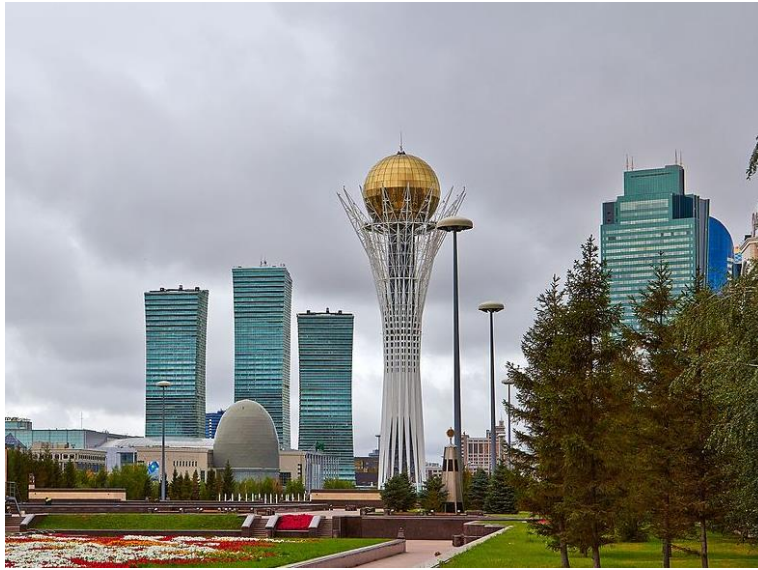
Resim 9. Bayterek Kulesi, Kazakistan, 2002 (URL 12).

Kazak mitinde tasvir edilmiş olan Hayat Ağacı kavramıyla örtüşen İstanbul Üniversitesi logosu, Kazak mitinden farklı olarak, Ejder figürleri ağacın bir koruyucusu olarak düşünülerek tasarlanmıştır. İstanbul Üniversitesi logo tasarımında, Kazak mitindeki hayat ağacı kavramı üç dünya şeklinde, yazılı kaynaklardan edinilen bilgiler ışığında ağacın koruyucusu olarak tasvir edilmiş iki Ejder şeklinde görülmektedir. Ayrıca, Resim 10’da görülmekte olduğu gibi, Erzurum Çifte Minareli Medresede yer alan hayat ağacı altında yer alan ejder çifti de hem yer altı ve cehennem sembolü, hem de hayat ağacının koruyucu bekçi sembolü anlamı