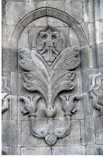
Resim 10. Erzurum Çifte Minareli Medreseden bir Hayat Ağacı rölyefi, XIII. yy sonu Selçuklu dönemi, (URL 13).

yüklenmiştir (Alsan, 2005:126). Bu bağlamda İstanbul Üniversitesi logosunun tam olarak bu rölyefteki tasviri yansıttığı düşünülmektedir.