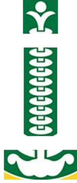
Resim 8. İstanbul Üniversitesi logosundan (Resim 2) kırılmış ve üç parçaya ayrılmış bir detay.

Logonun merkezindeki tasarıma detaylı ve parçalanmış bir şekilde bakıldığında (Resim 8) Kazak mitolojisindeki Bayterek (Hayat Ağacı) minyatüründeki tasvir ile uyduğu görülmektedir. İstanbul Üniversitesi logosunun merkezinde bulunan motif (Resim 8) tıpkı Resim 7’de görülen minyatürdeki “Hayat Ağacı” gibi üç bölümden oluşmaktadır(üst, orta ve alt dünya). Aynı zamanda Resim 9’da görülen Kazakistan’daki Bayterek Kulesi, hayat ağacını temsil etmektedir ve İstanbul Üniversitesi logosundaki motifinde hayat ağacını sembolize ettiği düşünüldüğünde, Bayterek kulesinin formunun İstanbul Üniversitesi logosundaki görüntüye benzediği görülmektedir. İki tasarımında, hayat ağacını sembolize etmek amacını benimsedikleri düşünülmektedir ve bu yüzden aynı formlara ulaşıldığı görülmektedir.