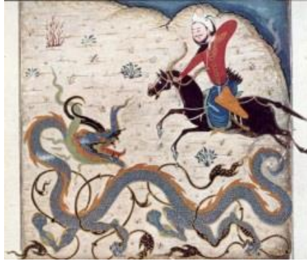
Resim 4. Thor Bahram Ejderhayı öldürüyor m.s. 1370-1371