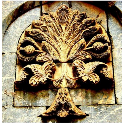
Resim 5. Sivas Gök Medresede bulunan "Hayat Ağacı" rölyefi 1271 yılı Anadolu Selçuklu Dönemi, (URL 9).

Yine Ölmez'in aktardığına göre; eski Türklerde yılan ya da kulaklı yılan olan ejderha (abırğa/acırğa) hayat ağacının bekçisidir (Ögel, 2003:490). İstanbul Üniversitesi'nin logosunun tamamen buradaki kaynakla örtüştüğü düşünülmektedir. Adı geçen üniversitenin logosunda, merkezde bulunan dikeltinin Hayat ağacını sembolize ettiği düşünülmektedir. (Resim 5). İncelemesi yapılan kurumun logosunda merkezde bulunan ve hayat ağacını sembolize ettiği düşünülen dikeltinin sağında ve solunda ki motiflerinde Resim 6'de görülen Ejder rölyefine benzerliği göze çarpmaktadır.