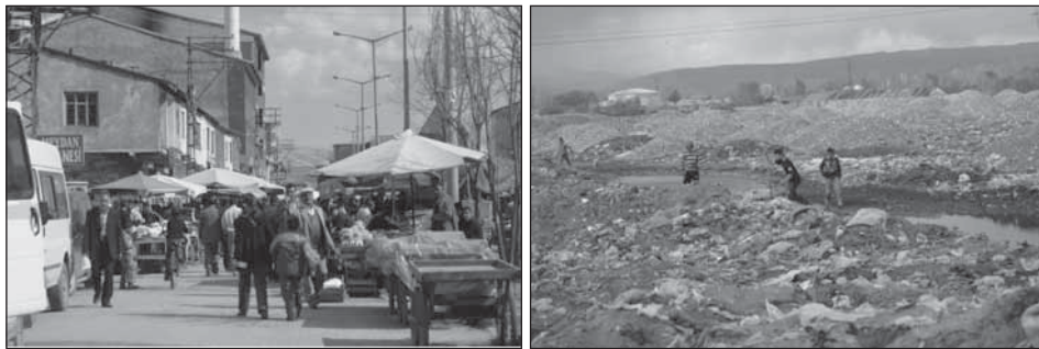
Fotografklar: Ağrı Kentinde Yoksulluğun Yaşandığı Mahallelerden Görünümler.

http://www.worldbank.org/html/fpd/urban/poverty/defining.html#multidimensional (28.09.2002)