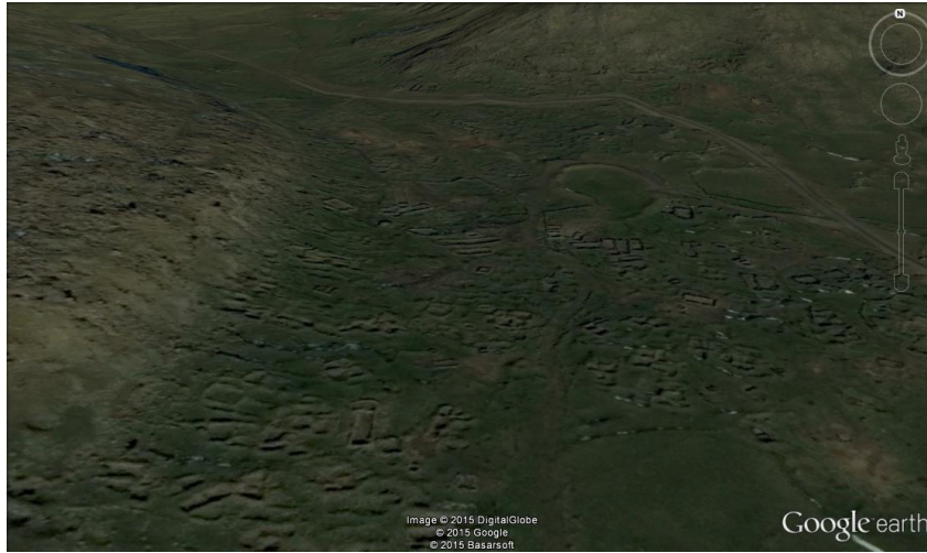
Şekil 10. Kalenin Güney ve doğusundaki Yerleşim İzleri (Goole)

Kalan izler sur dışındaki yerleşimin kalenin güney eteklerinde yoğunlaştığını ve kuzeybatıya doğru yayıldığını da göstermektedir. Coğrafi şartlar ve iklim özellikleri gözetenerek kalenin kuzey yamaçlarının yerleşime açılmadığı anlaşılmaktadır. Zaman içerisinde mevcut yerleşimlerinde yetmediği ve kentin büyümeye devam ettiği anlaşılıyor. Kalenin kurulu bulunduğu tepenin güneybatısında bulunan ve daha alçak olan tepenin kuzeydoğu etekleri ile kalenin güneydoğusunda yer alan yaklaşık 180-200 dönümlük bir sahada görülen yoğun yapılaşma izleri bunun bir göstergesidir (Şekil 10).