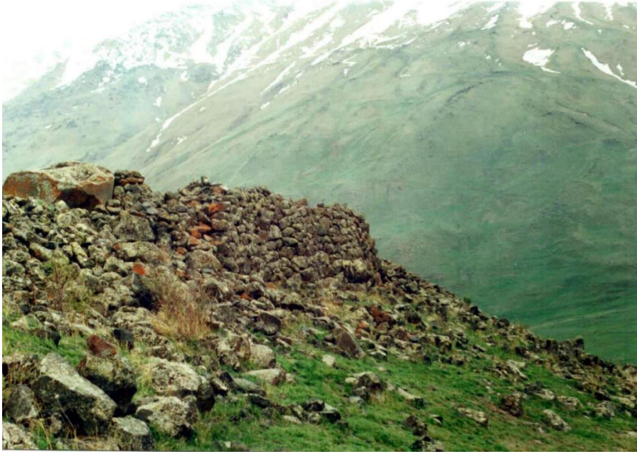
Şekil 3. Tepeden Yamaçlara Doğru İnen Sur Duvarları