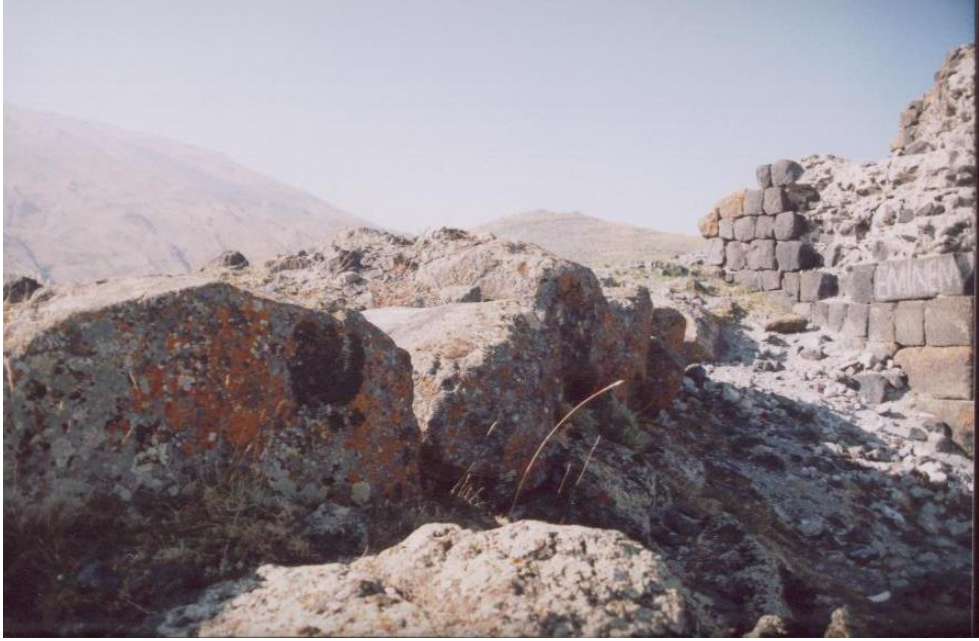
Şekil 5. Sur Temel Kalıntıları.

Tüm tepeyi çepeçevre dolaşan surların temel seviyesinden yukarı kısımlarının horasan harçlı örüldüğü ve ortaçağ duvar karakteri gösterdiği anlaşılmaktadır. Dış surlar ile iç kale arasında kalan alanlarda bol miktarda moloz yığınları bulunmakta olup, bu alanlarda olması muhtemel yapılar hakkında herhangi bir bilgi edinmek mümkün olmamıştır (Şekil 6).