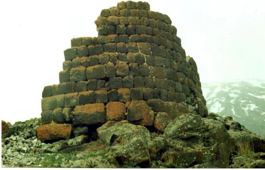
Şekil 7. Kule Kalıntısı.

İç kale kalenin oturduğu tepenin en üst noktasına inşa edilmiş olup, dikdörtgen bir plan yapısı göstermektedir. İç kale içerisinde, kuzey tarafta üç bölümden oluşan bir erzak deposu ile buna bitişik olarak inşa edilmiş biri dörtgen, diğeri yuvarlak olmak üzere (Şekil 8) iki adet su kuyusu görülmektedir (Buyruk 2006: 106).