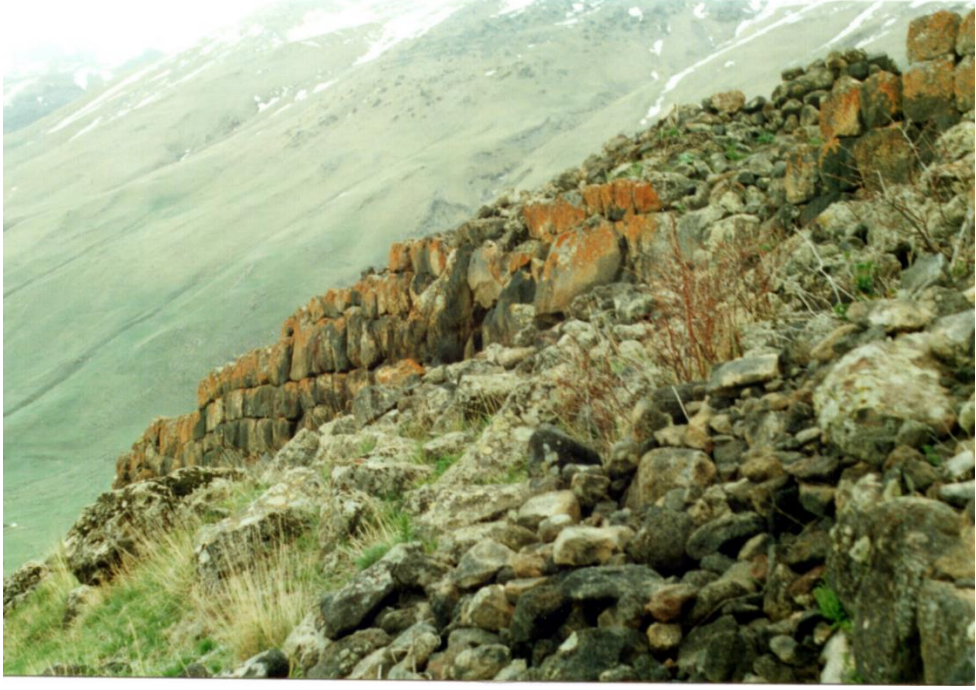
Şekil 2. Tepeden Yamaçlara Doğru İnen Sur Duvarla