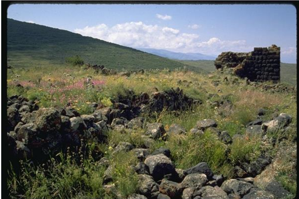
Şekil 6. Moloz Yığınları ve Kule Kalıntısı.

Tüm tepeyi çepeçevre dolaşan surların temel seviyesinden yukarı kısımlarının horasan harçlı örüldüğü ve ortaçağ duvar karakteri gösterdiği anlaşılmaktadır. Dış surlar ile iç kale arasında kalan alanlarda bol miktarda moloz yığınları bulunmakta olup, bu alanlarda olması muhtemel yapılar hakkında herhangi bir bilgi edinmek mümkün olmamıştır (Şekil 6).