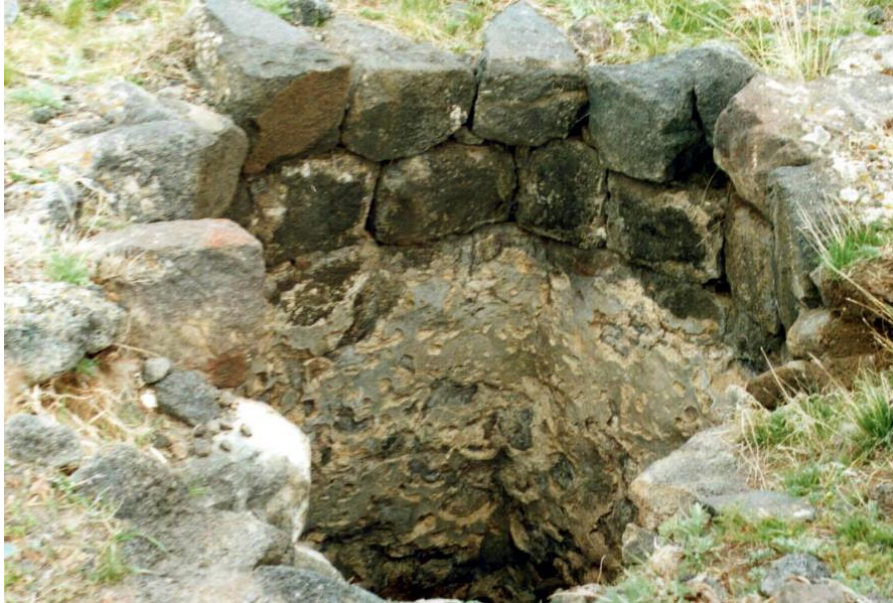
Şekil 8. Su Kuyusu

İç kale kalenin oturduğu tepenin en üst noktasına inşa edilmiş olup, dikdörtgen bir plan yapısı göstermektedir. İç kale içerisinde, kuzey tarafta üç bölümden oluşan bir erzak deposu ile buna bitişik olarak inşa edilmiş biri dörtgen, diğeri yuvarlak olmak üzere (Şekil 8) iki adet su kuyusu görülmektedir (Buyruk 2006: 106).