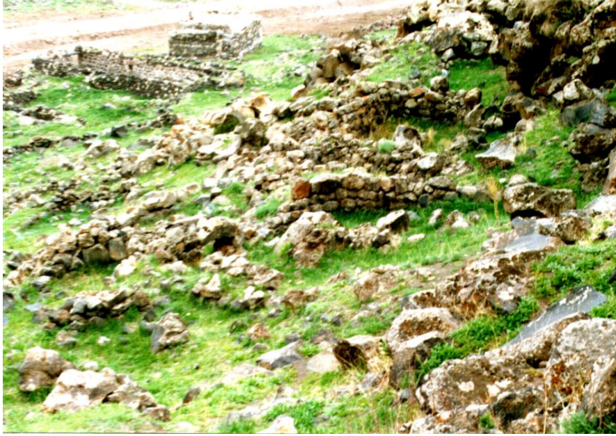
Şekil 9. Güney Yamaçtaki Yapı Kalıntıları.

Bu bilgilerden yola çıkarak İğdir yerleşiminin kent modelleri içerisinde yer alan kale-kent yapısını sonraki dönemlerde de devam ettirdiğini göstermektedir. Hangi tarihleri kapsadığı tam olarak belirlenemeyen dönemler içerisinde nüfusun hızla arttığı ve yerleşimin surların dışına taşdığı anlaşılmaktadır (Şekil 9).