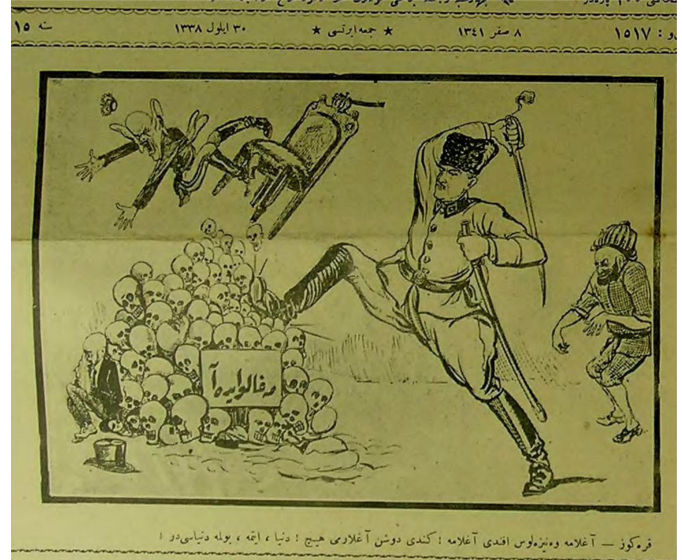
Figür 15. 30 Eylül 338/1922. Karagöz: Ağlama Venizelos Efendi ağlama, kendi düşen ağlar mı hiç. Dünya etme bulma dünyasıdır. (Kafataslarının üzerinde "megali idea" yazılı)

Trakya'dan çekilmesi ve Mudanya'da askeri bir konferans yapılması sağlanmıştır (Yaman, 1992, s. 168). Bu süreçte 30 Eylül 1922 tarihli (Figür 15) karikatür, Yunanlıların tüm Anadolu'yu işgal etme planı olan "megali ideasının" nasıl bir sona erdirildiğini göstermektedir. Burada İzmir'in işgaliyle önemli bir noktaya getirilen büyük idealin şimdi ne ile nihayetlendiğini ele alan karikatürde kan ve işkence üzerine kurulan bu hayalin yarattığı vahşeti kafatasları ile gösteren Karagöz, şimdiki durumu ise iki büküm ağlayan Venizelos'un ve tahtından alaşağı edilen Kral Konstantin'in durumuyla anlatmıştır. Bu hayali tarihin çöplüğüne göndermekte kararlı olan