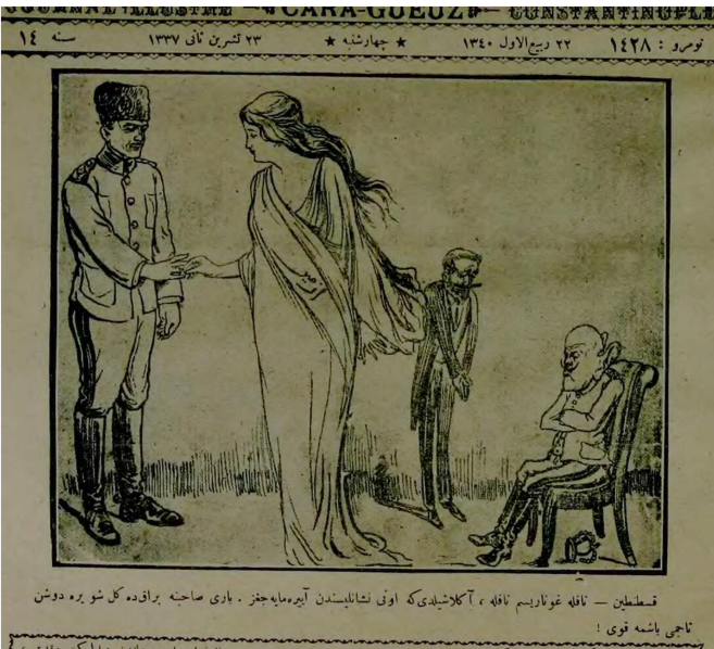
Figür 2. 23 Teşrinisani 1337/ 23 Kasım 1921. Konstantin: Nafilе Gunaris'im nafilе, anlaşıldı ki onu nişanlısından ayıramayacağız. Bari sahibine bırak da gel şu yere düşen tacımı başıma koy. (Hanımın üzerinde İzmir yazılı)

Sakarya Zaferine rağmen Sevr'in ruhunu koruyan diplomatik girişimlere karşı işgali bitirecek ve düşmanı yurttan söküp atacak, bir bakıma Türk Kurtuluş Savaşı'nı kesin sonuca ulaştıracak bir zaferin yine Mustafa Kemal Paşa'nın liderliğinde kazanılacağı