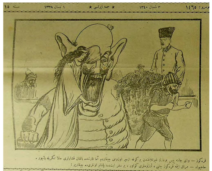
Figür 3. 1 Nisan 1338/1922. Karagöz: Vay canına pisboğazın gırtlığından bir küfe İzmir üzümü çıkardım ama karnında Balkan kaşarları hala tekeriyle yatıyor. Hacivat: Merak etme Karagöz çelebi, üzümünü götür, bir sefer et de, paşam onları da çıkarır.

Karagöz'ün İzmir ile ilişkili ele aldığı konular arasında İzmir Metropolitinin faaliyetleri de bulunmaktadır. İzmir Metropolitini etkin bir düşman olarak Karagöz karikatürlerinde sıklıkla gündeme getirilmiştir. Örneğin 12 Nisan 1922 tarihli karikatürde Papulas ile İzmir metropoliti arasında geçen bir vedalaşma sahnesi ile Yunan Ordusu gittiğinde durumlarının vahim olacağı öngörüsü "Buralarda biraz daha ayak sürürse kuyruğu titreteceğini adı gibi biliyor." "Buralarda biraz daha ayak sürürse kuyruğu titreteceğini adı gibi biliyor." denilerek ifade edilmiştir. Bu karikatürde düşmanın iç işlerine ilişkin bilgilerin verildiği başka karikatürler yine İzmir'le ilişkilendirilerek yayınlanmıştır. Örneğin 3 Mayıs 1922 tarihli (Figür 5) Venizelos'un İzmir'e girme isteğine karşı metropoliti