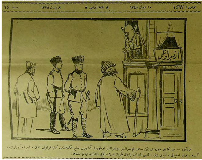
Figür 4. 8 Nisan 338/1922. Karagöz: Hey bana bak çorbacı iki senedir kontratsız montratsız oturduñ ama Paris Sulh Mahkemesi'nden tahliye kararını aldıñ, icra memurlarımızda altta. Bunun istinafı, temyizi yok. Tası tarağı çabuk topla. Karışmam kapı dışarı edilirsen ha.

uyaran Karagöz'ün "aman papaz efendi... sonunda gümbürtüye gidecek sensin galiba" diyerek yaptığı uyarısı düşmanın iç ve dış gelişmelerinin yakından takip edildiğini göstermesi bakımından önemlidir.