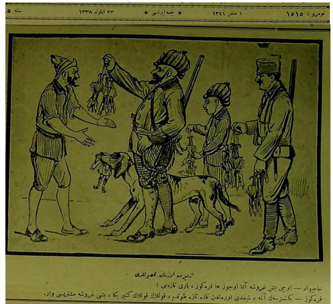
Figür 16. 23 Eylül 338. İzmir'de orman mahsulleri. Hacıvat: Üç beş kuruş ama ucuz ha Karagöz, bari taze mi? Karagöz: Beğenmezsen alma, şimdi ormandan taze taze tuttum, kullan kullan getir bana, beş kuruş a müşterisi var.