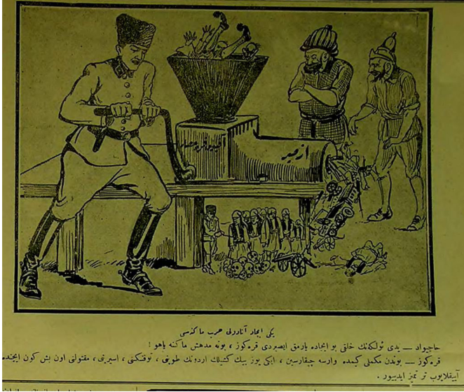
Figür 13. 16 Eylül 338/1922. Yeni icat Anadolu harp makinesi. Hacıvat: Yedi ülkenin halkı bu icada parmak ısırды Karagöz, bu ne müthiş makine yahu. Karagöz: Bundan mükemmel kimde varsa çıkarsın, iki yüz bin kişilik ordunun topunu, tüfeğini, esirini, maktulünü on beş gün içinde ayıklayıp ter temiz edebiliyor.

tamamen temizleneceğini 23 Eylül 338/1922 tarihli (Figür 16) "İzmir'de orman mahsulleri" başlıklı karikatüründe ele almıştır.