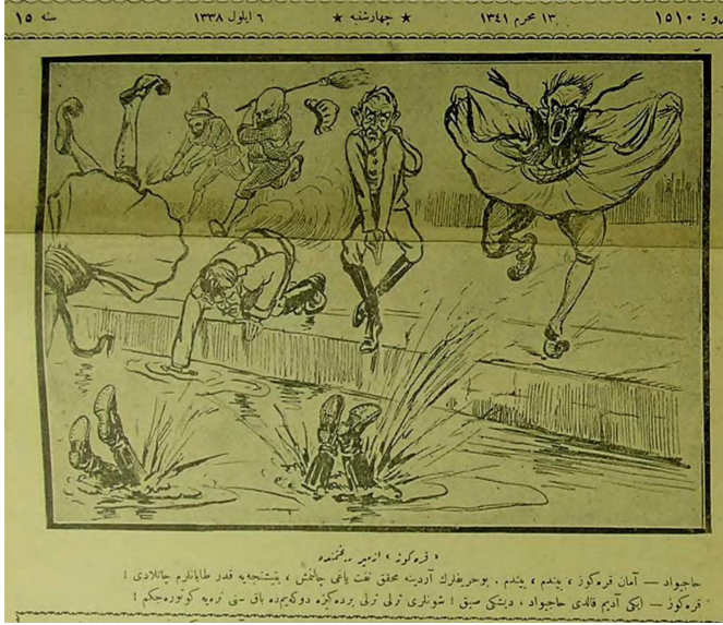
Figür 10. 6 Eylül 338/1922. Karagöz İzmir rıhtımında. Hacivat: Aman Karagöz, bittim, bittim. Bu heriflerin ardına muhakkak neft yağı çalınmış, yetiştinceye kadar tabanlarım çatladı. Karagöz: İki adım kaldı Hacivat, dişini sık, şunları terli terli bir denize dökeyim de bak seni nereye götürceğim.

3 Eylül 1922'de Türk Ortodoks kiliselerinde zafer ayini yapılıyordu (Sarıhan, 1996, s. 625). Zafere ilişkin gelişmeler yaşanırken büyük yenilginin intikamını şehirlerden ve insanlardan çıkarmaya devam eden Yunan Ordusu çekilirken de batı Anadolu'da büyük tahribat yapmıştır. 4 Eylül'de Alaşehir'i yakarak kaçan Yunan Ordusu'nun İzmir'i de tahrip etmesi olasıyken 5 Eylül'de Yunanlıların İzmir'i boşaltma çabaları yoğunlaşmıştı. Büyük bir korkuyla ve can havliyle İzmir'de kendilerini bekleyen gemilere binmeye çalışan Yunan'ın durumunu 6 Eylül 1922 tarihli (Figür 10) karikatüre yansımıştır. Burada yakında hepsinin sonunun geleceği, düşmanın denize döküleceği ve İzmir'in işgalden kurtarılacağı inancını yine tekrarlamaktadır.