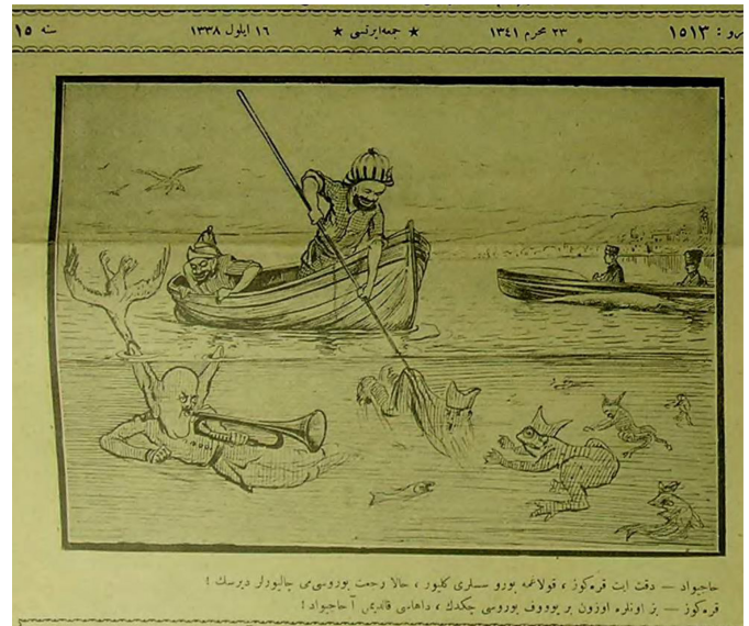
Figür 12. 16 Eylül 338/1922. Hacivat: Dikkat et Karagöz, kulağıma boru sesleri geliyor, hala ricat borusu mu çalıyorlar dersin. Karagöz: Biz onlara uzun bir yuf borusu çektik, dahası kaldı mı a Hacivat.

Batı Anadolu, Yunanistan işgalinden kurtarılmış olmasına rağmen Trakya ve İstanbul'un işgal altında olduğu bir tarihte Karagöz İzmir'de olduğu gibi bütün işgal altındaki bölgelerin Yunandan