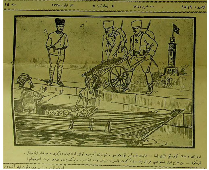
Figür 11. 13 Eylül 338/1922. Ordunun milletin gözbebeği Gazi Paşa: Haydi Karagöz göreyim seni. Şunları açıklara götür ki İzmir'in denizini de mundar etmesinler. Karagöz: Sen sağ ol paşam hiç merak etme, zaten köpek balıklarına ziyafet vadetmiştim. Sayende ben de ahdimi yerine getireceğim. (Güzel İzmir, yeşil Bursa kuvvet ile alındı)

Yunan'ın Batı Anadolu'dan hızla imha edilerek nihayet İzmir'de tamamen yok edilmesini kıyma makinesi örneği ile eşleştiren Karagöz'ün Anadolu harp makinesi dediği bu alete yedi düvelin hayranlığını anlattığı 16 Eylül 1922 tarihli (Figür 13) karikatür dikkate değerdir. Bu makineyle iki yüz bin kişilik ordunun on beş günde nasıl tertemiz ortadan kaldırıldığını mizahi bir üslupla ele alan Karagöz, Afyonkarahisar'dan giren ve İzmir'den çıkan düşmanın topyekun imhasını sağlayan bu makineye Mustafa Kemal Paşa'nın yeni icadı "Anadolu harp makinesi" adını vermiştir.