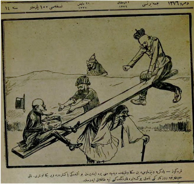
Figür 1. 21 Mayıs 1337/1921. Karagöz: Ya kirye Venizelos, ben sana vaktiyle de dedim seni yere indiren bu elindeki paketlerdir, ver bana onları bak hafifleyince rüzgar gibi nasıl yükselir, karşındakini tepe taklak edersen. (Paketin üzerinde İzmir yazılı)

ayrılmayacağını belirten Karagöz, Yunanlıların da bu hakikati kabul edeceğini öngörmektedir. Dergide güzel ve mahzun bir kadın şeklinde tasvir edilen İzmir'in düşmana yar olmayacağı ve düşmanın nafilе uğraştığı da açıkça gösterilmiştir.