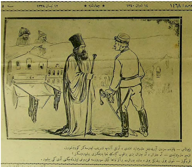
Figür 5. 12 Nisan 338/1922. Papulas: Yakında sizden ayrılacağız metropolit efendi, artık Atina'ya teşrif edersiniz görüşürüz. İzmir Metropoliti: Ah general, ah general bizi bırakıp gitmekle ne yaptığınızı biliyor musunuz? Karagöz: Şunu bunu bildiği yok, sade buralarda biraz daha ayak sürürse kuyruğu titreteceğini adı gibi biliyor.

Karagöz, İzmir Metropoliti'nin Türk düşmanlığı politikasını da yakından takip ettiğini 13 Mayıs 338/1922 tarihli "Papaz mı, diplomat mı, kumandan mı?" başlıklı karikatüründe ele alarak eli silah tutanları cepheye çağıran papazı uyarmaktadır. Karagöz, İzmir Metropoliti kadar Yunan askeri yetkililerinin de İzmir ile ilgili faaliyetlerini yakından takip etmiştir. Örneğin Karagöz'ün 7 Haziran