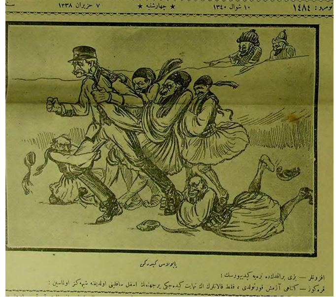
Figür 6. 5 Haziran 1922. Papulas giderken. Efunlar: Bizi bıraktın da nereye gidiyorsun. Karagöz: Günahı azmış kurtuldu. Fakat falanların en nihayet gideceği yer cehennemın esfel-i safilini olduğuna şüpheniz olmasın.

1922 tarihli (Figür 6) karikatüründe 3 Haziran'da istifa eden General Papulas'ın durumu ele alınmıştır. "Papulas giderken" başlıklı bu karikatürde ordusunu bırakıp giden komutanın açıklığı hali ve "Bizi bıraktın da nereye gidiyorsun" diye ayaklarına kapanan Yunan askerinin sefilliği ele alınmıştır. Bilindiği üzere 4 Haziranda Yunan küçük Asya ordusu başkomutanlığına General Hacıanesti getirilmiş, İzmir'e gelerek komutayı alan Hacıanesti, 11 Haziranda İzmir'den Afyon'a geçerek Yunan Ordusunu teftiş etmişti (Sarıhan, 1996, s. 470). Bu gelişmeleri yakından takip eden Karagöz'ün, Yunanistan'ın Anadolu'daki işgaliyle uyguladığı zulüm ve limanlara yaptığı saldırılar yanında Avrupa'nın desteği ile yaptığı savaş blöfü ve kazançlı bir mütareke girişimi karikatürlerine yansıyan konular arasındaydı.