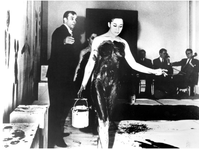
Görsel 11: Yves Klein. "Mavi Dönemin Antropometrisi." (1960). Paris.

Yves Klein'in 1960 yılında: üzerine mavi boya sürülen çıplak kadınların, tuvalin üzerine bıraktığı etki ile gerçekleştirdiği bu eseri önemli çalışmalardan biri olmuştur. Sanatçı daha sonra kendi dairesinde performanslarına devam etmiştir. (Balseçen, 2018: 13).