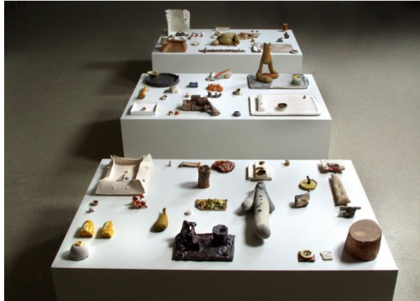
Görsel 21: Neil Brownsword. "Taking Time". (2009). İngiltere.

İngiliz sanatçı Neil Brownsword, 2009 yılında atık ve kalıntılardan oluşan bir enstalasyon sergilemiştir. Stoke-on-Trent şehrinde doğan sanatçı, yaşadığı yerin 17.yy'a kadar uzanan seramik endüstrisi geçmişinden dolayı fabrika atıklarından oluşan bu âtil vaziyette olan seramik parçalarını tekrar fırınlayarak yerleştirme yapmıştır. (Susamoğlu, 2014: 125,126).