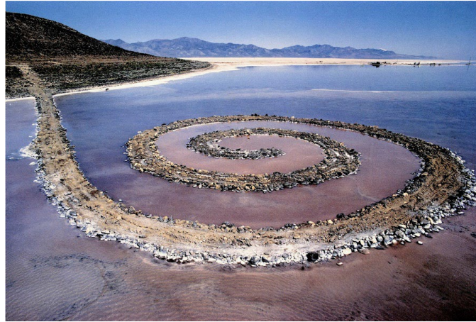
Görsel 10: Robert Smithson. "Spiral Jetty". (1970). Great Salt Lake, Utah.

Robert Smithson, çevre bilincine farkındalık oluşturmak amacıyla, tuz gölünün doğal yapısına müdahale ederek, bir tür diyalektik sanata yönelmiştir. 1970 yılında, Utah'ta gerçekleştirdiği bu çalışma ile sanat eserinin metalaşmasından uzaklaşmaktadır. (Yağmur, 2016: 1981,1982).