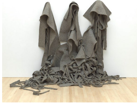
Görsel 13: Robert Morris." Adsız keçe." (1967). New York.