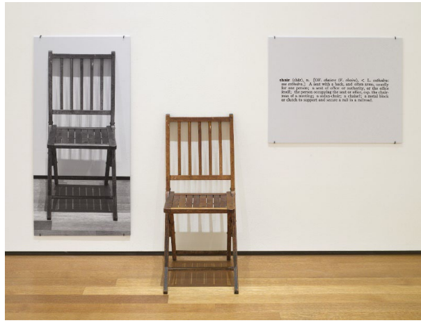
Görsel 8: Joseph Kosuth, "Bir ve Üç Sandalye". (1965). Modern Sanatlar Galerisi, New York.

Joseph Kosuth, sanatı Duchamp'tan öncesi ve sonrası olarak görmüş, "dil yoksa sanat da yoktur" fikrini benimsemiştir. "Bir ve Üç Sandalye" isimli eserinde; sandalyenin kendisi, fotoğrafı ve açıklayıcı tanımını içeren bir çalışma gerçekleştirerek, dilden kavrama uzanan süreci sorgulamıştır. (Antmen, 2009: 196).