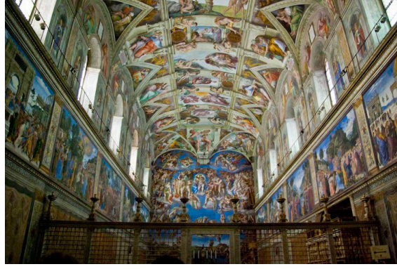
Görsel 2: Michelangelo- Sistine Şapeli. (1483). Vatikan.

Rus konstrüktivist Vladimir Tatlin'in Sosvyet Devrimi'ne olan inancın bir simgesi olarak tasarladığı "3. Enternasyonal Anıtı"; cam, ahşap, karton gibi âtıl malzemeler kullanılarak yapılmıştır. Sarmal bir yapının içindeki; silindir, küp ve kare formlu odaların ayrı ayrı hareketiyle dönen mimari bir yapıdır. (Yelkenli Madencioğlu, 2020: 45).