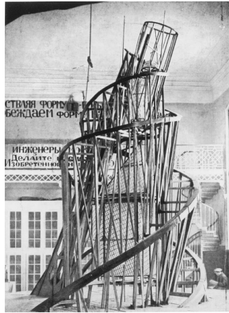
Görsel 3: Vladimir Tatlin. "Üçüncü Enternasyonal Anıtı. (1919). Rusya.

1917 Rus Devrimi'nden sonra Sovyet Cumhuriyetinin ideallerini ilerletmek isteyen sanatçılardan biri olan Vladimir Tatlin'in bu çalışması, dört geometrik yapıyı barındırmaktadır. İçinde devlet basını ve radyo yayınlarının yapılacağı, eğitim ve resmi işlerin yürütülebilmesi için düşünülmüş yapılar bulunmaktadır. Tabanda bir silindir, onun üstünde koni ve ardından küp gelmektedir. Her biri ayrı ayrı hareket eden bu dinamik yapı, dört yüz metre yüksekliğinde spiral şekilde dönmektedir. Sanatçı kütle olmadan hacim yaratarak boşluk ve mekânı birlikte kullanmıştır. Yukarı doğru tüm bu bileşenler halkın ilerleyişini göstermektedir.