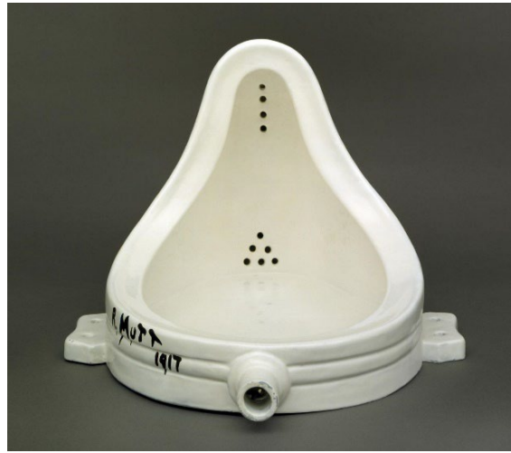
Görsel 4: M. Duchamp, Pisuvar (1917). New York.

1960 sonrası Marcel Duchamp'ın "çeşme" isimli eseri: sanatın ne olduğunu bize tekrar sorgulatan, gelecek akımlara da özgürlük açan önemli bir çalışmadır. Geleneksel malzemeleri bir kenara bırakarak hazır nesne ile kırılma noktası oluşturmuştur. Sanatçının, ters çevrilmiş bir pisuvarın altına R.MUTT imzası ile New York'taki bir galeriye sergilenmesi için gönderilen çalışması, sıra dışı bulunarak sergilenmeye uygun görülmemiştir. Sanatçının eserin üzerindeki imzayla bir bağlantısı bulunmamakla birlikte: R harfinin Almanca'da fakir anlamına gelen Richard'dan geldiği ve Rich kökünün zengin anlamına gelmesi eserin burjuvanın değersizliğine bir saldırı olarak görülerek eserdeki ironiği düşündürmektedir. (Yavuz, 2019: 18; Huntürk, 2016: 252; Yıldız, 2016: 14).