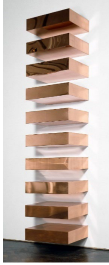
Görsel 6: Donald Judd." İsimsiz".(1969). Guggenheim Müzesi

Dan Flavin, 1963 yılında "The diagonal of personal ecstasy" adlı çalışmasında kullandığı tek çeşit malzemeyi, mekanın bir parçası haline getirmiştir. Çalışmalarında hazır florasan ışık tüplerini kullanan sanatçı, duvara kırk beş derecelik açıyla yerleştirdiği florasan tüpü ile sekiz fitlik bir çizgi oluşturmuştur. Geometri, renk ve ışığı kullanarak minimalist tarzda bir çalışma gerçekleştirmiştir. (Salomon, 2014: 963; Ataseven, 2012: 89).