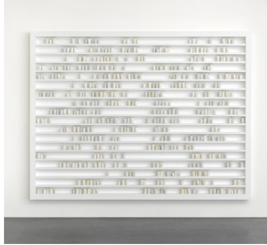
Görsel 18: Edmund De Waal. "A Thousand Hours". (2012). Alan Cristea Galeri, Londra.

bulunmaktadır. Kendisine Viyana Savaşı'ndan iki yüz altmış dört adet Netscape koleksiyon parçası miras kalmıştır. Bu durumdan etkilenen sanatçı enstalasyonda kullandığı seramik kapları kaybolan, çalınan ve kaygıyla hızlı bir şekilde alana yerleştirilmiş bir görüntü vermek istemiştir.