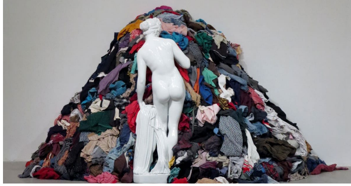
Görsel 9: Michelangelo Pistoletto. "Çaputların Venüsü- veya Paçavralar içinde Venüs". (1974).Tate Modern, Londra.