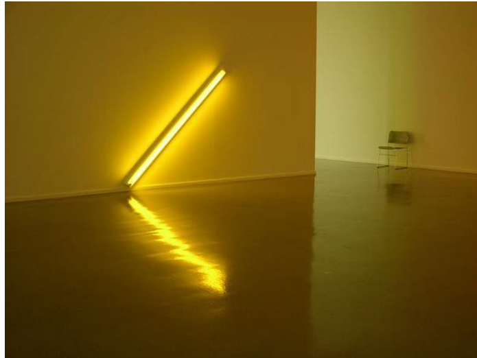
Görsel 7: Dan Flavin. "The diagonal of May 25".(1963). New York.

Dan Flavin, 1963 yılında "The diagonal of personal ecstasy" adlı çalışmasında kullandığı tek çeşit malzemeyi, mekanın bir parçası haline getirmiştir. Çalışmalarında hazır florasan ışık tüplerini kullanan sanatçı, duvara kırk beş derecelik açıyla yerleştirdiği florasan tüpü ile sekiz fitlik bir çizgi oluşturmuştur. Geometri, renk ve ışığı kullanarak minimalist tarzda bir çalışma gerçekleştirmiştir. (Salomon, 2014: 963; Ataseven, 2012: 89).