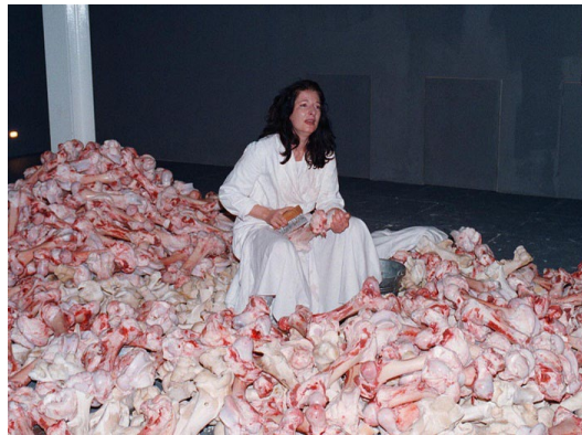
Görsel 12: Marina Abramovic. "Balkan Baroque." (1997). Venedik Bienali.

Marina Abramovic ise Venedik Bienal'inde yaptığı performansında, altı gün boyunca günde altı saat; bin beş yüz adet kemiğin üzerinde kana bulanmış kıyafetiyle kemik temizlemiştir. Bu performans Balkan Savaşı'na metafor olarak düşünülmüştür. (Martinez ve Demiral, 2014: 192).