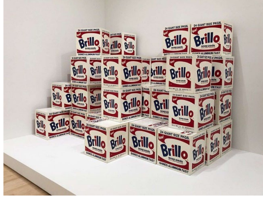
Görsel 5: Andy Warhol. "Brillo kutusu". (1964). Stable Galeri. New York.

Sanat eleştirmeni Arthur Danto, Andy Warhol'un Brillo Kutuları için: "Platon, bunlar arasında yatakların resimleri ile yataklar arasındaki gibi bir ayrım yapamazdı. Aslına bakılırsa, Warhol kutuları basbayağı iyi birer de marangozluk eseriydi. Bu örnek, insanın sanat ile gerçeklik arasındaki farkı salt görsel bağlamlarda kavrayamayacağını ya da "sanat yapıtı"nın anlamını örnekler aracılığıyla öğretemeyeceğini açık bir biçimde ortaya koyuyordu." Söyler. (Danto,2010: 158).