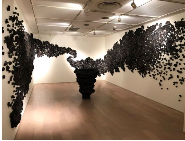
Görsel 20: Satoru Hoshino. "Beginning Form- Spiral 17". ( 2017). New Castle Art Galeri, Avustralya.

İngiliz sanatçı Neil Brownsword, 2009 yılında atık ve kalıntılardan oluşan bir enstalasyon sergilemiştir. Stoke-on-Trent şehrinde doğan sanatçı, yaşadığı yerin 17.yy'a kadar uzanan seramik endüstrisi geçmişinden dolayı fabrika atıklarından oluşan bu âtil vaziyette olan seramik parçalarını tekrar fırınlayarak yerleştirme yapmıştır. (Susamoğlu, 2014: 125,126).