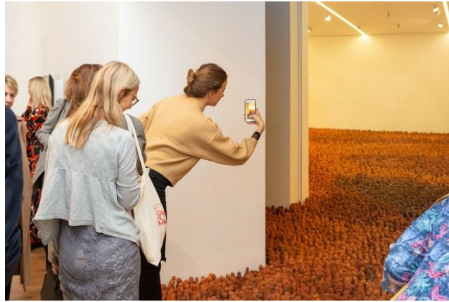
Görsel 14: Antony Gormley." Field". (1994). Tate Galeri.

Londra doğumlu Antony Gromley, 1950 yılında yedi çocuklu bir ailenin en küçük bireyi olarak dünyaya gelmiştir. Dindar bir ailesi olan sanatçı, çocukluğu boyunca sıkı bir Katolik kurallarıyla yetişmiş ve çocukluğu boyunca ailesi tarafından dışlanmış. Britanya Müzesine gittiği bir ziyaret sırasında, bazalt taşından yapılmış bir heykelden çok etkilenmiş ve bu durum sanata yönelmesine vesile olmuştur. Sanatçı arkeoloji, antropoloji ve sanat tarihi eğitimi almıştır. Dini bilgilerini yaptığı eserlerde de sorgulayan sanatçı, "Field" adlı enstalasyon çalışmasında: biz neyiz? nereden geliyoruz ve nereye gidiyoruz? sorularına cevap aramıştır. Yaklaşık kırk bin figür kullanılan bu çalışma, kolektif bir çalışmaya dayanmaktadır. Her parça farklı parmak izine sahip onlarca insan tarafından el ile şekillendirilmiştir. Her figür insan eli boyutunda ve tıpkı bizler gibi farklı tonlardadır. Figürlerin her biri farklı boylarda, ayakta durmuş vaziyette ve gözleri yukarı bakmaktadır. Meraklı ve keşfeden gözlerle bakan bu minik figürler, insanlığın nereye gittiğini sorgular durumdadır. Dünya nüfusunun artışıyla birlikte çok sayıda yapılan göç ve bunun sonucu içinden çıkılmaz bir hale dönüşünü anlatmak isteyen sanatçı izleyicinin dünyadaki yerini sorgulamaya ve düşünmeye teşvik etmektedir.