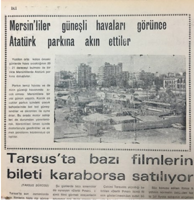
Şekil 2. Merin Lunaparkı açılışı

Not. Yeni Mersin Gazetesi. Ankara Milli Kütüphane arşivinden yazarlar tarafından fotoğraflanarak alınmıştır. Fotoğraflar yazarlara aittir.