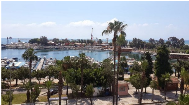
Şekil 4. Mersin Lunapark Eğlence Alanı, 2017