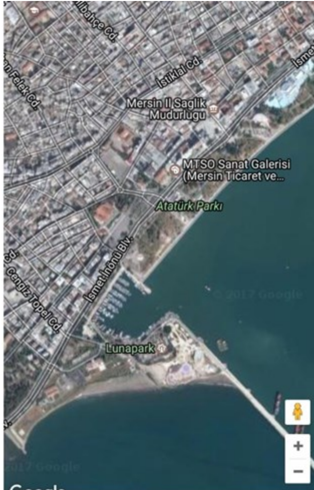
Şekil 1. Mersin Atatürk Parkı ve Lunapark'ın konumu

Cumhuriyetin ilanının ilk yılları ile birlikte modern hayatı toplumla özdeşleştirmeye çalışan Cumhuriyet ideolojisi, bunu başarabilmek için kentlinin gündelik hayatına müdahalelerde bulunur. Ülkenin birçok kentinde bu anlamda mekânsal değişiklikler yapılır. Cumhuriyet ideolojisinin temsil mekânlarından biri olan Ankara'da inşa edilen Gençlik Parkı gibi Mersin'de de Atatürk Parkı, kentliye modern hayatı aşılama için yapılan mekânsal müdahalelerden biridir (Şekil 1). Lunapark ilk yıllarda Atatürk Parkı içinde konumlanmıştır (Şekil 2-3). 2000'li yıllara gelindiğinde ise modern hayatın eğlence anlayışı değişmiştir. Lunapark daha sonra geçici bir konuma gelerek Cumhuriyet Meydanı içerisinde sadece festivallerde açılmış daha sonra ise sahile taşınmıştır (Şekil 4). Bugün ise Lunapark yoktur.