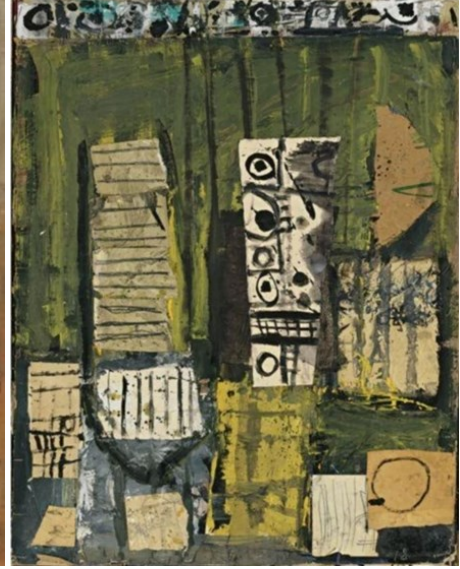
Şekil 3. Quicksand, Robert Smithson, 1959

Robert Smithson'un 1960'lı yıllarda heykel çalışmalarına odaklanmış ve Donald Judd, Carl Andre, Sol Le Witt gibi sanatçıların çalışmalarına benzerlik göstermekle birlikte bireysel anlamda resimden uzaklaşıp heykelle yönelim göstermiştir (Wolf, 2012). Smithson'un ilk heykel çalışmaları sergi salonlarında yer alan, çelikten yapılmış eserlerdir. Terminal (1966, Şekil 4) ve Plunge (1966, Şekil 5) eserleri yine sanatçının galerilerde sergilenen eserlerindedir.