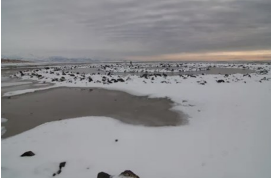
Şekil 5. Spiral Jetty Winter, Greg Lindquist, 2011

4,6 metre eni ve 460 metre boyu olan çalışmada kullanılan 7.000 ton bazalt kayanın o bölgede bulunmasının kolay olması yine eserin kendi doğasına bir gönderme niteliğindedir (Kır, n.d). Bazalt kayaların zamanla değişen iklim ve mevsim şartlarının etkisiyle yosun miktarının artması ve tuz tabakalarına maruz kalmasıyla suya rengini vermesi eserin çevreyle etkileşime girmesi, hareket ve mekân algısına yeni bir soluk getirmiştir. Artan su miktarı kimi zaman eseri görünmez kılmaktadır. Fakat bu durum eserin tam da amacına hizmet etmektedir. 1970 yılından 2002 yılına kadar sürekli görünüp kaybolan Spiral Jetty, 2002 yılında suların çekilmesiyle tamamen kendini ortaya çıkarmıştır.