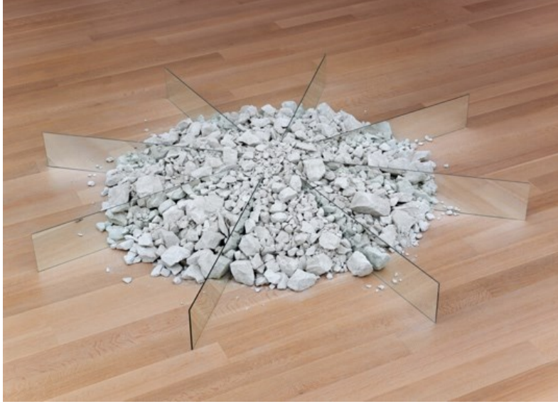
Şekil 6. Chalk-Mirror Displacement, Robert Smithson, 1969

olmayan ayna ve işlem görmüş cam gibi malzemelerle enstalasyon çalışmaları yapmıştır. El değmemiş doğal ortamlarda bulunan yapay nesnelere, bu denli insan müdahalesinin verdiği rahatsızlık hissi eserlerini dikkat çekici kılmıştır. Yapay nesnelere doğal ortamda sergilemenin yanı sıra gezi sırasında topladığı doğal malzemeleri yine zıtlık oluşturmak için galeri eserlerine dahil etmiştir. Kum, mika ve kireçtaşı gibi malzemeleri sanat galerisi ortamında sergileyerek iki farklı bölgeyi tek bir alanda toplamayı ve onu izleyiciyle buluşturmayı başarmıştır (Şekil 6).