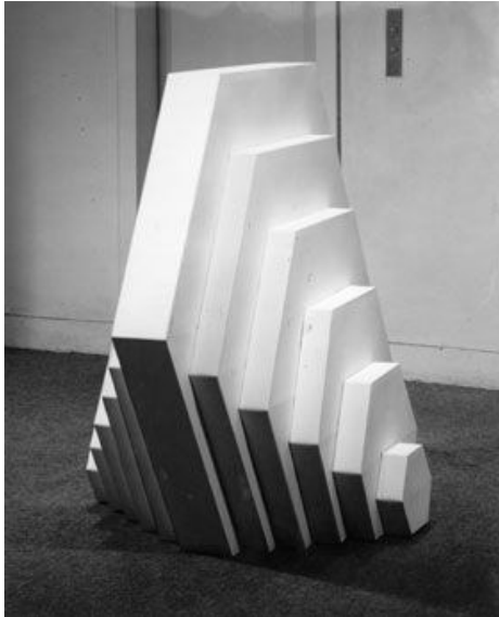
Şekil 4. Terminal, Robert Smithson, 1966

Robert Smithson'un 1960'lı yıllarda heykel çalışmalarına odaklanmış ve Donald Judd, Carl Andre, Sol Le Witt gibi sanatçıların çalışmalarına benzerlik göstermekle birlikte bireysel anlamda resimden uzaklaşıp heykelle yönelim göstermiştir (Wolf, 2012). Smithson'un ilk heykel çalışmaları sergi salonlarında yer alan, çelikten yapılmış eserlerdir. Terminal (1966, Şekil 4) ve Plunge (1966, Şekil 5) eserleri yine sanatçının galerilerde sergilenen eserlerindedir.