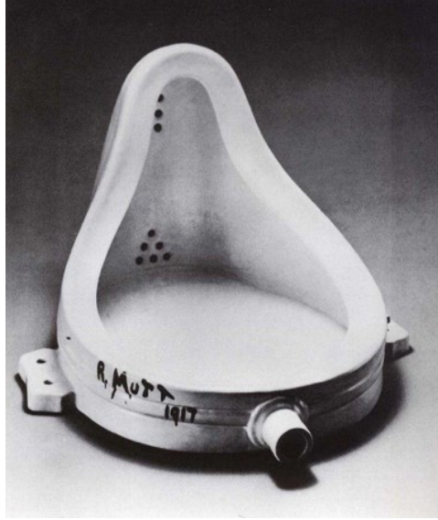
Şekil 1. Marcel Duchamp, Fountain, 1917

fikirle harmanlayarak ifade ederler. Bu anlatılan durumun en açık örneklerinden bir tanesi ise Şekil 1’de görülen Duchamp’ın Fountain eseridir (Yılmaz, 2013, s. 304). Birçok insanın sadece tuvalette gördüğü bu nesneyi, sanatçının bir sanat eserine dönüştürmesi aslında anlatılan durumu en iyi özetleyen olaydır.