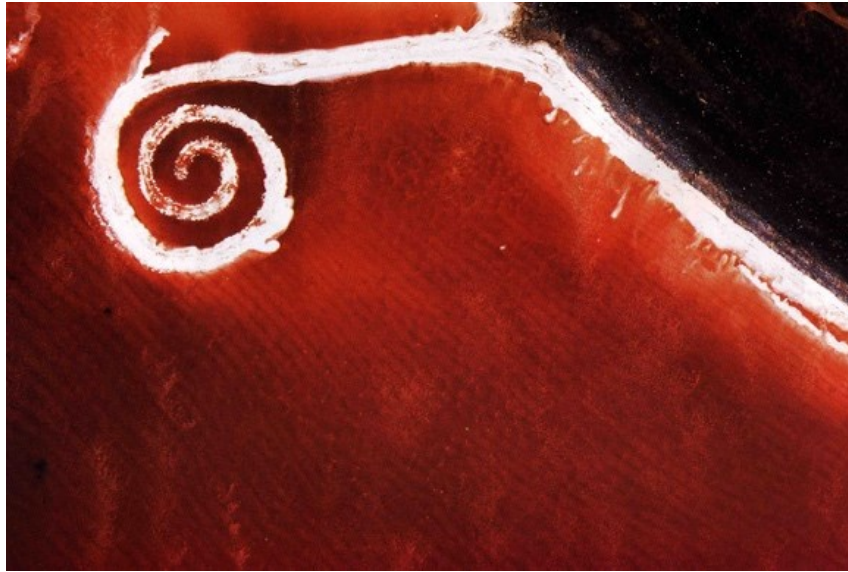
Şekil 3. Spiral Jetty, Robert Smithson, Havadan Görünüm

Smithson'ın Spiral Jetty adlı eseri (Şekil 8), sanatın teleskopla görülebilir olması fikrini ortaya atarak sanatın sadece galerilerde sergilenmekle kalmayıp açık havada da deneyimlenebileceğini vurgular. Bu eser, doğayı ve çevreyi sanatın bir parçası olarak kullanarak izleyicilere farklı bir deneyim sunar (Kedik, 1999, s. 105).