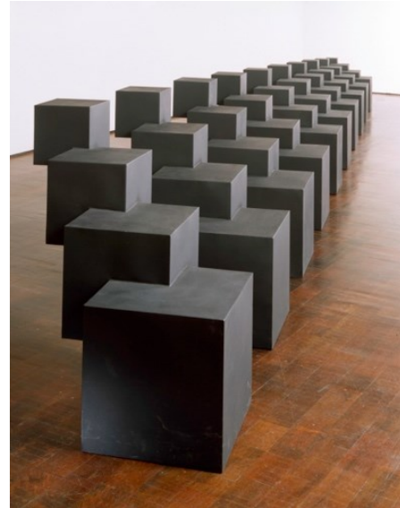
Şekil 5. Plunge, Robert Smithson, 1966

Smithson doğa ve çevre konularına ilgisinden dolayı eşi Nancy Holt ve sanat simsarı Virginia Dwan ile Amerika ve Avrupa'da şehir gezilerine çıkmıştır. Buralarda gördüğü bölgelerin bazılarında (tuz gölleri, ormanlık ve ağaçlık bölge, çorak arazi, kum arazileri) doğal