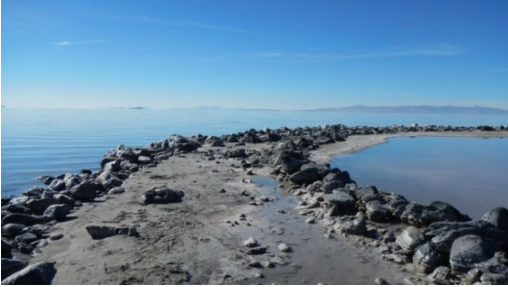
Şekil 2. Spiral Jetty, Robert Smithson, Yerden Görünüm

Smithson'ın Spiral Jetty adlı eseri (Şekil 8), sanatın teleskopla görülebilir olması fikrini ortaya atarak sanatın sadece galerilerde sergilenmekle kalmayıp açık havada da deneyimlenebileceğini vurgular. Bu eser, doğayı ve çevreyi sanatın bir parçası olarak kullanarak izleyicilere farklı bir deneyim sunar (Kedik, 1999, s. 105).