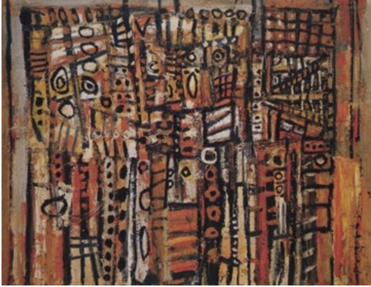
Şekil 2. Walls of Dis, Robert Smithson, 1959

Smithson, 1950'lerin sonlarında sanat simsarı Virginia Dwan tarafından fark edildikten sonra ilk kişisel sergisini 1959 da Artist Gallery'de açmıştır. Bu dönemde heykel çalışmalarına başlamadığından bu sergi resimler ve kolajlardan oluşmaktadır. Smithson'un bu sergisi Soyut Dışavurumcu eserlerin ağırlıkta olduğu ilk kişisel sergisidir.