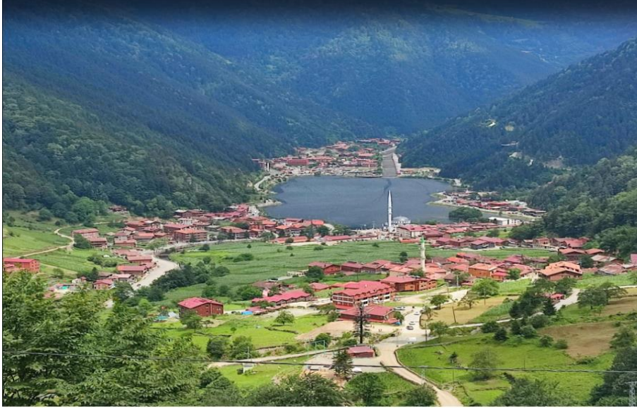
Foto. 2. 2021 yılında Uzungöl'den bir görünüm

Ancak Foto. 2.'ye bakıldığında 2021 yılında Uzungöl'de yapılaşmanın oldukça arttığı, göl çevresinde betonlaşmanın görüldüğü ve doğal görünümünden iyice uzaklaşıp görüntü kirliliğinin de oluştuğu söylenebilir. Diğer taraftan bölge için önemli olan göl kaynağı ve gölü ulaşan akarsu yollarında da betonlaşma yaşandığı ve yapay bir göl görüntüsüne büründüğü ifade edilebilir.