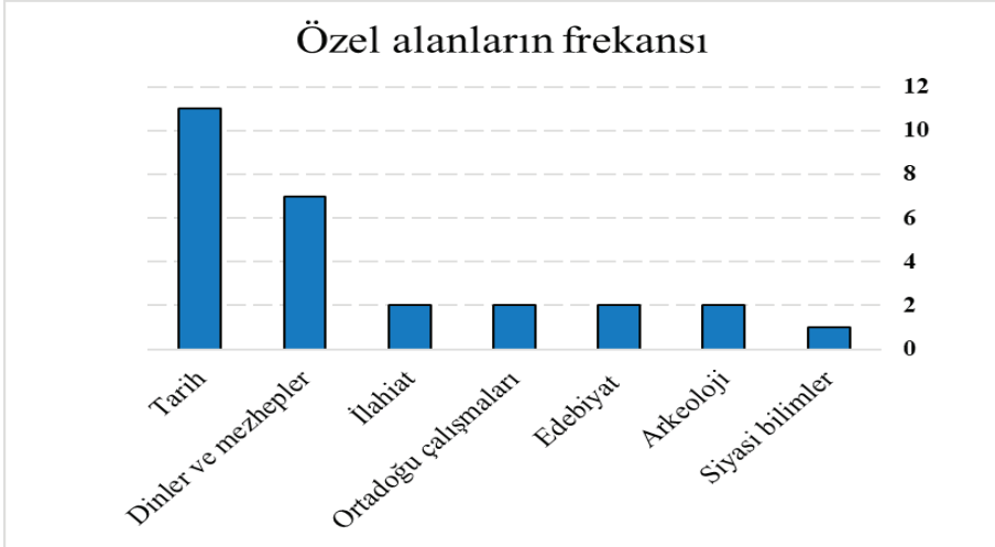
Grafik 3: Özel alanların frekansı

Bu minvalde grafik 3'te göz önüne geldiği soratta tarih, dinler ve mezhepler, ilahiyat, Ortadoğu çalışmaları, edebiyat, arkeoloji ve siyaset bilimleri alanlarındaki araştırmacıların eserlerinde bu konuyu ele aldıkları tespit edilmiştir. Görüldüğü gibi kategorileri sırladığımız, ölçme ve değerlendirme yaptığımızda tarih, din ve mezhep alanındaki araştırmacıların Bektaşilik ve bu tarikatın kurucusu olan Hacı Bektaş Veli hakkında daha çok makale yazıp yayınladıkları ortaya çıkmaktadır.