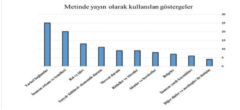
Grafik 5: Metinde yayın olarak kullanılan göstergeler