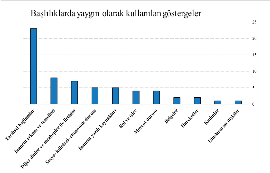
Grafik 1: Başlıklıklarda yaygın olarak kullanılan göstergeler

Grafik 1'de görüldüğü gibi, İranlı yazarların eserlerinde Bektaşilik Tarikati ve kurucusu Hacı Bektaş Veli'nin tarihi seyrinin incelenmesi büyük önem taşımaktadır. Bunun ardından bu tarikatın fikri mahiyeti ve dini temelleri, sonra tarikatın diğer dinler ve mezhepler ile iletişimi, daha sonra bu tarikatın sosyokültürel ve ekonomik koşulları sırasıyla ikinci, üçüncü ve dördüncü sırada yer almaktadır.