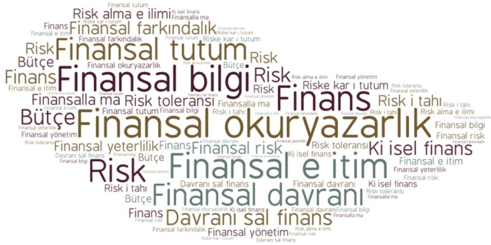
Şekil 4. Yaygın Kullanılan Anahtar Kelimeler