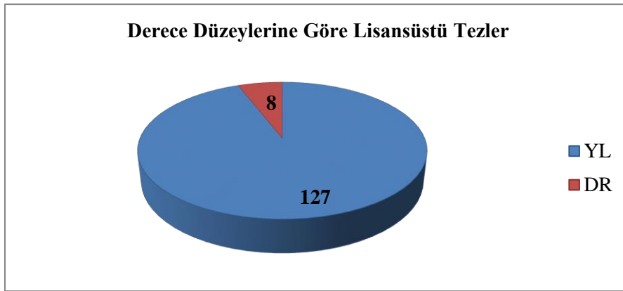
Şekil 1. Derece Düzeylerine Göre Finansal Okuryazarlık ile İlgili Lisansüstü Tezler

Bu bölümde 2010-2022 yılları arasında finansal okuryazarlık üzerine yazılmış lisansüstü tezlerin betimsel bulguları sunulmaktadır.