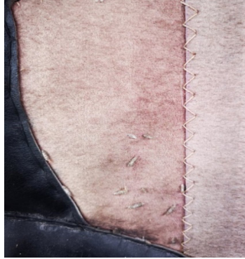
Fotoğraf 31: Ulu Cami kapı perdesinde bulunan güveler (Küçükkurt Arşivi, Afyonkarahisar, 2022).