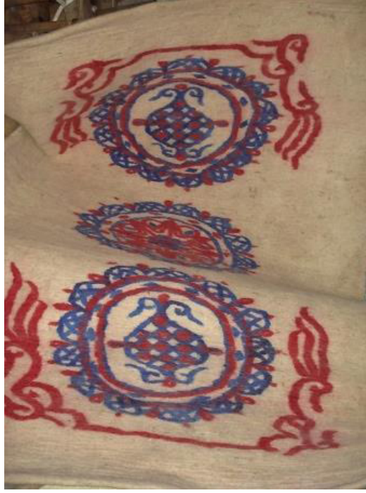
Fotoğraf 4: Yaşar Kocataş'ın yapmış olduğu saraçlanmak üzere deri ustasına gidecek Kurra Camisi kapı perdesi (Yalçınkaya Arşivi, Afyonkarahisar, 2009).

Perdelerin dayanıklılığını artırmak için çevresi deriyle çevrelenmektedir. Bazı keçe ürünlerinin dayanıklılığını artırmak ve süslemek için deri ile çevreleme işlemi Pazırık Kurganı buluntularında tespit edilmiştir. Pazırık 1. Kurgan'dan çıkan eşyalar arasında, MÖ. 5. yüzyıla tarihlendirilen 120cm uzunluğunda ve 60 cm genişliğinde olan ince kırmızı keçeden yapılmış eğer örtüsünün kenarları, deri şeritlerle süslenmiştir. 16