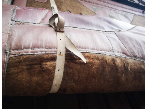
Fotoğraf 13: Deri kuşak (Küçükkurt Arşivi, Afyonkarahisar, 2022).