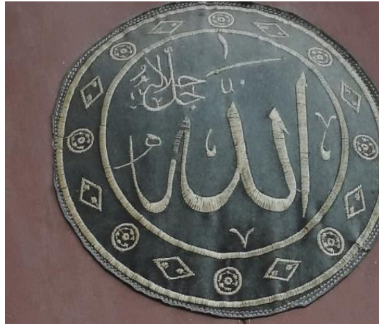
Fotoğraf 9: Mevlevi Türbe Camisi kapı perde işlemleri (Küçükkurt Arşivi, Afyonkarahisar, 2022).