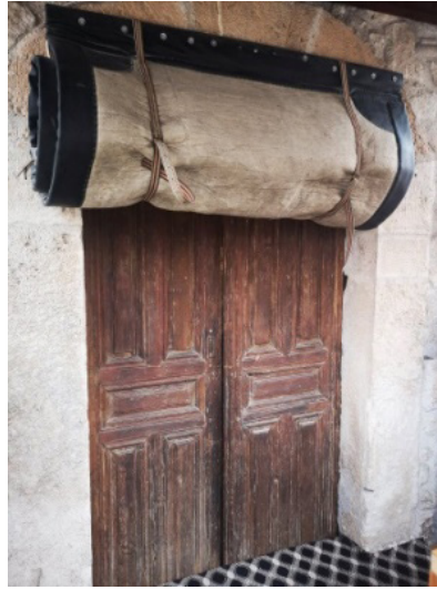
Fotoğraf 2: Yaşar Kocataş'ın yapmış olduğu Emirdağ Çarşı Camisi kadınlar bölümü keçe kapı perdesi.

Osmanlılar zamanında parlak dönemini yaşamış olan deri ürünleri saray atölyelerinde üretilmiş, profesyonel işlemeciler tarafından süslenmiştir. Bu ürünler arasında kapı perdeleri yer almaktadır. 19. yüzyıla gelindiğinde işleme sanatının güzel örnekleri arasında kapı perdeleri bulunmaktadır. 3