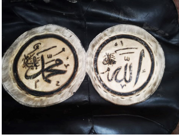
Fotoğraf 8: Ulu Cami kapı perdesinde oğlak derisine basılmış “Allah Celle Celâluh” ve “Muhammed Aleyhisselam” yazısı (Küçükkurt Arşivi, Afyonkarahisar, 2022).