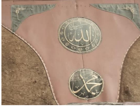
Fotoğraf 17: Mevlevi Türbe Camisi kapı perde ayrıntısı.