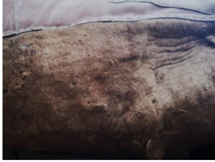
Fotoğraf 30: Mevlevi Türbe Cami'si perde keçesinin güve delikleri (Küçükkurt Arşivi, Afyonkarahisar, 2022).

Perdelerin keçeden üretilmiş olması nedeniyle bakımlarının yapılması gerekmektedir. Güve, toz, güneş ışığı, nem perdeler zarar vermektedir. Bu nedenlerle perdeler kısa zamanda deforme olmaktadır. Perdelerin bahar mevsimi ile kapıdan alınarak dürülüp saklanması esnasında ortam şartlarının uygun olması gerekmektedir. Sürekli nemli ve karanlık ortamlar güvelenme ve küflenmeye zemin hazırlamaktadır (Fotoğraf 30-31). Uzun süre kapıda asılı olan perdeler direk güneş ışığına ve toza maruz kalmaktadır (Fotoğraf 32). Perdelerin kontrollerinin yapılması, yıkanması, zararlılara karşı ilaçlanması, camilerde görevli bulunan yetkililerin perdeleri saklama şartları konusunda bilgilendirilmesi gerekmektedir.