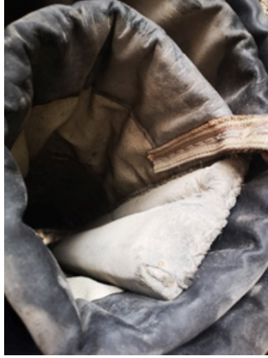
Fotoğraf 12: Rulo yapılmış perde (Afyonkarahisar-Emirdağ, 2022).