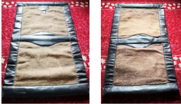
Fotoğraf 20: Kurra Camisi kadınlar girişi kapı perdesinin önü ve arkası (Küçükkurt, Afyonkarahisar, 2022).

4. örnek; Kurra Cami'si kadınlar girişinde bulunmaktadır. Kapı perdesini keçe ustası İsmail Erkuş yapmıştır (Fotoğraf 20). Perde Karaman kuzu yününden, 120 cm x 220 cm ebadında ve 2 cm kalınlığında tek parça üretilmiştir. Perdenin çevresinde ve ortasında dana derisi kullanılmıştır. Perdenin altı, üstü ve ortasına çam ağacından yapılmış çubuklar geçirilmiştir. Derinin dikim işini usta İsmail Erkuş yapmıştır. Perdede herhangi bir süsleme unsuru kullanılmamıştır. Perde iyi durumdadır.