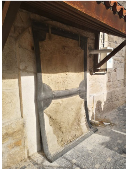
Fotoğraf 25: Emirdağ Çarşı Camisi güney kapısında bulunan kapı perdesi.