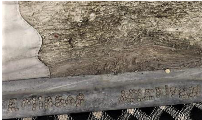
Fotoğraf 14: Perdenin ucuna “Emirdağ Belediyesi” yazılmıştır (Küçükkurt Arşivi, Afyonkarahisar-Emirdağ, 2022).