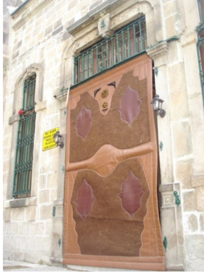
Fotoğraf 15: Mevlevi Türbe Camisi kapı perdesi (, Afyonkarahisar, 2009).