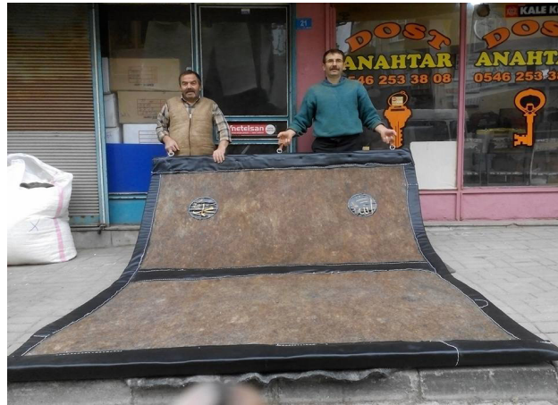
Fotoğraf 27: Şuhut Ulu Cami kapı perdesi.

8. örnek; Afyonkarahisar-Şuhut ilçe merkezinde bulunan Ulu Cami'nin giriş kapı perdesidir ve Erkuş Kardeşler Keçe Kepenek Atölyesi'nde üretilmiştir (Fotoğraf 27). Perde Karaman kuzu yününden, 250cmx310cm ebadında ve 2cm kalınlığında, iki parça üretilmiştir. Perdenin çevresinde ve ortasında Konya'dan getirtilen dana derisi kullanılmıştır. Derinin dikim işlerini İsmail Erkuş usta yapmıştır. 30 Daire şeklinde kesilmiş dana derisi üzerine baskı tekniği ile "Allah" ve "Muhammed" yazılmış hazırlanan bu parça keçenin üzerine daha sonra dikilmiştir.