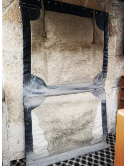
Fotoğraf 26: Emirdağ Çarşı Camisi kadınlar bölümü girişinde bulunan kapı perdesi.