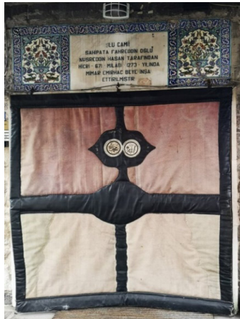
Fotoğraf 23: Ulu Cami keçe kapı perdesinin branda kaplanmış hali