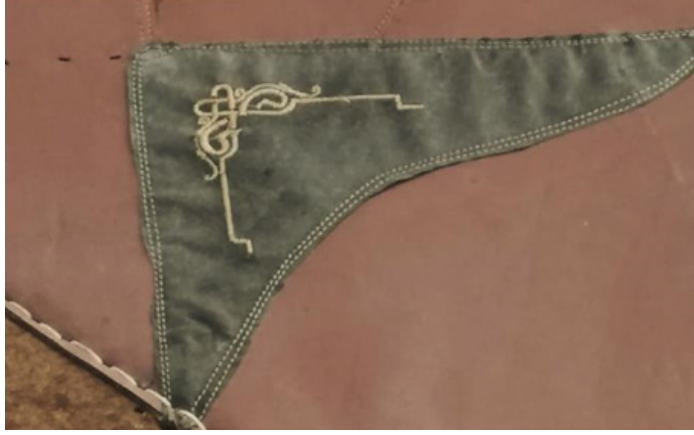
Fotoğraf 7: Mevlevi Türbe Camisi kapı perde işlemleri (Küçükkurt Arşivi, Afyonkarahisar, 2022).