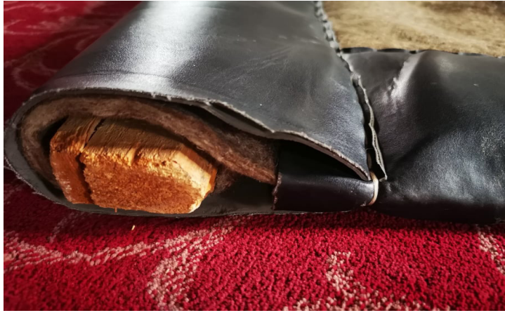
Fotoğraf 6: Perdenin çam kütüğünden ağırlığı (Küçükkurt Arşivi, Afyonkarahisar, 2022).

Deri kısmına uygulanan yazılarla süslenen kapı perdelerinde baskı, boyama ve dival işi işleme tekniği kullanılmaktadır. Genellikle ceylan derisi, oğlak derisi üzerine baskı tekniği kullanılarak yazılar uygulanmaktadır. Deriye uygulanan dival işinde daha çok ince deriler tercih edilmektedir. Deri üzerine desen ve yazılar sim, sırma, ipek iplik kullanılarak oluşturulmaktadır. 19 Daire ve oval kesilmiş deri üzerine çerçeve olarak kare, üçgen, baklava şeklinde küçük motifler yerleştirildiği gibi köşe süslemelerinde rumi ve çiçek dalları kullanılmaktadır (Fotoğraf 7). Genellikle deri üzerine “Allah” ve “Muhammed”, “Allah Celle Celâluh”, “Muhammed Aleyhisselam” yazılmaktadır (Fotoğraf 8-9-10).