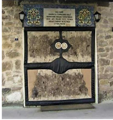
Fotoğraf 21: Ulu Cami'nin kapı perdesi. 28