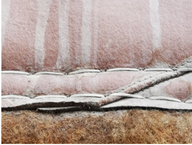
Fotoğraf 5: Keçe ve derinin birleştirme dikişi (Küçükkurt Arşivi, Afyonkarahisar, 2022).

kokusu güve zararlısını keçeden uzak tutmakta, güvelenmeyi geciktirmektedir. Bu nedenle çam ağacı kütüğü kullanılmaktadır (Fotoğraf 6). Kütükler perdenin düzgün durmasını, kenarlarının kıvrılmamasını sağlamaktadır. Perdenin ortasından geçirilen kütük iki parçadır. Bu özellik perdenin rahat açılmasını sağlamaktadır. Üst ve alt kütük tek parçadır.