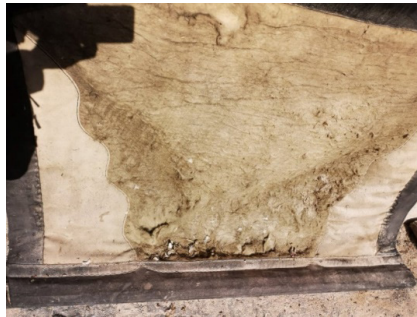
Fotoğraf 32: Emirdağ Çarşısı Camisi güney kapı perdesinde toz, sökülme ve güve zararlısı (Küçükkurt Arşivi, Afyonkarahisar-Emirdağ, 2022).

Son zamanlarda perdelerin üretiminde keçe ve deri yerine ucuz ve üretim kolaylığı nedeniyle sentetik malzemelerin kullanıldığı görülmektedir. Yün ve deri ücretlerinde ki artış keçe perdelerin üretim maliyetlerinin artmasına neden olmaktadır. Keçe ve deri ustalarının malzeme temini konusunda desteklenmesi gerekmektedir.