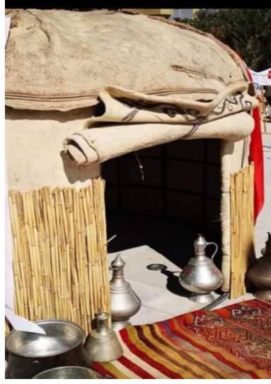
Fotoğraf 1: Emirdağ Topak ev ve keçe kapısı (Küçükkurt Arşivi, Afyonkarahisar, 2019).