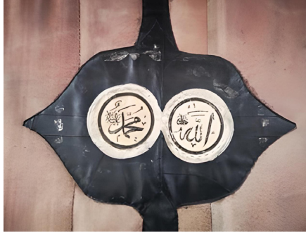
Fotoğraf 22: Ulu Cami kapı perdesinin oğlak derisine basılmış “Allah Celle Celâluh” ve “Muhammed Aleyhisselam” yazısı (Küçükkurt Arşivi, Afyonkarahisar, 2022).