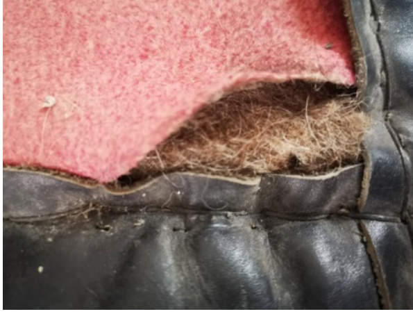
Fotoğraf 24: Ulu Cami kapı perdesinin kaplama içinde kalan keçesi.