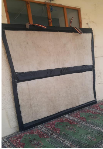
Fotoğraf 28: Afyonkarahisar Erkuş Keçe Atölyesi'nde Eskişehir Çifteler Camisi için üretilen kapı perdesi.