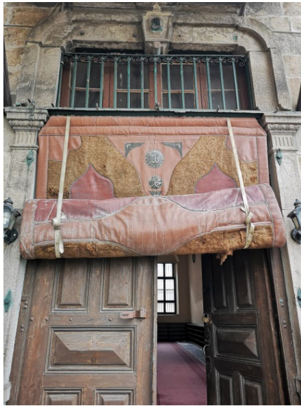
Fotoğraf 16: Mevlevi Türbe Camisi kapı perdesi (Küçükkurt Arşivi, Afyonkarahisar, 2019).