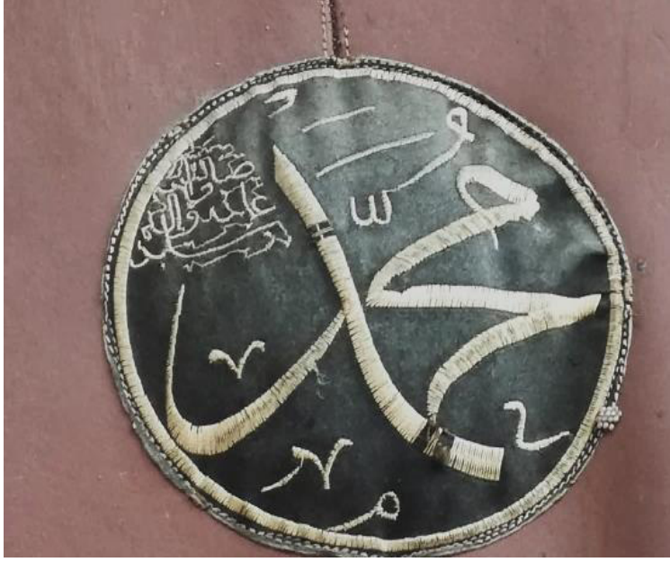
Fotoğraf 10: Mevlevi Türbe Camisi kapı perde işlemeleri (Küçükkurt Arşivi, Afyonkarahisar, 2022).

Süslemeleri tamamlanan perdenin yerine asılabilmesi için metal askılıkları takılmaktadır (Fotoğraf 11). Perdeler bazı günlerde rulo yapılarak kapının üstünde muhafaza edilmektedir. Bu nedenle perdenin rulo yapılabilmesi için kayışları dikilmektedir (Fotoğraf 12-13). Kayışlar deriden yapıldığı gibi örgü kayışlarda tercih edilmektedir. Perdelerin alt kısmına saraçlamayı yapan ustanın adı ya da yaptıran kişinin, kurumun adı tercihe göre yazılmaktadır (Fotoğraf 14).