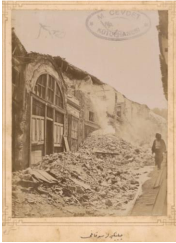
Şekil 4. Çilingirler Sokağı