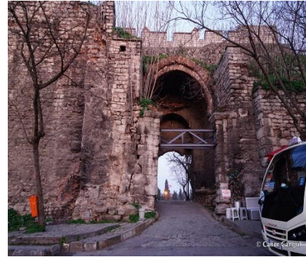
Şekil 11. Edirne Kapısı (Kültür Envanteri, 22 Eylül 2023, https://kulturenvanteri.com/ver/?p=87 )