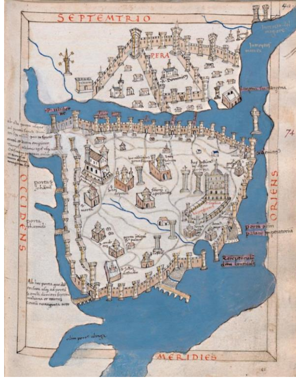
Şekil 1. Cristoforo Buondelmonti'nin 1422 (?) tarihli Konstantiniyye Haritasının Bir Nüshası (Cristoforo Buondelmonti, Liber Insularum Archipelagi, Biblioteca Medicea Laurenziana, Plut.29.25, vr. 42r.)