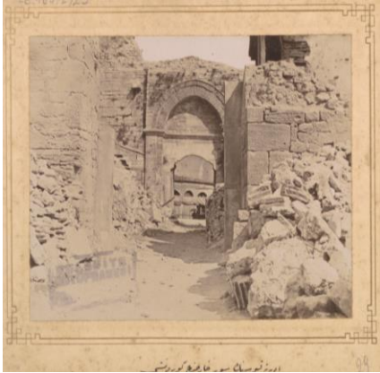
Şekil 10. Edirnekapı'nın Sur Haricinden Görünüşü