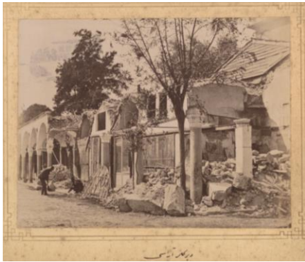
Şekil 6. Direklerarası