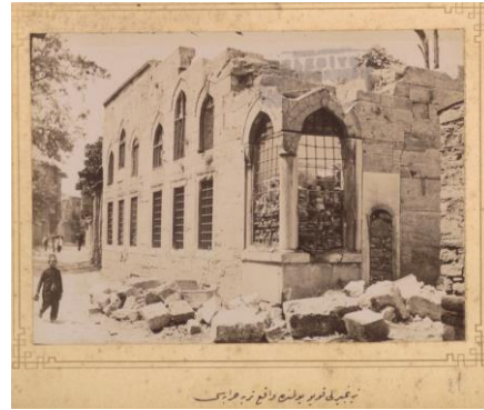
Şekil 7. Zincirlikuyu Yolu'nda Vaki Türbe Harabesi

Raporda depremde oluşan ilk sarsıntıda yeryüzünün altından gelen şiddetli gürültüler duyulduğu belirtilmiştir. Bu ilk sarsıntının hafif olduğu ancak şiddetinin giderek arttığı, ardından çok büyük bir ikinci sarsıntı meydana geldiği, bunun 8-10 saniye arasında sürdüğü ve büyük bir yıkıma neden olduğu ifade edilmiştir. Akabinde daha hafif üçüncü bir sarsıntının gerçekleştiği ve 5 saniye kadar sürdüğü belirtilmiştir. Bu üç sarsıntının toplamda 17-18 saniye civarı sürdüğü ve deprem merkezinin az bir sapma ile kuzeydoğu-güneybatı yönünde olduğu belirlenmiştir. Raporda zelzele