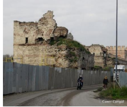
Şekil 9. Kara Surları, Ana Sur, T49 (Kültür Envanteri, 15 Ocak 2024, https://kulturenvanteri.com/yer/?p=8824. )