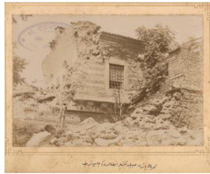
Şekil 5. Gedikpaşa'da Sıbyan Mektebi ile İttisalindeki Cami-i Şerif (İBB Atatürk Kitaplığı, no. Alb_000184-03/025)