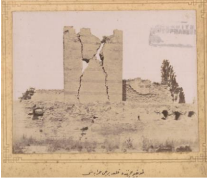
Şekil 8. Topkapı Cihetinde Kale Burcu Harabesi (İBB Atatürk Kitaplığı, no. Alb_000184-02/031)

Eğrikapı'nın üzerindeki mazgallar ile dış sağ tarafta yer alan Hacetî Hafîr Türbesi üzerindeki burç ve sağ tarafa doğru ikinci ve üçüncü burçların üst kısımları hasar almıştır. Ayvansaray Camisi'nin arkasındaki burç da hasar almıştır (Şekil 11-12.).