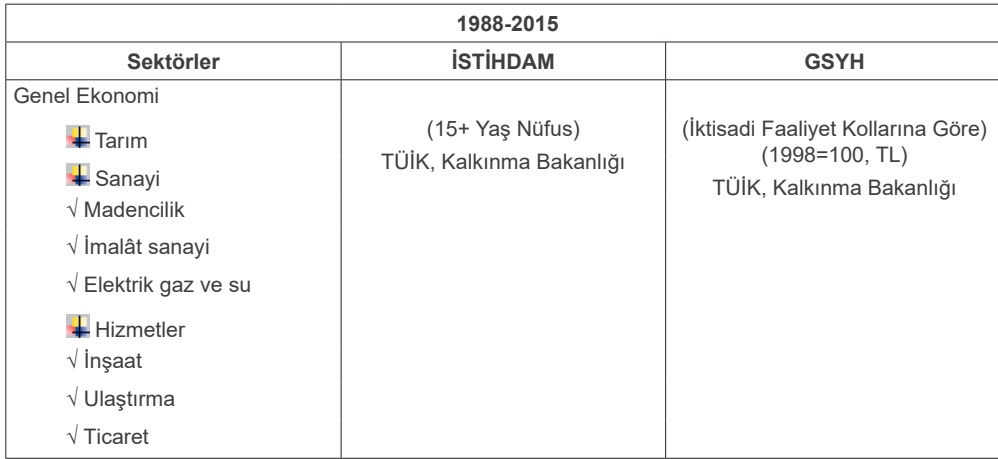
Tablo 2: Veri Seti

Çalışmada istihdam esneklikleri hem genel ekonomi; hem ana sektörler hem de alt sektörler bazında aşağıda gösterilen (1) ve (2) numaralı denklemler kapsamında EKK yöntemi ile tahmin edilmiştir. Denklemlerde reel GSYH ve istihdam serileri trenden arındırılmış olarak modellere ilave edilmiştir. Reel GSYH ve istihdam serilerine ilişkin trend değerleri Hodrick-Prescott filtresi ile elde edilmiştir (Lee, 2000; Döpke, 2001; Erdem ve Yamak, 2016).