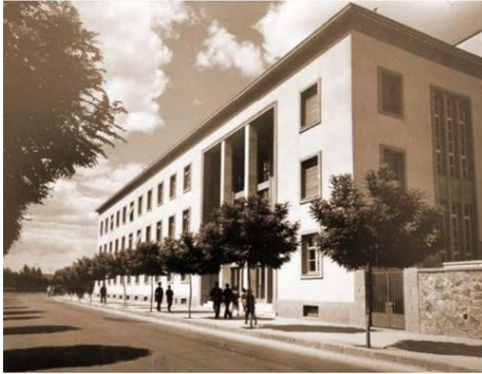
Resim 4. Ankara Radyosu