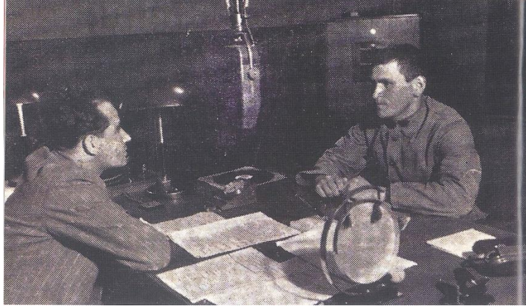
Resim 9. Arslan Mehmetçik Konuşuyor