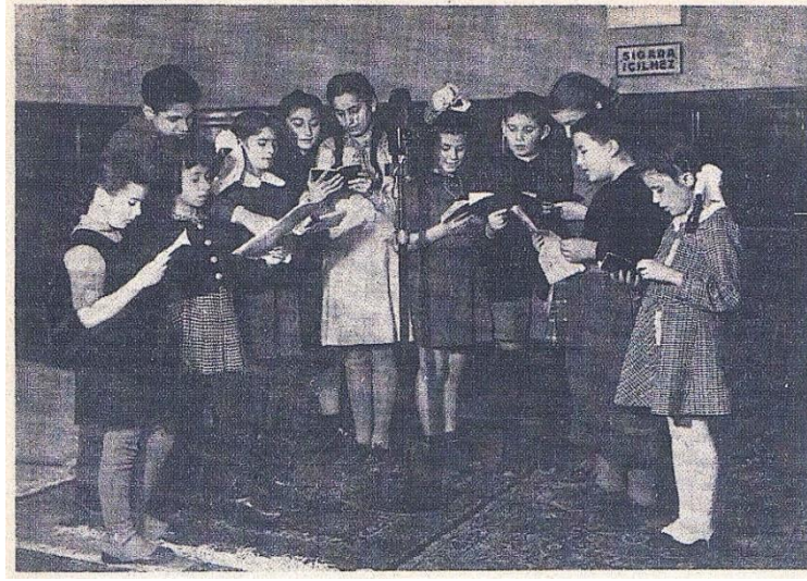
Resim 8. Türkiye Radyoları Çocuk Kulübü