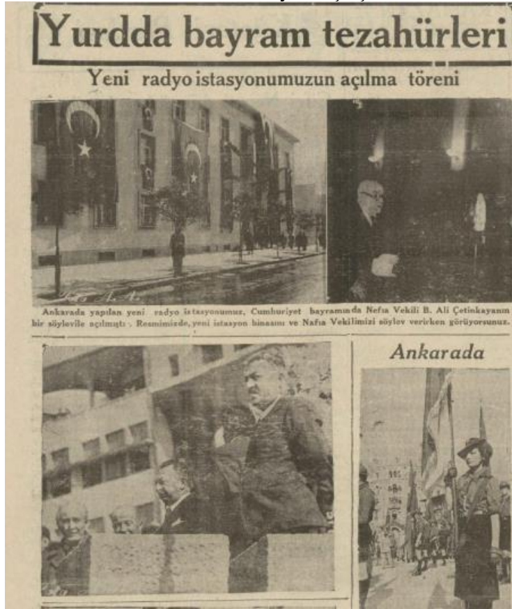
Resim 3. Ankara Radyosu açılış töreni