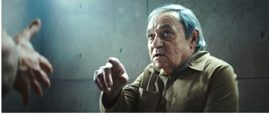
Resim 6. Sosyal mesafe