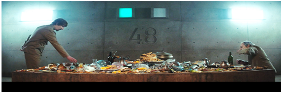
Resim 9. Sömürü