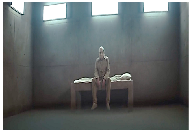
Resim 3. Otorite