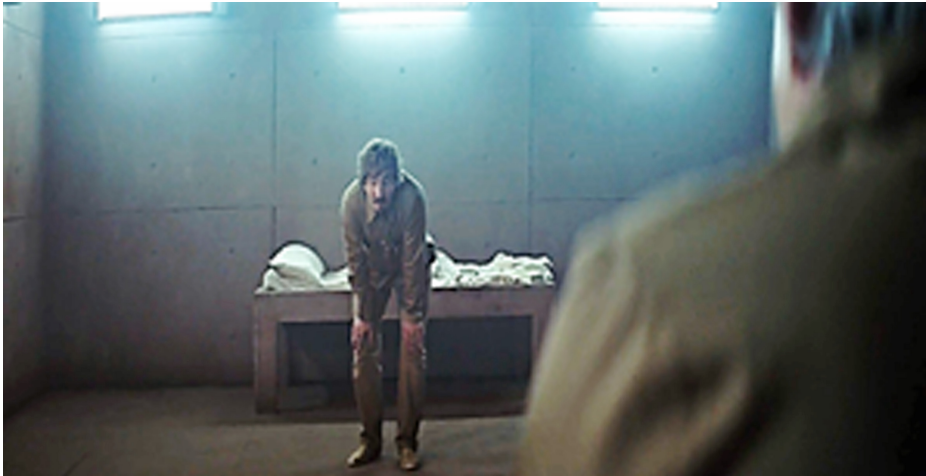
Resim 7. Sosyal Öğrenme

Tablo 8'de gösterge; insan, gıda, nesne ve sestir. Gösteren ise Goreng'in artık Trimagasi gibi yemek yemesidir. Gösterilen sosyal öğrenmedir. İnsanın yaşadığı sosyal sınıfın kurallarına uyum sağlamaktadır. Goreng'de Trimagasi gibi yemek yemeye başlamıştır. Çünkü sınıflar insanlar üzerinde belirleyicidir. Filmde de Goreng sınıfının gereğini yapar. Üst sınıflar alt sınıflara hiç bir şey bırakmak istemezler. Onun için Trimagasi ve Goreng onların üstünde kalanların kendilerine yaptığı gibi tıka basa yerler ve sofrayı dağıtırlar. Alt kata inen sofrayı "artık" gibi görünür. Platformda üst katlarda bu tıka basa yeme alt katlara gıdanın ulaşmasına engel olmakta ve alt katta yaşayanları birbirlerini öldürmeye mecbur bırakmaktadır. Dikkat edilirse Platform'da adaletsiz sistem sınıflar üzerine kuruludur. İnsanlar bütün eylemlerini gerekçelendirirler. Böylece iç sistemleri tarafından yaptıkları hatalar vicdanlarını rahatsız etmez veya daha az rahatsız ettiği söylenebilir.