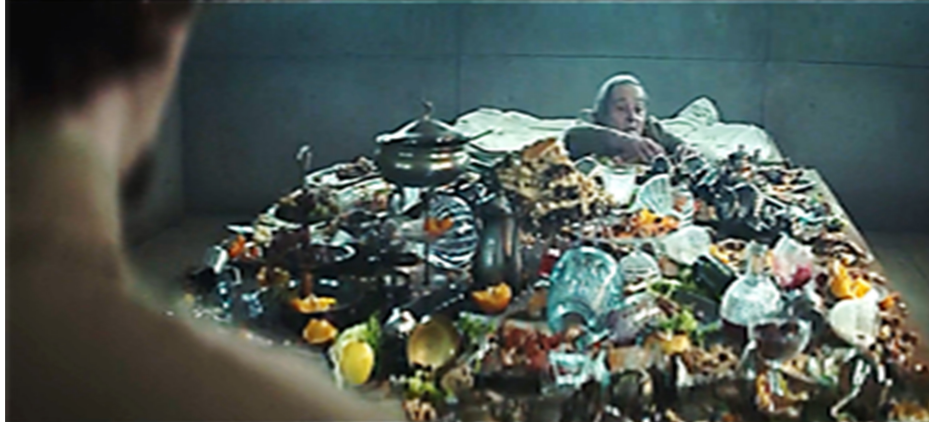
Resim 8. Platform