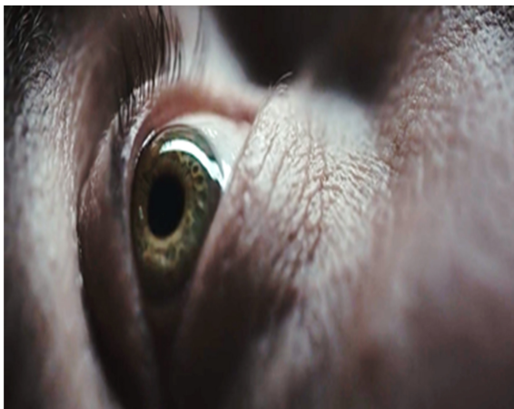
Resim 2. Göz

Tablo 3'te görüldüğü gibi Resim 4'te filmin kahramanı Goreng kaldıkları yeri keşfetmeye çalışır. Aşağıda betondan katlardan oluşmuş bir yapı ve insanlar görünmektedir. Aşağıdaki birçok katın olması toplumda yer alan sınıfsal yapıları teşkil etmekte ve insanların zihinlerindeki hiyerarşinin mekânlara da sirayet ettiğini göstermektedir. Alt katlarda koyu gri, üst katlarda parlak bir gri rengi hâkimdir. Gri rengi filmlerde melankoli, depresyon, bencillik, suskunluk, korku ve düşük enerjiyi ifade etmektedir (Kırık, 2014, s. 77). Resim 5'te de bulunan mekân tabakalar şeklinde yer almakta üst katların alt katlardan daha ferah ve aydınlık olduğu görülmektedir. Üst katlarda