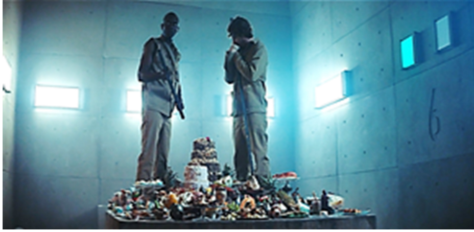
Resim 12. Sınıf Çatışması