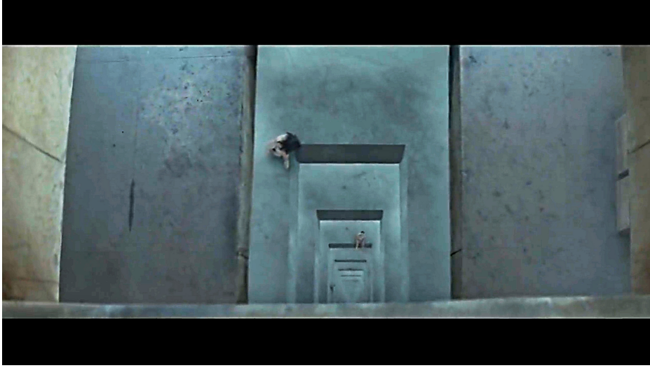
Resim 4. Alt Yapı