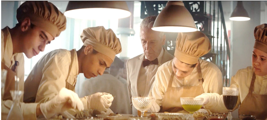
Resim 1. Mutfak Denetimi