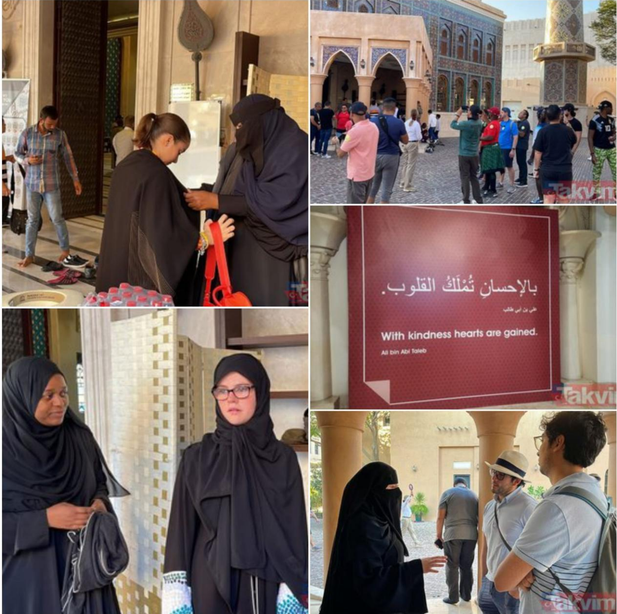
Şekil 2 2022 Dünya Kupası için Katar'ın oluşturduğu Kültür Köyü Tanıtım Camisinden yansımalar

Bu tanıtımlarda Şekil 2'de 18 görüldüğü gibi dini yaşam tarzlarına ait anlatılar bulunmaktadır. Özellikle tanıtımlarda kadınlara yer verilmiştir. Bu kadınlar Kültür Köyünü ziyaret edenlere Arap ve dini kültüre ait tanıtımlar yaparak Katar dışından gelenlere merak uyandırmıştır. Şekil 2'deki görselde olduğu gibi birçok taraftar Arap kültürüne ait ve aynı zamanda dini simge olarak kullanılan ferace ya da çarşaf adlı giysiyi denemiştir. Hatta dünyaca ünlü futbolcu Ronaldo, Arap erkeklerin giydiği entariyi giyip sosyal medya hesabında paylaşmıştır. Bütün bunlarla birlikte Hz Muhammed'e ait sözlerin İngilizce tercümesiyle verilmesi gelen taraftarların Hz Muhammed hakkında daha kapsamlı araştırmalar edindiği aktarılmıştır.