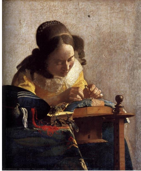
Şekil 2. Jan Vermeer, Dantelci Kadın, Tuval Üzerine Yağlıboya, 1669.

Rönesans'tan sonra karşımıza daha karanlık bir dönem olan Barok dönem çıkmaktadır. Bu dönemde din ve mezhep savaşları, kiliseyi ön plana çıkarmıştır. Barok dönemde sanat Avrupa'nın bölgelerine göre farklılık göstermiştir. Orta Avrupa'da Barok resimde figürler ve mekanlar estetik kaygı taşımaktadırlar. Bu resimlerde mitolojik ve dini hikayeler tema oluşturmaktadır. Hollanda Barokunda özellikle iç mekân resimleri karşımıza çıkmaktadır. İtalyan Barok ressam Caravaggio'nun resimlerinde de karanlık bir atmosferde iç mekân ile ilişkili figürler bulunsa da Hollanda Baroku gündelik hayattan sıradan insanların kentsel mekanla ilişkisini doğrudan yansıtmaktadır. Hollanda Barokunun farklı olmasının sebebi Hollanda kentsoylu kesimin Protestan olmasıdır. Avrupa'nın kentleri din savaşları halindeyken sanatçılar kiliselerden ve Katolik yöneticilerden sipariş almıştır fakat Hollandalı ressamlar bu konuda daha özgür olmuşlar ve gündelik hayatı doğrudan resmetmişlerdir (Gombrich, 2004, s.415). Barok dönemde mezhep savaşları ve baskılar toplumdaki bireyleri ev içi yaşama itmiştir. Özellikle bu dönemde kadının hayatı tamamen evin içi olmuştur. Hollandalı Barok ressam Jan Vermeer ev içinde kadınların yaşantısını tüm gerçekliği ile resmetmiştir. Vermeer için resimde kentsel ve sosyal ayrışmanın ilk örneklerini verdiğini belirtebiliriz. Vermeer'in kadınları kent mekânından soyut güvenli bir alan olan evinde bulunmaktadır.