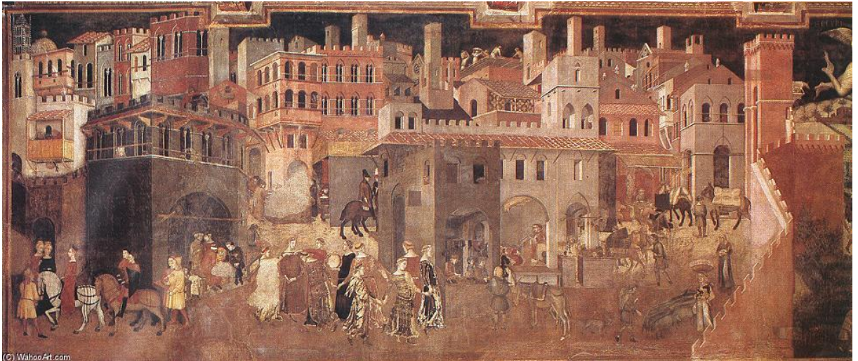
Şekil 1. Ambrogio Lorenzetti, İyi Yönetimin Sonuçları, Fresk, 1337-40.

Resim sanatında sanatçının kentsel mekân deneyimi ilk olarak Rönesans ile başlamıştır. Eserlerde mimari perspektifin kullanılması mekanlarda derinlik ve 3 boyutluluk hissi yaratmış bunun sonucunda da figür ile mekân birbirini tamamlar hale gelmiştir. Ortaçağ resimlerinde mekan ve mimari, skolastik düşünceyi desteklemek için bir araç iken Rönesans resminde figür ile mekan ilişkisi başlı başına bir konu oluşturmuştur. Buna örnek olarak Erken Dönem Rönesans ustalarının resimleri karşımıza çıkmaktadır. Ambrogio Lorenzetti'nin "İyi Yönetimin Sonuçları" adlı eserinde ressam Siena şehrinde yaşayan mutlu insanları resmetmiştir. Resimdeki binalarda perspektif ve derinlik de verilmeye çalışılmıştır. Binalar önünde mutlu kent sakinleri, şehirde refah içinde tasvir edilmiştir (Krausse, 2005, s.8).