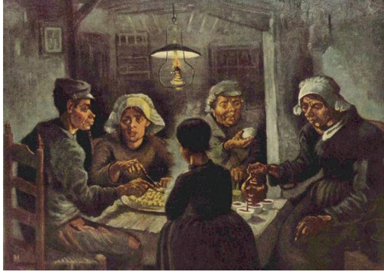
Şekil 5. Vincent Van Gogh, Patates Yiyenler, Tuval Üzerine Yağlıboya, 1885.

20.Yüzyıl büyük değişimlerin ve savaşların çağı olarak tarihte yerini almıştır. 20. Yüzyılın ilk yarısında meydana gelen I. Dünya Savaşı kentlerde büyük bir yıkım yaratmıştır (1914-1918). Bu dönemde Avrupa'da ortaya çıkan huzursuzluk ortamı sanatçıları da oldukça etkilemiştir. Alman Dışavurumcuları I. Dünya Savaşı'nın en çok etkilediği Berlin'de doğmuştur. Berlin bu dönemde Avrupa'nın sanayi metropolü haline gelmiştir. Fakat Berlin'de karşımıza ciddi bir sosyal bozulma karşımıza da çıkmaktadır. Savaşta ölenlere duyarsız, sadece hazzı bir yaklaşım süren üst kesimi Alman Dışavurumcu ressamlar eleştirmiştir. Dışavurumcu ressamlar şehirdeki sosyal ve mekânsal ayrışmayı da bize sunmuşlardır. Örneğin Ernest Ludwig Kirchner'in eserlerinde toplumun üst kesiminin yaşantısını ve bulunduğu mekanları çarpıcı ve eleştirel bir biçimde bulabiliriz. Bu dönem ressamlarının figürlerindeki çirkinlik, kentteki burjuvaların kayıtsızlık ve bencilliğine karşı bir eleştiri olmuştur (Eco, 2009, s.368).