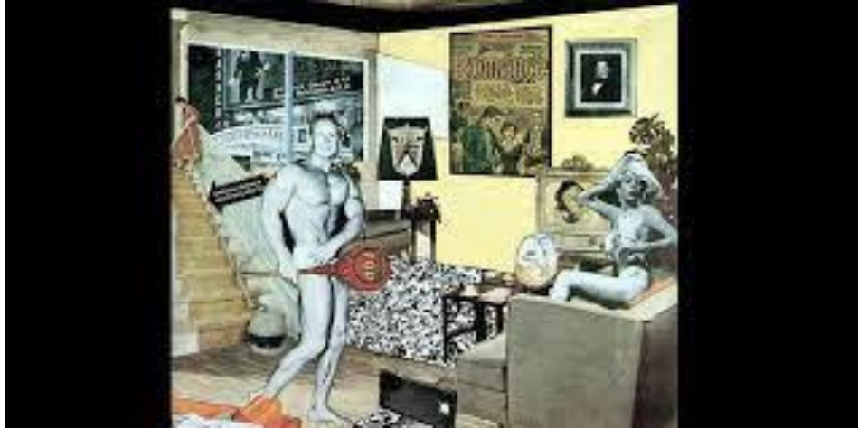
Şekil 7. Richard Hamilton, Bugünün Evlerini Bu Denli Farklı, Bu Denli Cazip Kılan Nedir?, Kolaj, 1956.

21. Yüzyıla geldiğimizde ise 20. Yüzyıl'a göre daha yoğun bir tüketim kültürü karşımıza çıkmaktadır. 21. Yüzyılın kentleri de yoğun tüketimden kültüründen etkilenmiş ve anonimleşmiştir. Kapitalist toplum yapısı ve küreselleşme ile mekanlar adeta tek tipleşmiştir. Sosyolog Marc Auge bu dönemin kentlerini tanımlayan "Non- Place (Yok-yerler)" kavramını öne sürmüştür. Bu kavramda birey ile mekân ilişki kurmamaktadır, mekanlar gerekli fiziki imkanlara sahip olmasına rağmen bireye aitlik hissi vermemektedirler (Auge, 2016, s.18). Yok-yerlere örnek olarak günümüz hipermarketlerini, otoyollarını ve kısa süreli kullanım mekanlarını örnek verebiliriz. Küresel firmaların mekânsal aynılıkla dizayn ettiği kafe, otel gibi mekanlar da yok yer statüsündedir. Bu yerlerde sosyal ve mekânsal ayrışmanın ayrışma sorunsalının yerini 21. Yüzyılın temel problemi olan "iletişimsizlik" almıştır. 21. Yüzyıla kadar kentlerde bireyler mekanla ilişki kurmuş, bu ilişki kimi zaman sosyal ve