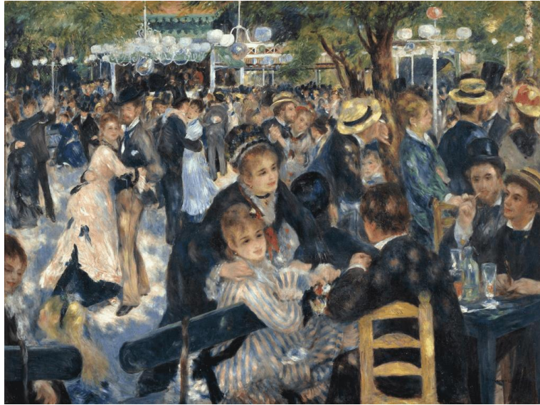
Şekil 4. Pierre Auguste Renoir, Moulin de la Galette’de Dans, Tuval Üzerine Yağlıboya, 1876.

19. yüzyıl toplum ve kent yapısının değişiminin çağı olarak karşımıza çıkmaktadır. 19. Yüzyıl kentleri zorlayıcı, planlı ve katı bir biçimde özelliğe sahip olmuştur (Öztürk, 2014, s.71). Demiryolu ulaşım sisteminin kurulması ile sanayi ağı daha da genişlemiştir. Fakat artan sanayi ve iş gücü temposu bireye mutluluk yerine derin bir buhran getirmiştir. Bu dönemde alkol bağımlılığı, intihar, ruhsal problemler fazlasıyla karşımıza çıkmaktadır (Freyer, 2014, s.70-71). 19. Yüzyılın ortası ve sonunda sadece toplumun ağır iş yapan kısmında değil sanatçı ve düşünürlerde de bu buhranın izlerine rastlamaktayız. Fransa’da Geç-İzlenimci (post-empresyonist) ressamlar Henri de Toulouse Lautrec, Vincent Van Gogh resimlerinde dönem insanın sosyal ve mekânsal krizlerini çarpıcı bir şekilde resmetmişlerdir.