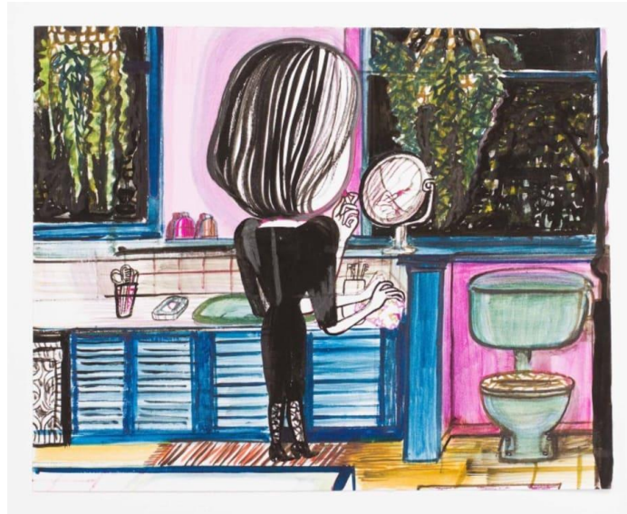
Şekil 8. Emma Talbot, Banyo, Kağıt Üzerine Guaj Boya, 2011.