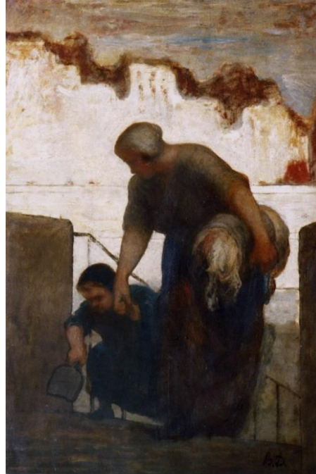
Şekil 3. Honore Daumier, Çamaşırçı Kadın, Ahşap Üzerine Yağlıboya, 1863

Kentlerde sosyal ve mekânsal ayrışmanın resim sanatına etkisinin en net örneğini 18. Yüzyılda meydana gelen Sanayi Devrimi ile görmekteyiz. Sanayi Devrimi her alan gibi sanatta da bir dönüm noktası olmuştur. Sanayi dönemi öncesi kentler 18. Yüzyılda hızlı bir değişime uğramışlardır. Finansal kazanç uğruna köyler, bahçeler, eski binalar adeta büyüyen kente kurban edilmiştir (Mumford, 2013, s. 503). Kapitalizm insan ve mekân ilişkisini yıkıcı bir şekilde güç ve para üzerinden temellendirmiştir. Sanayi devrimine kadar pek çok savaş ve hastalık olsa da aile yapısı veya kent planları 18. Yüzyıl gibi radikal bir şekilde değişmemiştir. Kenar mahalle veya bütün ailenin tek bir kiralık odada yaşaması kavramı Sanayi Devrimi ile karşımıza çıkmaktadır. Tarım temelli eski toplumların yerini içerisinde insan yığınları barındıran büyük metropoller almaya başlamıştır. Bu metropoller farklı sosyal statüde bulunan insanların yaşayışına göre şekillenmiştir. Şehre, sanayi alanlarında çalışmak için gelen insanların yaşayışı dönemin ressamalarını etkilemiş ve Realizm akımı doğmuştur. Artık karşımıza romantik doğa ve insan unsurları yerine yeni yaşamın acımasız gerçekliği sunulmaktadır. Sanayi Devrimi'ndeki büyük kent yaşantısını adeta bir belge niteliğinde sunan; Honore Daumier, Adolph Menzer, Gustave Courbet gibi realist ressamalar resimlerini gerçek hayatı gözlemleyerek yapmışlardır (Farthing, 2012, s.301).