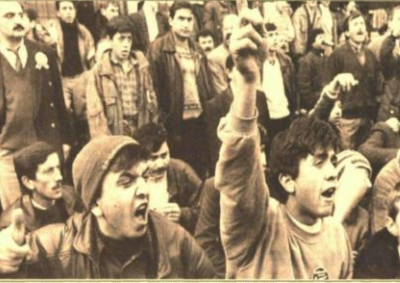
Karabük'te, fabrika kapama kararına karşı 8 Kasım'da miting düzenlendi.

► Çelişkili Sendeika Genel Başkanı hükümetin ve DYP yönetiminin Karabük kapama kararına ilişkin olarak, işçi Karabük'te söze güvenmiyor, uygulama bekliyor.