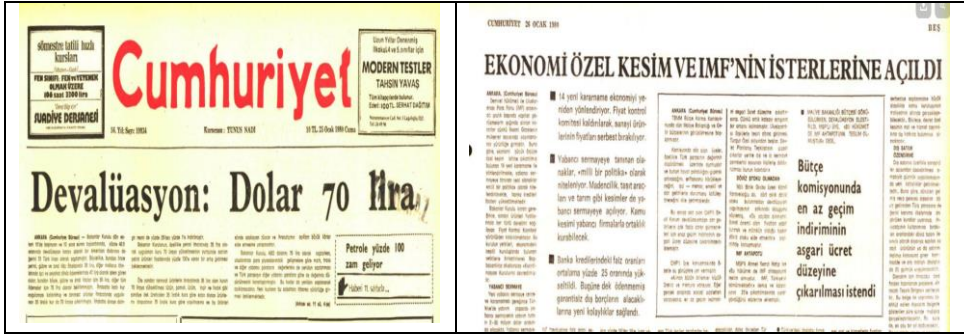
Kaynak: Cumhuriyet, Dijital Arşiv, 25-26 Ocak 1980

eylemler yapmıştır. Eylemler iş yavaşlatma, işi geç başlatma, toplu vizite, servis ve yemek boykotu, sakal boykotu, sessiz yürüyüş, iş bırakma, oturma, yolu trafiğe kapatma, toplu boşanma başvurusu gibi birçok eylemi içermiştir. Çelik, aynı çalışmasında 1989 Mart ayında başlayan eylemlerin 12 Eylül 1980'den sonra “büyük bir sessizliğe gömülen işçi hareketinin yeniden dirilişinin simgesi” olduğuna vurgu yapmaktadır. Eylemlerin sürdüğü dönemde 22 Mart 1989'da 24.000 işçinin katılacağı açıklanan İskenderun ve Karabük Demir Çelik grevleri de dönemin Özal hükümeti tarafından ertelenmişti. Bahar Eylemleri aynı zamanda dönemin neo-liberal politikaların bir sonucu olarak ortaya çıkmıştı. Güvenç (2019:28) bu ilişkiyi kurarken “sermaye sınıfının sınırsız egemenliğini hayata geçirmek için ülkemizde başlattığı saldırılar” şeklinde tanımladığı dönemde Bahar Eylemleri'nin önemli bir dönemeç olduğunu ancak 1989 sonrasında “ikinci büyük sermaye saldırısı”nın devam ettiğine dikkat çekmiştir. Bahse konu bu dalga, Türkiye’de 24 Ocak 1980 tarihinde yürürlüğe giren kararla IMF'nin ve Dünya Bankası'nın “yapısal uyum politikalar” olarak tanımladığı neo-liberal müdahalelere (Boratav, 2015) atfı yapmaktadır.