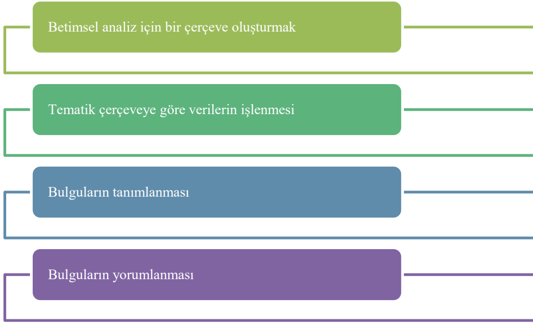
Şekil 1: Veri Analizi Aşamaları

1. Betimsel analiz için bir çerçeve oluşturmak: İlk aşamada, belirlenmiş bir kavramsal çerçeve kapsamında verilerin hangi temalar altında düzenleneceği ve sunulacağı tespit edilir (Yıldırım & Şimşek, 2021). Duyarlık konusu bu araştırmanın çerçevesi olarak belirlenmiştir. Daha sonra da bu çerçeveye göre Etoğlu Kibris (2019)'in, Karakuş Tayşi (2019)'nin, Alamdar ve Süngü (2017)'nün, Aslan (2013, 2016)'nın çalışmalarında kullanılan duyarlık kategorilerinden yararlanılarak duyarlık kategori formu hazırlanmıştır.