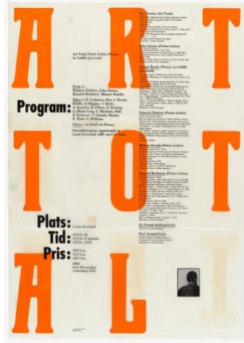
Resim 7 Fluxus Poster, Art Total, Lund, İsveç, 10-12 Mart 1967, Ben Vautier, harf ton kabartmalı tipo baskı, Modern Sanat Müzesi, New York, Gilbert&Lila Silverman Fluxus Koleksiyon Hediyesi, 2008.

kullanarak üretilmiştir. Farklı materyallerle tasarımı zenginleştirmenin mümkün olduğu bilinmektedir. Deneysel malzeme kullanımları bulunmaktadır. Sayfa düzeni açısından ise satır ve metin yazıları ile tamamlanmıştır. Makineleşme ve bunun getirdiği üretimdeki hatasız çıkışlar yerine burada her bir kişi için farklılık gösterecek el yazısı kullanılmıştır. Öyle ki bu el yazısı farklı zamanlarda yazacak aynı kişi bile olsa farklı sonuçlar doğuracaktır.