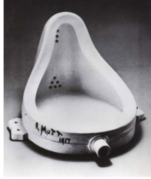
Resim 1 Marcel Duchamp'ın Çeşmesi, 1917