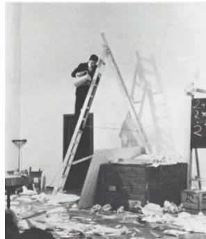
Resim 2 George Maciunas, George Brecht'in “Drip Music” adlı eserini seslendiriyor, Düsseldorf, 1963 (kat. 66). (Maciunas, 1988: 30).