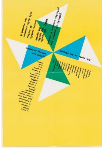
Resim 5 Fluxus Konseri, Art Totale, Torino, İtalya, 26-28 Nisan 1967, tasarımcısı bilinmiyor, ofset litografi baskı, Modern Sanat Müzesi, New York, Gilbert&Lila Silverman Fluxus Koleksiyon Hediyesi, 2008.

görülmeştir. Sayfada düzen ortalanmıştır. Ana başlıklarda ve öne çıkarılan yazılarda büyük harf (manjiskül) tipografi tercih edilmiştir. Büyük harfler ve punto büyüklüğüyle Fluxus yazısı ilk göze çarparken tırnaksız bir font daha metinde kullanılmıştır. Organizasyona katılan sanatçıların isimleri liste olarak verilmiştir. Tasarımda hiçbir görsel öğeye yer verilmemesi dikkat çekicidir.