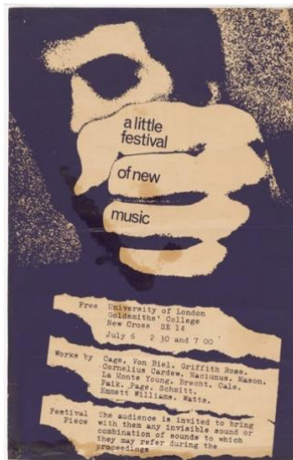
Resim 8 Küçük Bir Yeni Müzik Festivali Poster, Goldsmith's Collage, Londra, 6 Temmuz 1964, tasarımcı bilinmiyor, serigraf, Modern Sanat Müzesi, New York, Gilbert&Lila Silverman Fluxus Koleksiyon Hediyesi, 2008.

İsveç'te gerçekleştirilen Fluxus organizasyonunda 1967 yılında Vautier tasarımı çalışmada siyah beyaza, turuncu tek bir renk kullanılmıştır (Resim 7). Görsel öge olarak çerçevesiz küçük bir arkası dönük fotoğraf kullanılmış, sayıdaki görselliği turuncu tırnaklı harfler oluşturmaktadır. Afiş içeriğinde blok şeklinde program bilgileri sütun olarak bulunmaktadır. Sayfa tasarımı (layout design) bakıldığında sütun ızgara sistemi olarak düzenlenmiştir. Parlak turuncu majiskül harflerin üzerine gelen paragraf yazılar, renkli harflerin birer görsel öge gibi algılanmasına sebep olmaktadır. Turuncu harfler afişin bütününde bir kelime oluştursa da aynı zamanda bir görsel öge işlevi de görmektedir.