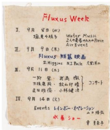
Resim 6 Fluxus Haftası Poster, Tokyo, Japonya, 8, 9, 11, 14 Eylül 1965 Kuniharu Akiyama, Kumaş üzerine mürekkep, Modern Sanat Müzesi, New York, Gilbert&Lila Silverman Fluxus Koleksiyon Hediyesi, 2008. Kaynak: https://post.moma.org/festum-fluxorum-posters-of-fluxus-festivals/

1967 yılında İtalya, Torino'da düzenlenen Fluxus konser programı için tasarlanan afişi üreten tasarımcı bilinmiyor (Resim 5). Sıcak renklerden sarı ve yeşilin hakim olduğu tasarımda geometrik şekillerden bir rüzgar gülü formu oluşmaktadır. Sıcak renklere soğuk bir renk olarak turkuaz eşlik etmektedir. Dikdörtgen tasarımda figür sayfa düzeninin dörtte üçünde yer almaktadır. Tipografi ise rüzgar gülü formuna uygun olarak tasarımda yer almaktadır. Tırnaklı küçük harf tipografi seçimi ile organizasyon ilgili bilgiler görülmektedir. Tasarımda görsel öğe kullanılmıştır. Bunun yerine tipografi ve geometrik şekillerin sayfa üzerinde bir form oluşturması sağlanmış, görsel çarpıcılığı ise sıcak renk seçimi göstermektedir.