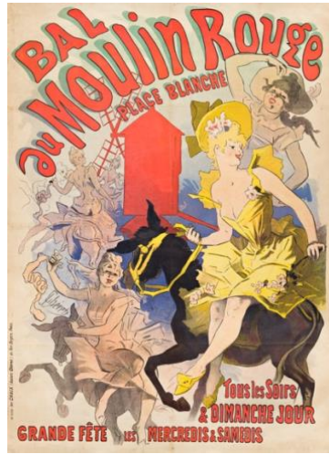
Resim 3 Cheret'in Kabare Afiş Tasarımı Kaynak: https://catalogue.swanngalleries.com/Lots/auction-lot/JULES-CH%C3%89RET-%281836-1932%29--BAL-AU-MOULIN-ROUGE-1889-48x35-inc?saleno=2558&lotNo=34&refNo=776765