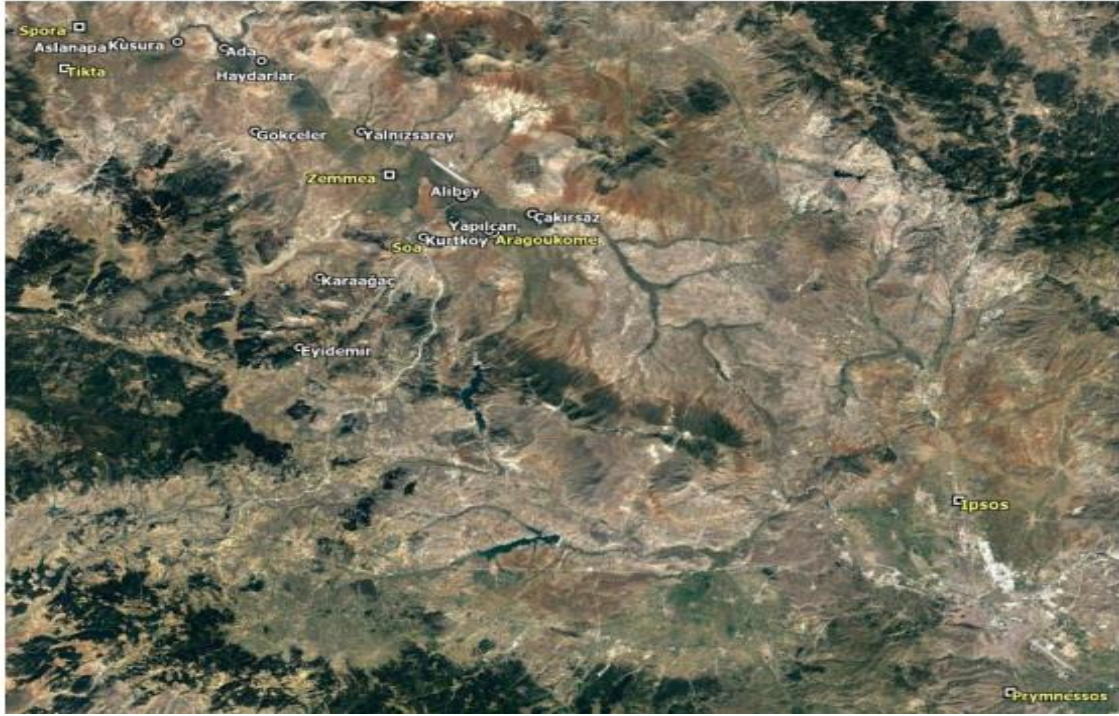
Resim 2: Altıntaş Civarındaki İmparatora Ait Araziler ve Mermer Ocakları (Takmer, 2018: 430).