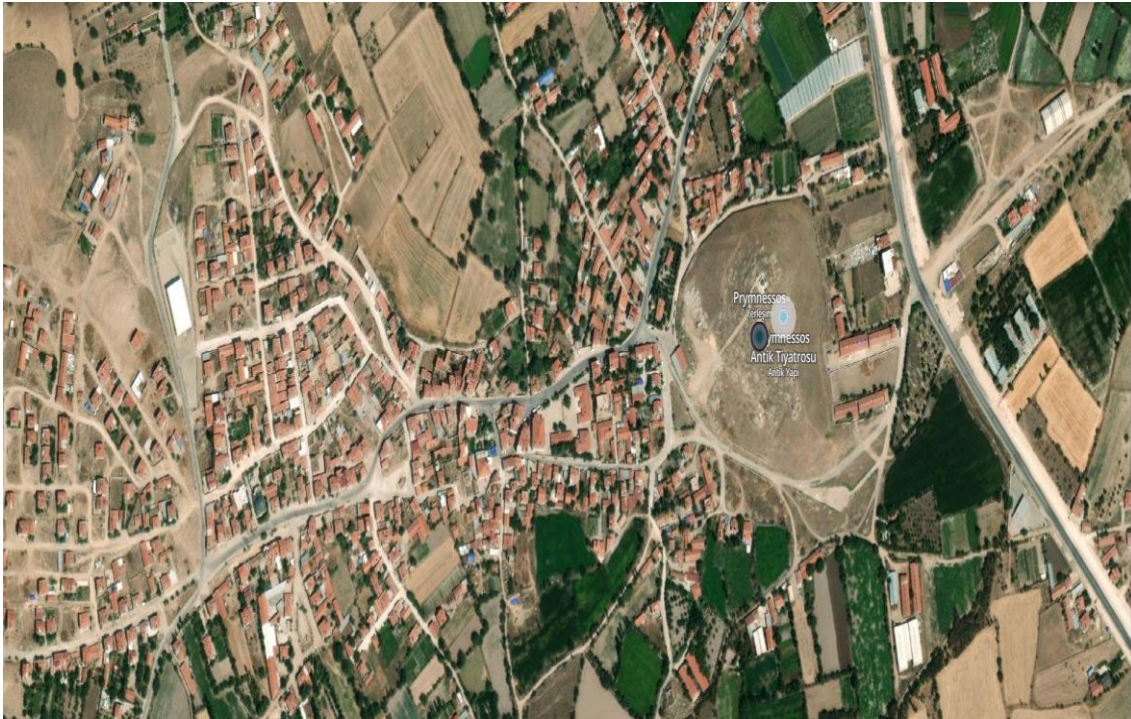
Resim 1: Prymnessos yerleşim alanı (Afyonkarahisar/Sülün) ( https://kulturenvanteri.com/yer/?p=2086 ).

görevlendirilen valiler tarafından yönetilmiştir. Afyonkarahisar'da, Roma İmparatorluk Dönemi'nde önemli yerleşim yerleri oluşturulmuş; fakat henüz yerleri belirlenememiş yerleşim yerleri yer almaktadır 6 . Afyonkarahisar'da bilinen yerleşim yerlerinden biri Prymnessos (Sülün) antik yerleşim alanıdır (Resim 1). Prymnessos yerleşimi Afyonkarahisar'ın merkez Sülün köyünde bulunmaktadır 7 . Bu yerleşim yeri Roma Dönemi'nde Kaystros Nehri 8 çevresinde bölgeye hakim bir konumdadır 9 . Prymnessos, Roma'ya bölgeden taşınmakta olan mermer yolu üzerinde de olduğundan (Resim 2) dolayı burada önemli heykeltıraşlık atölyesi ya da atölyeleri olabilir 10 . Bu yerleşim yerinde Nike heykeli dışında mermer Eros Trapezophoros (Masa Ayağı), Kral Midas, Demeter ve Herakles (Herkül) heykelleri bulunmuş olup, müzede sergilenmektedir 11 .