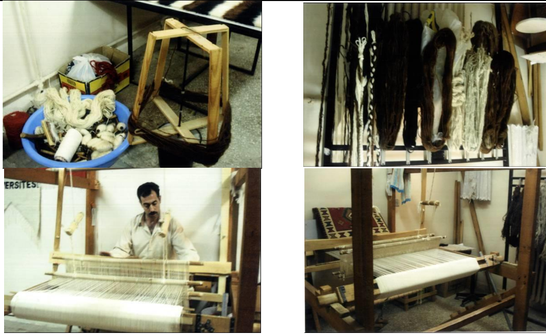
Resim 1. Tiftik ipinin boyanması ve işlenmesi süreci (F. Ayhan arşivi) (a) İpliğin bükünü, b) Kurutulması c) Tezgaha alınması d) İşlenmesi (Figure 1. Painting and processing process of mohair (a) Twisting your yarn, b) Drying, c) Countertop retrieval, d) Processing)