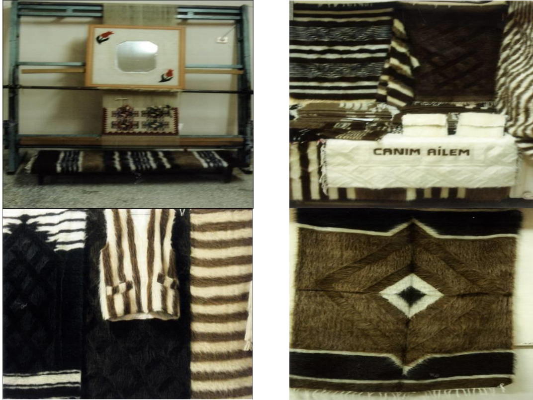
Resim 2. Tiftik keçisi ürünleri ev ve giysi örnekleri (Figure 2. Mohair products household and clothing samples)