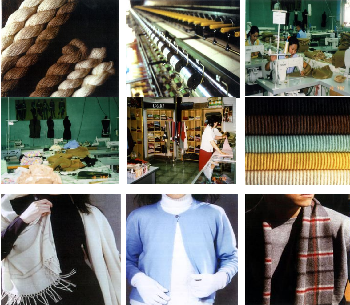
Resim 5. Tiftik ipliğinden ürüne dönüşüm örnekleri (Moğolistan Ulaanbator Gobi Fab.)

(Figure 4. Orhun village of Mongolia and surrounding mohair farm)