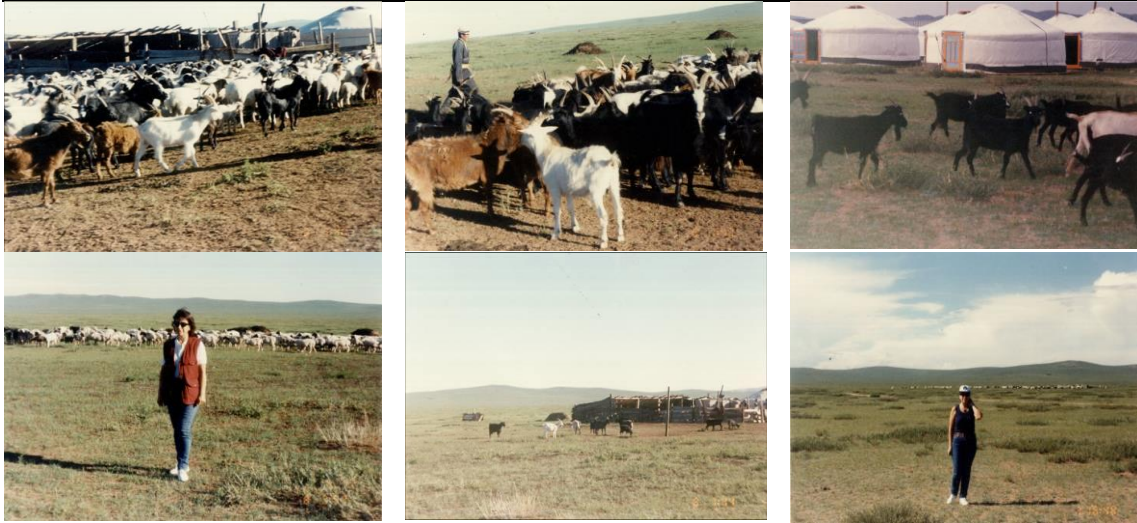
Resim 4. Moğolistan Orhun Köyü ve çevresi Tiftik keçisi çiftlikleri

(Figure 4. Orhun village of Mongolia and surrounding mohair farm)