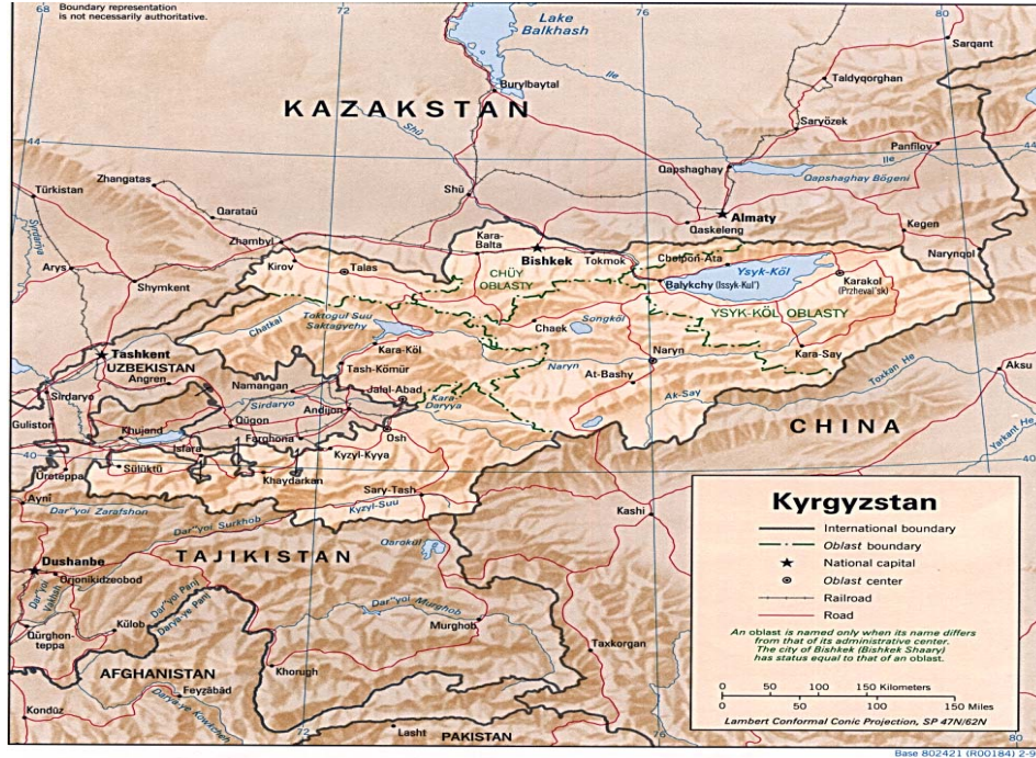
Şekil:2. Genel Kırgızistan Fiziki Haritası ( http://www.orsam.org.tr/tr/haritaGaleri.aspx?HaritaID=4 indirilme tarihi:01.07.2010)