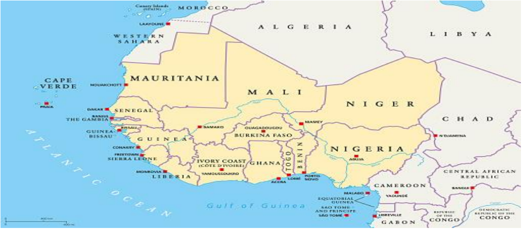
Harita 2: Batı Afrika'nın günümüzdeki siyasi haritası (Istok, t.y.).

Bilâdü's-Sudan veya Kara Afrika üç ana bölgeye ayrılmıştır: