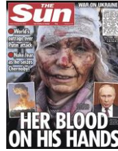
Şekil 3: The Sun Gazetesinin 25 Şubat 2022 Tarihli Sayısının Baş Sayfası

Kaynak: BBC (2022b). "Rusya'nın Ukrayna'yı işgali İngiltere basınında", https://www.bbc.com/turkce/haberler-dunya-60518831 [Erişim: 25 Nisan 2022].