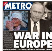
Şekil 5: Metro Gazetesinin 25 Şubat 2022 Tarihli Sayısının Baş Sayfası