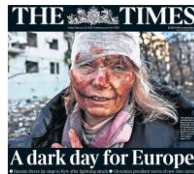
Şekil 2: The Times Gazetesinin 25 Şubat 2022 Tarihli Sayısının Baş Sayfası

Kaynak: BBC (2022b). "Rusya'nın Ukrayna'yı işgali İngiltere basınında", https://www.bbc.com/turkce/haberler-dunya-60518831 [Erişim: 25 Nisan 2022].