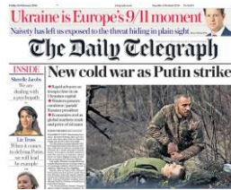
Şekil 4: The Daily Telegraph Gazetesinin 25 Şubat 2022 Tarihli Sayısının Baş Sayfası

Kaynak: BBC (2022b). "Rusya'nın Ukrayna'yı işgali İngiltere basınında", https://www.bbc.com/turkce/haberler-dunya-60518831 [Erişim: 25 Nisan 2022].