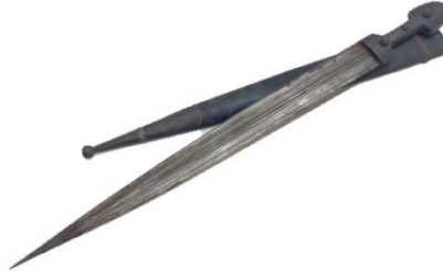
Şekil 11; Karakulak, Çerkez Kaması

Giresun ve Trabzon yörelerinde görülen horon türü bu dans, bir mücadele, kavga özelliđi taşır. Erkekler tarafından iki kişiyle ve karşılıklı biçimde sergilenir. Davul zurna veya kemençe eşliğinde müzikli olarak icra edilen bu dansa “Karakulak” denilen uzun bir bıçak ya da “Çerkez kaması” kullanılır (Köse, 2001;136). (Bkz, Şekil 11).