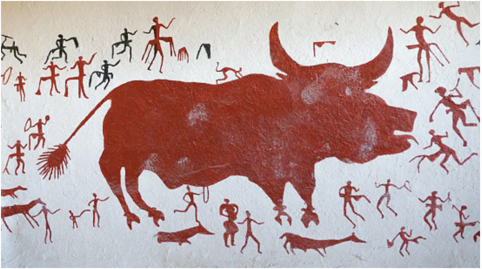
Şekil 1; Avcıların Dansı.

Anadolu'da dans ile ilgili ilk kanıtlar Konya ovasında yer alan Çatalhöyük'te görülür. Burada yapılan kazılar sonucunda ortaya çıkarılan MÖ 5800'lü yıllara ait olan "Kutsal Ev" adlı yapının duvarında "Avcıların Dansı" adlı kompozisyona ulaşılmıştır (Bkz, Şekil 1). Bu kompozisyonda elinde tef ve farklı nesnelere ile akrobatik hareketler yapan figürlere rastlanmaktadır (Zenbilci ve Çetin, 2018: 267).