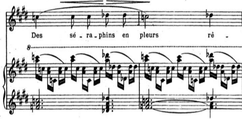
Şekil 2. Claude Debussy'nin "Apparition" Chanson'u (4.ve 5.ölçü).

Şekil 1'deki Chanson'un girişinde bulunan "rêveusement" ifadesi "hülyalı" anlamına gelmektedir, bu nedenle şarkıcı cümleye nefesi kesintisiz üfleyerek, düz, abartısız vibrato ile piano (hafif) şekilde giriş yapmalıdır.