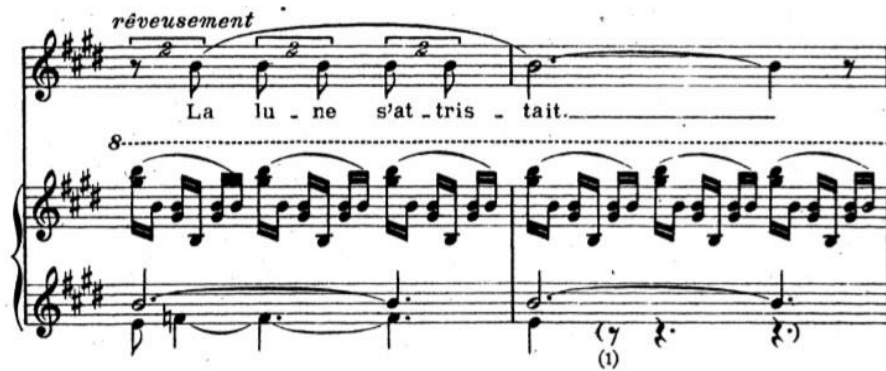
Şekil 1. Claude Debussy'nin “Apparition” Chanson'u 5 (2. ve 3. ölçü).

Mehtap üzülüyordu. Melekler gözyaşları içinde hayaller kurarak, Beyaz hıçkırıklar süzülürken mavi başlarından, Parmaklarının arasındaki keman yayıyla, Buğulu çiçeklerin sakinliği arasında, hüzünlü ezgiler çalıyorlardı. Gün, ilk öpücüğünün kutsal günüydü. Bana acı çektirmekten zevk alan hayal gücüm, Hüznün kokusundan, bilgece sarhoş oluyordu. Hatta pişmanlık duymadan, ne de üzüntü, Bir hayalin dalından koparılmasını, onu koparanın kalbine bırakıyor. Ben ise öylece geziniyordum, Gözlerim eskimiş kaldırım taşlarına takılı. Bana görüldüğün zaman güneş saçlarındayken sokakta, Ve gece, gülümserken bana, Ve gün ağarırken, Bir zamanlar mutlu çocukluğumun güzel rüyalarının üstünden geçen, Ve her zaman yarı kapalı avuçlarından kar taneleri gibi, Mis kokulu yıldızların beyaz buketlerini bırakan peri kızını gördüğümü sandım. 4