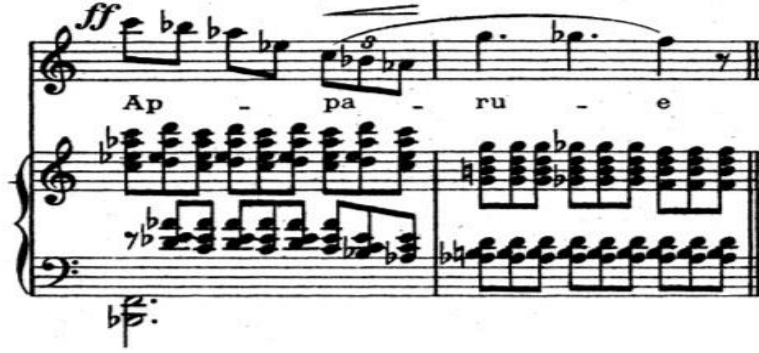
Şekil 9. Claude Debussy'nin "Apparition" Chanson'u (39. ve 40. ölçü)

Şekil 8, 37. ölçüdeki tiz La bemol notasındaki "e" sesi yukarıdaki örneklerdeki gibi yine geniş formda olması, şarkıcının notayı daha rahat çıkarabilmesini sağlamaktadır. Devamındaki 38. ölçüdeki "-ru" hecesi "ü" sesini vermekte olup (Nitze, & Wilkins, 1913, s. 10) "ö" gibi telaffuz edilmesi gerekmektedir çünkü aynı kelime ve hece devamında daha da tiz bir notada tekrar gelecektir ve telaffuz bakımından eşit olmalıdır.