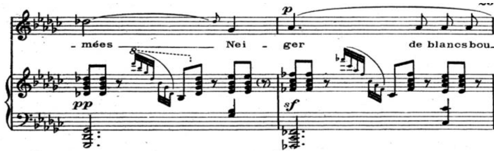
Şekil 15. Claude Debussy "Apparition" Chanson'u. (50. ve 51. ölçüler).

Şan partisinde aynı fikrin tekrar geldiği ve eserin enerjisinin zirveye ulaştığı noktaya kuvveti, şancının ifadesiyle birlikte, piyano partisindeki tekrarlı akorlar taşımaktadır. Oldukça geniş bir klavye alanının kullanıldığı sağ el, sol el yazısında oktav aralıkları, bas seslerdeki akorlar ve dört sesli akorlarla çok yoğun ve kuvvetli bir ses hacmi yaratmaktadır. Bu büyük hareketlerde piyano partisindeki teknik ve melodik ilerleyişte solo piyano eserine eşdeğer bir yazı vardır, bu sebeple şancının ifadesi ve melodik çizgisi titizlikle takip edilmelidir.