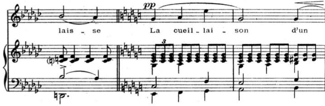
Şekil 13. Claude Debussy, "Apparition" Chanson'u. (24-26. ölçüler).

ince ayrıntısına kadar net ve eksiksiz belirtilir. Tüm piyanoyu, enstrümanın yapabileceklerini ve klavyeyi kapsamaktadır. ‘fff’den ‘ppp’ya kadar, staccato’dan portamento’ya ve Legato’ya kadar tüm tınıyı bir kombinasyon halinde kullanmaktadır. Bütün pedalların tek tek ve birlikte incelikli kullanımları armonik geçişlerin ve bir tablodaki gibi kullandığı müzikal renklerin yansıtılması için gereklidir” (Schmitz, 1950, s. 35). Bu eserde de besteci, gençlik döneminde olmasına rağmen müzikal ve teknik anlamdaki bütün özelliklerini bu eserde göstermiştir. Piyano eşliği partisindeki tüm teknik zorlukları hiçe sayarak sadece tını ve duyuşa yönelen müzikte akıp giden melodiyi takip edebilmek, icra eden piyanist için derin bir anlayış ve teknik hakimiyet gerektirir.