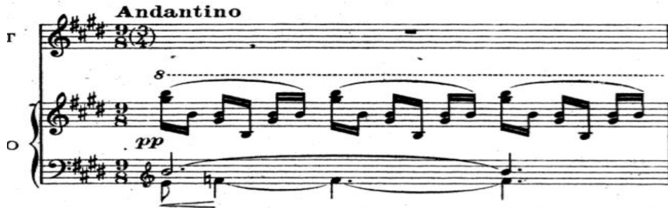
Şekil 12. Claude Debussy'nin "Apparition" Chanson'u (1. ölçü).

Claude Debussy'nin Apparition isimli Chanson'unun piyano partiyonu Empresyonist dönemin bütün özelliklerini içeren bir özet gibidir. Eser başlarken piyano eşliğinde sağ elde yer alan uçucu ve pianissimo motiflerle rüya gibi bir etki yaratmaktadır. Tül gibi ince bir ifade ile giriş yapılarak, şan partisi için hayali ve gizemli bir ortam hazırlanmıştır. Bunu sağlayan, Mi Majör tonundaki eserin sağ elde yer alan ve oldukça ince notalardan, oktavlar arası atlayarak geçip giden motiftir.