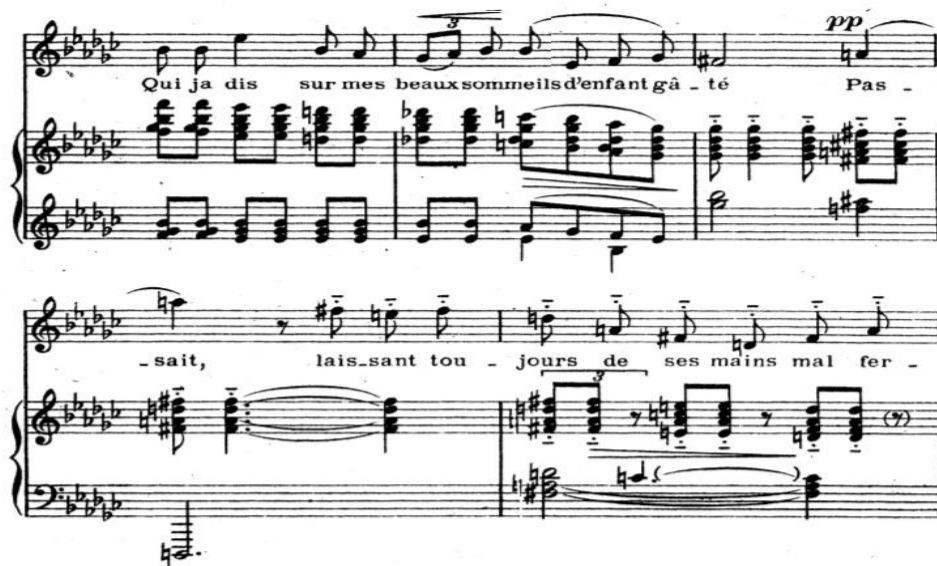
Şekil 10. Claude Debussy'nin "Apparition" Chanson'u (45-49. ölçüler).

Şekil 8, 38. ölçüden sonra pozisyonu ve nefes desteğini bırakmadan 39. ölçüye bağlamak bu Chanson'un en zor cümlelerinden biri sayılabilir. Teknik ve ifade zorluğu, şarkıcının deneyimini ve teknik açıdan yeterliğini göstermesi açısından bu cümle oldukça önemlidir. Yukarıda bahsedildiği gibi Şekil 9 40. ölçüde daha tiz notalarda tekrar gelen "-ru" hecesi 38. ölçüdeki gibi "ö" olarak telaffuz edilmesi uygun gelebilir.