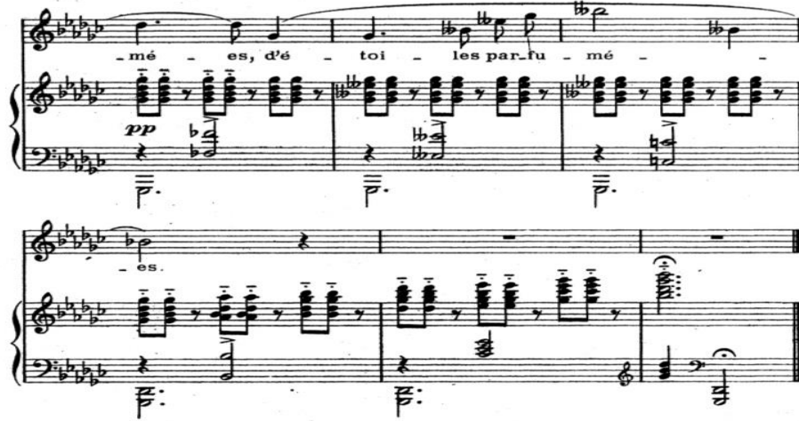
Şekil 11. Claude Debussy'nin “Apparition” Chanson'u (54-59. ölçüler).

Şekil 10, 47.ölçüdeki La naturel notası, 48. ölçüde “e” sesinde bir oktav daha tizde sürdürülmektedir. Şarkıcı buradaki “e” sesini “a” sesine daha yakın bir formda telaffuz etmelidir çünkü hem notanın tiz olması hem de nüans olarak pianissimo (daha hafif) bunu gerektirmektedir.