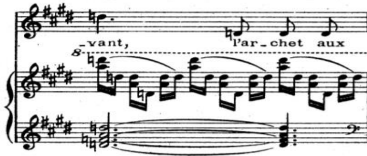
Şekil 3. Claude Debussy'nin "Apparition" Chanson'u (6.ölçü).

Şekil 2'de her ne kadar cümle bağı "De séraphins en pleurs" cümlesinde yer alsa da, anlam ve müzik cümlesi açısından, devamında gelen "révant (Şekil 3, 6. ölçü) den sonraki virgülden nefes almak, legato (bağ) açısından daha uygundur.