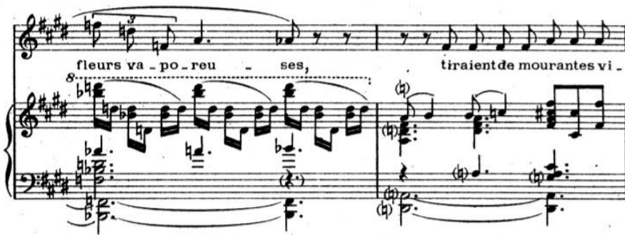
Şekil 4. Claude Debussy'nin "Apparition" Chanson'u (8. ve 9.ölçü).