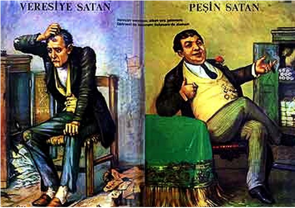
Şekil 2. Veresiye satan, peşin satan