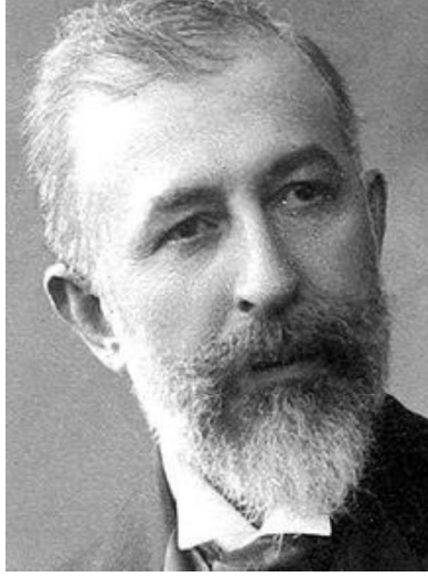
Resim 3: Halit Ziya (Uşaklıgil)

Halit Ziya'nın Servet-i Fünûn döneminde yazdığı Mai ve Siyah romanı adeta bu devrin bir beyannâmesi gibidir.