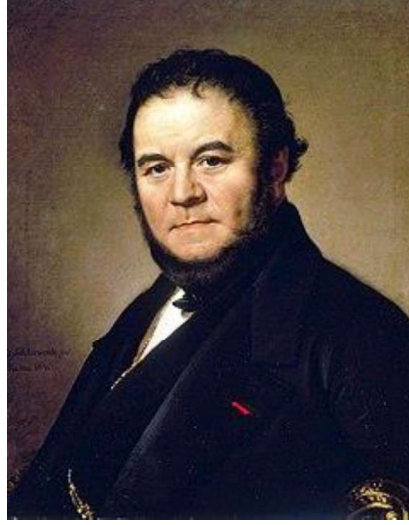
Resim: 1 Stedhal

Kırmızı ve Siyah ( Le Rouge et le Noir ) ın, 1830 tarihinde ilk baskısı yapılır, Türkçeye Kızıl ile Kara adıyla da çevrilmiştir.