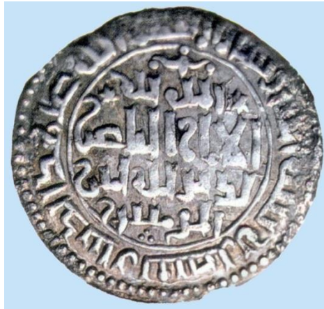
Ek 2: I.Gıyaseddin Keyhüsrev adına bastırılan sikke.