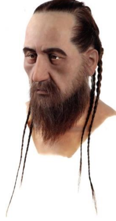
Birinci Gıyaseddin Keyhüsrev (vefat: 1211).

Foto :I Gerçek kafatası üzerine etlendirme yöntemiyle yapılan I.Gıyaseddin Keyhüsrev büstü.