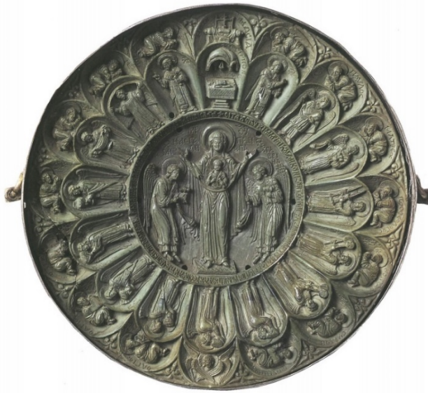
Fotoğraf 14. Panagiarion/Pulcheria Pateni (Treasures of Mount Athos, 1997, s.325)

dörtgen şeklinde patenlerin varlığı da bilinmektedir (Acara, 1998, s.192). Günümüzde Athos Dağı, Xeropotamou Manastırı'nda yer alan Panagiarion/ Pulcheria Pateni araştırmacılar tarafından 13.-14. yüzyıla tarihlendirilmektedir (Wulff, 1924, s.616; Treasures of Mount Athos, 1997, s.324-325; Negrău, 2018, s.90). Paten etrafı oymalı metal bir levha ile bağlanmış ve yuvarlak, ayaklı bir kaideye tutturulmuştur. İlk şeridin en tepesinde ortada Hetoimasia (Boş Taht), boş tahtın iki yanında iki melek ve meleklerin yanında secde eden, altışardan toplam on iki havari yer almaktadır. İkinci şeritte Hetoimasia'nın hemen altında kiborium ve altar, altların iki yanında Ökaristi Ayini'ni yöneten ve iki kere betimlenen İsa ve kemer içinde ayakta tasvir edilen on üç melek bulunmaktadır. Patenin merkezinde ortada Meryem ve çocuk İsa, Başmelek Gabriel ve Başmelek Mikhael tasvir edilmiştir (Fotoğraf 14). Patene Pulcheria Pateni denilmesinin sebebi ise metal levhanın dış kısmında " Pulcheria Augusta'nın Kırk Şehitler'in saygıdeğer sürüsüne armağanı " yazıtının yer almasıdır (Fotoğraf 15). Tüm bu bilgiler kapsamında 13.14. yüzyıla tarihlenen patenin içine oturduğu metal levhanın Pulcheria döneminde yapılmış olabileceğini, sonraki bir dönemde de yeniden kullanılmış olabileceğini söylemek yanlış olmayacaktır.