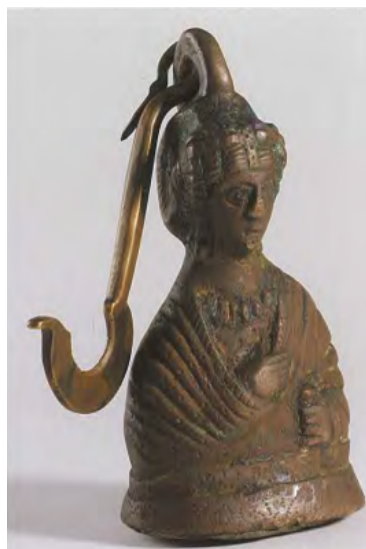
Fotoğraf 19. Kantar Topuzu, Aelia Eudoxia, Antalya Kaleiçi Müzesi (Acara-Eser, 2013, s.47)

Büst şeklindeki kantar topuzları MS 2. yüzyıl ila 7. yüzyıl arasına tarihlendirilmektedir. Erken Hıristiyanlık dönemi kantar topuzlarının büyük bir çoğunluğunun imparator ya da Yunan Tanrıçaları şeklinde biçimlendiği görülürken, 5. yüzyıl sonlarına doğru imparatoriçe büstü şeklinde biçimlendiği görülmektedir (Acara-Eser, 2003, s.47). Araştırma kapsamında incelenen Walter Sanat Galerisi'ndeki kantar topuzu stil ve süsleme özellikleriyle Antalya Kaleiçi Müzesi'ndeki 5. yüzyıla tarihlenen İmparatoriçe Aelia Eudoksia büstü şeklinde biçimlendirilen (Fotoğraf 19) (Acara-Eser, 2003, s.47), İstanbul Arkeoloji Müzesi'ndeki 5. ve 6. yüzyıla tarihlendirilen Aelia Eudokia, Galla Placidia, Licinia Eudoksia gibi imparatoriçe büstü şeklinde biçimlendirilen (Meriçboyu ve Atasoy 1983, s.8-9), İzmir ve Konya Arkeoloji Müzelerindeki 5. yüzyıla tarihlendirilen imparatoriçe büstü şeklinde biçimlendirilen kantar topuzlarına benzemektedir (Acara, 1990, Kat. No. 55 ve 67, Res. 51 ve 56). İmparatoriçe Pulcheria'ya ait sikkeler ve Almanya'daki fildişi panel incelendiğinde kantar topuzundaki figürle benzerlikler görülmektedir. Bu bağlamda Ross'un iddialarına, Pulcheria'nın İmparatorluktaki gücü de göz önüne alındığında katılmak mümkündür.