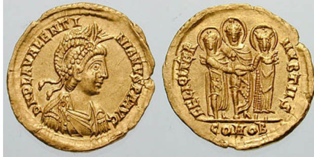
Fotoğraf 18. Licinia Eudoksia ve III. Valentinianus'us Evlilik Solidusu 18

kutsamasının örnekleri olarak karşımıza çıkmaktadır. Bu sikkelerin ön yüzlerinde imparatorun askeri kıyafetli bir tasviri sikkenin arka yüzünde ise İsa, imparator ve eşinin ayakta tasviri bulunmaktadır. İsa burada Hıristiyanlanmış imparatorluk kültürü ya da dindarlığı göstermek amacıyla özel sembolik sebepten dolayı sikke üzerinde yer almaktadır (Demirel-Gökalp, 2009, s.35).