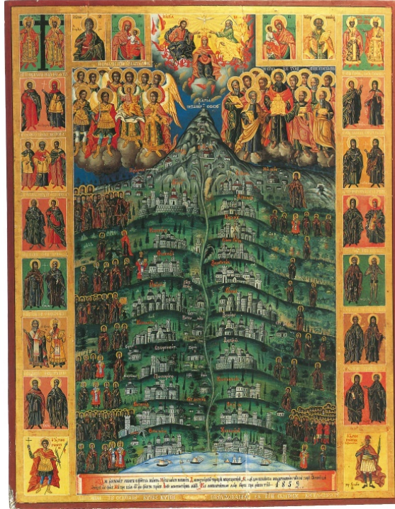
Fotoğraf 20. Athos Dağı: Meryem, İsa, Manastırlar, Kurucular, Havariler, Başmelekler, Rahipler, Aziz ve Azizeler (Treasures of Mount Athos, 1997, s.197)

Sonuç olarak Bizans İmparatorluğu'na iz bırakan kadınların belki de başında gelen Pulcheria'nın, 15 yaşında taht naibi olarak İmparatoriçe olmasından 54 yaşında ölümüne kadar hem devlet işlerinde hem de dini siyasette önemli bir rol oynadığı ardında bıraktığı eserlerde görülmektedir. İmparatorluk sikkelerindeki ikonografik değişim Pulcheria'nın yönetimde ne denli güçlü olduğunun bir kanıtıdır. Bununla birlikte Pulcheria'nın izleri sadece yaşadığı dönemle sınırlı kalmayıp daha sonraki dönemlerdeki eserlerde de karşımıza çıkmaktadır. Örneğin 1859 tarihli Athos Dağı'nın genel görünüşünün tasvir edildiği ikonada II. Theodosios ve Pulcheria da betimlenmiştir (Fotoğraf 20). Bu belki de kendini dine ve devlete adayan bir imparatoriçeye duyulan sevgi ve saygının sadece kendi döneminde değil yüzyıllar sonra bile devam ettiğinin kanıtıdır.