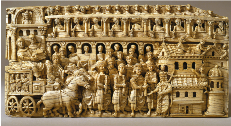
Fotoğraf 1. Fildişi Panel, Almanya, Trier Katedrali Hazinesi (Holum, 1982, s.106-Figure 15)

Sahnenin solunda at arabası içinde ellerinde kutsal kalıntıların bulunduğu rölikeri tutan iki din adamı bulunmaktadır. Arabanın hemen önünde ellerinde mum taşıyan geçit alayının en önünde başındaki taçtan anlaşıldığı üzere II. Theodosios tasvir edilmiştir. Sahnenin sağında çatısında işçiler bulunan ve hala tamamlanmadığı anlaşılan kilise ve önünde de bir eliyle gelenleri selamlayan diğer elinde de uzun bir haç tutan Pulcheria yer almaktadır. Sahnenin solunda arka planda nişin içinde İsa, sağında ise sarayın pencerelerinden olaya tanıklık eden figürler tasvir edilmiştir.