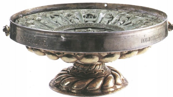
Fotoğraf 15. Panagiarion/Pulcheria Pateni (Treasures of Mount Athos, 1997, s.324)