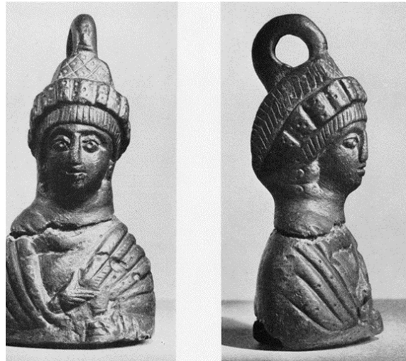
Fotoğraf 13. Kantar Topuzu, İmparatoriçe Pulcheria(?), Walter Sanat Galerisi (Ross, 1946, PLATE XXIX)

Bizans Döneminde tartı aleti olarak kantar ve terazi birlikte kullanılmıştır. Kantarlarda küre, büst veya heykelcik biçimli ağırlıklar tercih edilmiştir (Acara-Eser, 2005, s.51). Büst şeklindeki ağırlıklarda imparator, imparatoriçe, tanrı ve tanrıça gibi figürlerin kullanılması satıcılar için doğruluğu ve dürüstlüğü, alıcılar içinse güvenilirliği simgelemektedir (Meriçboyu ve Atasoy 1983, s.6-12). Günümüzde Walter Sanat Galerisi'nde bulunan bronz bir kantar topuzu Ross tarafından Pulcheria'ya atfedilmektedir (1946, s.368-369) (Fotoğraf 13). Ross imparatoriçenin sikkelerinden ve Delbrueck'in çalışmalarından yola çıkarak Walter Sanat Galerisi'ndeki kantar topuzunun İmparatoriçe Pulcheria olabileceğini öne sürmektedir (Ross, 1946, s.369; Delbrueck, 1933, pl.23).