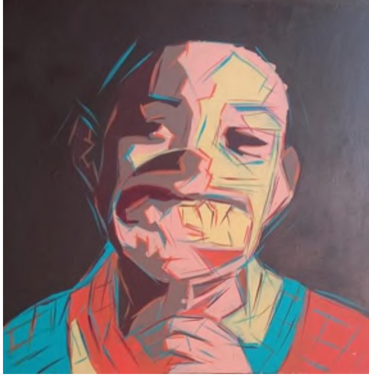
Şekil 2. Güneş Kalan, “Mercek - 2”, Tuval Üzerine Akrilik Boya, 80*80, 2014

Mercek ile kendi türümün yüz ifadelerine derinlemesine ve ayrıntılarıyla bakma arzum, onları gösterdiklerinden veya benim gördüğümünden ya da algıladığımdan daha derine bakma ve onların daha görünür olma ya da duygularına daha yakından bakma arzusundan kaynaklanmaktadır. Mercek uzaklaştıkça yüzler flulaşmaktadır, oysa yakınlaştıkça detaylar ortaya çıkmaktadır. Bizler yüzlere uzaktan bakarsak uzaklığımız ölçüsüne bağlı olarak gördüğümüz şeyler bizim için flu, tanımak, görmek için yakınına gelirse o şeylerin gerçekliği artmakta ve anlamaya değer olmaktadır. Üstelik mercek, isminin aksine yakınlaştırdığı şeyin yalnızca parçasını detaylandırabildiği için belki de bir bakıma gösterdiği şeyi küçültmektedir. Vücut dilinin yüz, jest ve mimikler olmadan yetersiz kalışı gibi, doğada var olan her şeyde onlara zihinsel ya da bedensel olarak ne derece yakınsak o kadar fazla nesne olarak algımızda anlam kazanmaktadır. İnsanlık, tarih boyunca anlam aramak ve nesnelere anlam yüklemek üzerine varlığını sürdürmektedir. Varlık ve yokluk, özdeki mana, temel gerçeklik ve neden-nasıllık arayışı insanlığın yaşamdaki anlam arayışından kaynaklanmaktadır. Bu manada çalışmalarım da bu anlam arayışının varoluşsal bir parçasıdır. Araştırmacının eserlerinde görülen narsisizmin izleri büyüteç nesnesinin ön planda yer almasına dayanarak gülümsemeye odaklıdır. Çalışmalarımındaki gülümseme edimi tıpkı Kristeva'nın da söylediği gibi çirkinlik ve iğrençlik edimini de beraberinde getirmektedir.