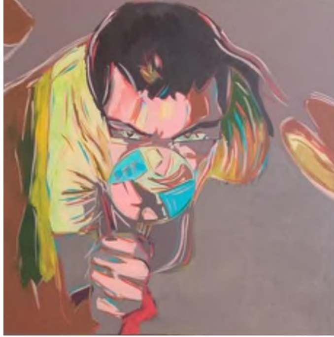
Şekil 1. Güneş Kalan, “Mercek - 1”, Tuval Üzerine Akrilik Boya, 80*80, 2014