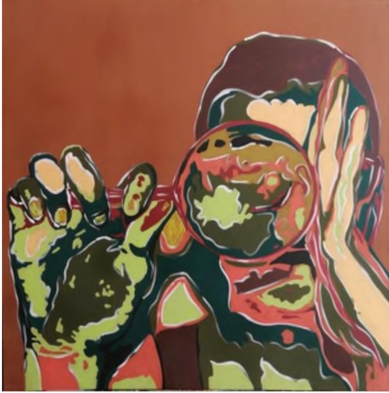
Şekil 5. Güneş Kalan, "Mercek - 5". Tuval Üzerine Akrilik Boya, 80*80, 2019