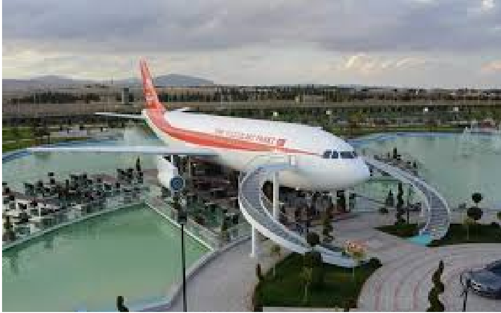
Fotoğraf 4: Türk Yıldızları Parkındaki Uçak Restaurant'ın görünümü.

akrobasi timi Türk Yıldızları tarafından daha önce kullanılan ve ömrünü tamamlamış 2 tane F-5 jet uçağı konulmuştur. Parka gelenler bu Havacılık müzelerini görme imkanına sahiptir