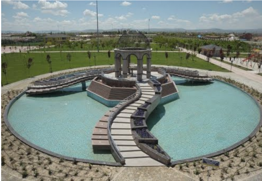
Fotoğraf 2: Hadimi Karaaslan Parkı içinde yer alan Kitabeli havuz.

Konya şehri içerisinde halka en çok boş zaman etkinliği sağlayan parkların başında geliyor. Karaaslan Hadimi Parkı, Yayla Pınar Mahallesi'nde yer alıyor. 128 bin m 2 yeşil alan ve Türkiye'de ilk kez 15 bin m 2 'lik meyve bahçesi yer alıyor. Parka gelenlere meyve toplama imkânı sunuluyor. Engellilerinde kullanımına uygun yapılan Karaaslan Hadimi Parkı'nda piknik alanlarının yanı sıra; 7 bin m 2 'lik gölet ve havuz grupları, atlı binicilik tesisi, kapalı oturma alanları, lunapark, çocuk oyun grupları, basketbol sahaları, tenis kortu ve sergi alanları yer alıyor 3 . Peki parkın ismi nereden geliyor? Konya değerlerine, örflerine ve atalarına sahip çıkan ve her yeni bir yapıda onları kalıcı kılma adına tarihsel ve önemli şahsiyetlerini kalıcı kılma adına isimlerini bu yeni yapılarda yaşatmayı seven bir kent. Asıl adı Ebu Said Muhammed Hadimi olan Konya'nın önemli alimlerinden olan Hz. Hadimi, İslam Hukuku, İslam Ahlakı ve sosyal konular üzerinde birçok eseri vardır. Konya tarihsel kimliğini vurgulama adına önem verdiği bu şahsiyetle özdeşleşmiş ve parkla da gelecek olan nesillere bu şahsiyeti merak duygusu üzerinden araştırmaya sevk etmiştir. Park iç tesisinde ise Kitabeli havuz vardır. Bu havuz Hz. Hadim'inin türbesinden esinlenerek tasarlanmıştır. Kubbeli olan kitabeli havuzda Hadimi ile ilgili bilgiler yer almaktadır.