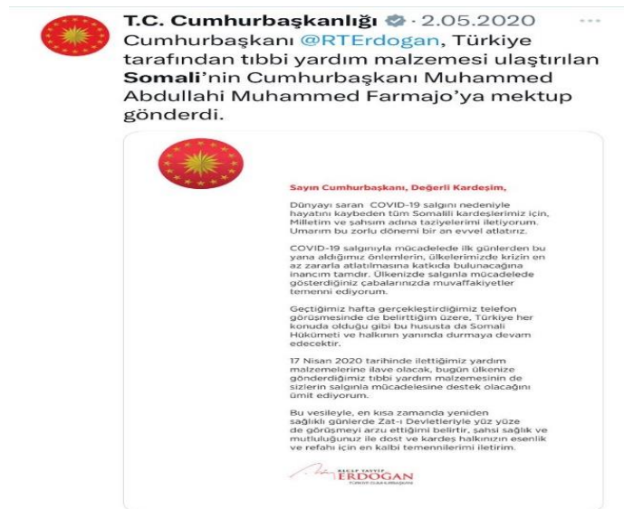
Fotoğraf 11. T.C. Cumhurbaşkanlığı Twitter Paylaşımı (Twitter, "T.C. Cumhurbaşkanlığı" (Çevrimiçi), https://twitter.com/tcbestepe/status/1256608027320487942?s=46&t=141fTdsHJL7HEyJGoyRS1Q adresinden 20.03.2023 tarihinde erişilmiştir.)

Aziz Milletim, senin kalbinde merhamet adlı bir çınar vardır!”