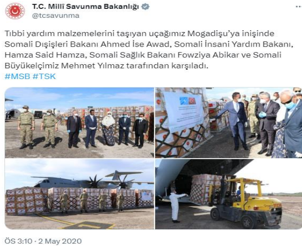
Fotoğraf 12. T.C. Milli Savunma Bakanlığı Twitter Paylaşımı (Twitter, “T.C. Milli Savunma Bakanlığı”, (Çevrimiçi),

T.C. Cumhurbaşkanı Recep Tayyip Erdoğan'ın yardımlar sonrası Somali Cumhurbaşkanı Muhammed Abdullah Farmajo'ya göndermiş olduğu mektup, T.C. Cumhurbaşkanlığı Twitter hesabında da paylaşılmıştır.