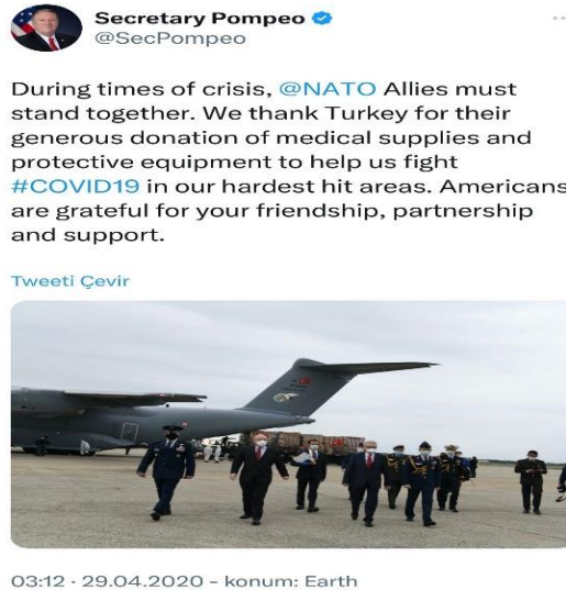
Fotoğraf 2. Secretary Pompeo Twitter Paylaşımı (Twitter, “Secretary Pompeo”, (Çevrimiçi),

Türkiye bu yardım ve desteklerin yanı sıra, Kovid-19 karantina yasakları sebebiyle ülkemizde bulunan ve ülkelerine dönüş yapamayan üçüncü ülke vatandaşlarının tahliyesine de yardımcı olmuş ve ülkelerine dönüşlerini sağlamıştır. Yapılan bu yardımlar neticesinde, yardımların gönderildiği ülkelerin yetkilileri gerek sosyal medyada gerekse uluslararası medyada paylaşımlarda bulunarak teşekkür etmişlerdir. Böylelikle kriz anını etkin kullanarak hem bilgi akışını sağlamış hem de hedef kitleden olumlu geri bildirim almıştır.