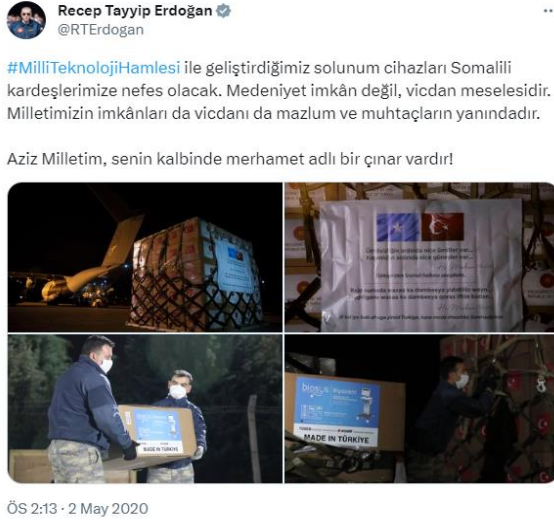
Fotoğraf 10. Recep Tayyip Erdoğan Twitter Paylaşımı (Twitter, "Recep Tayyip Erdoğan", (Çevrimiçi), https://twitter.com/RTErdogan/status/1256542343106301953 adresinden 10.06.2023 tarihinde erişilmiştir.)

Bu görüşmeler neticesinde T.C. Cumhurbaşkanı Sayın Recep Tayyip Erdoğan'ın talimatları doğrultusunda 2 Mayıs 2020 tarihinde de Somali'ye yardım desteği devam etmiştir. 20.000 adet tanı kiti, 40.000 adet cerrahi maske, 10.000 adet N95 maske, 20.000 adet koruyucu tulum ve 10 adet solunum cihazı ve aksesuarları Mogadişu'ya ulaştırılmıştır.