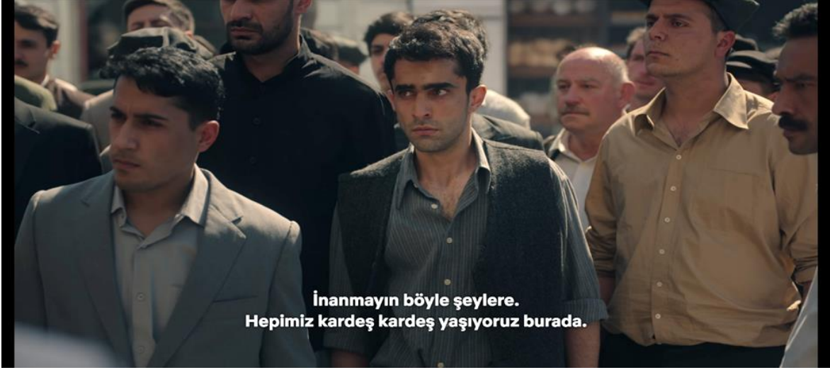
Görsel 12: Yahudi Esnaf ve Ahali Arasında Geçen Diyalog

İnanmayın böyle şeylere. Hepimiz kardeş kardeş yaşıyoruz burada.