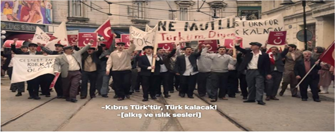
Görsel 11: İstiklal Caddesi'nde Yürüyüş Yapan Ahali

-Kıbrıs Türk'tür, Türk kalacak! -[alkış ve ıslık sesleri]