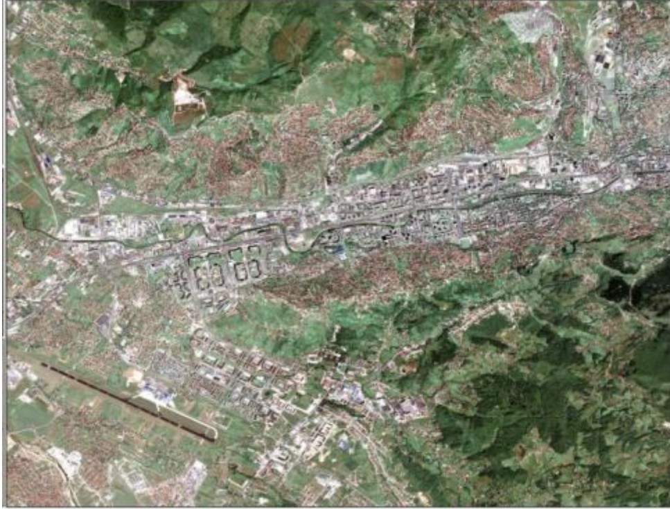
Şekil 3. Bosna – Hersek Cumhuriyeti'nin Başkenti Sarayova'nın Uydu Görüntüsü

ülkesi olan Bosna-Hersek; doğuda Sırbistan, kuzey ve batıda Hırvatistan, güneyde Karadağ ile komşudur. Bosna-Hersek'te üç ayrı etnik kimlik yaşamaktadır. Bunlar: Sırp, Hırvat ve Boşnak olarak adlandırılan Balkan topluluklarıdır. Bosna-Hersek'te Sırp ve Hırvat kimlikleri olmakla birlikte devletin hâkim unsuru Müslüman Boşnaklardır (Özder, 2010: 46-67).