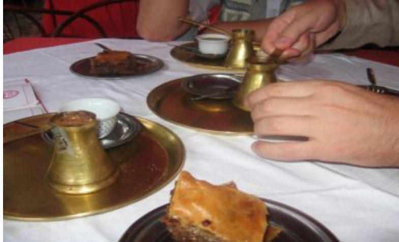
Fotoğraf-12. Kahve ve Baklava Bosna Hersek'te Osmanlı'dan Kalan Gelenek Olarak Yaygın Bir Şekilde Devam Etmektedir.

Bosna Hersek'te Osmanlıların dolayısıyla Türk İslam kültürünün işaretlerini de görmek mümkündür. Yemek çeşitlerinden, mezar tiplerine, mimari yapıya ve el sanatlarına kadar geniş bir yelpazede bunların örnekleri mevcuttur (Fotoğraf 12, 13, 14 ve 15).