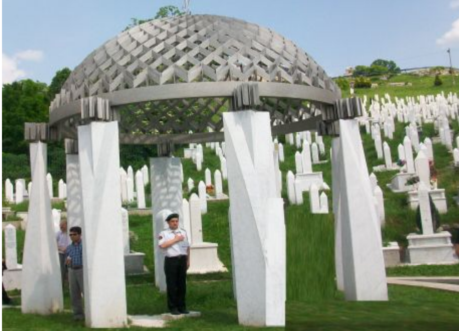
Fotoğraf-9.Bosna Hersek Devletinin Kurucusu Aliya İzzetbegović'in Kabri