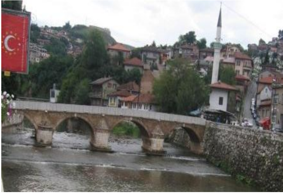
Fotoğraf 4. Miljacka Nehri ve Her İki Kıyısında Sarayova Yerleşmesi