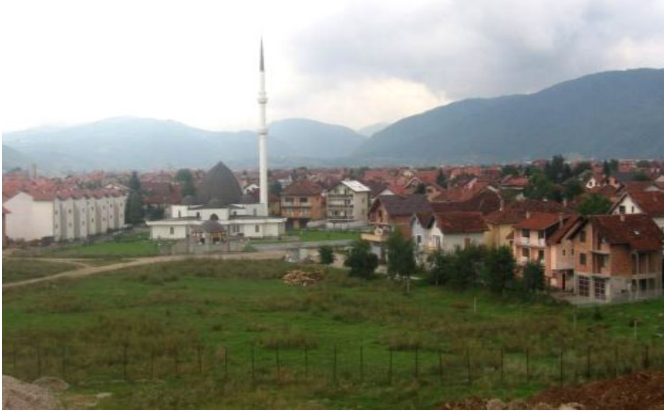
Fotoğraf 2. Sarayova'nın Kurulu Bulunduğu Ova Tabanı ve Buradaki Konutlar

Fiziki çevrenin etkisini konutlarda kullanılan yapı malzemelerinden kaldırımlarda kullanılanlara kadar görmek mümkündür. Sarayova'nın merkezi olan Başçarşı'da döşeli olarak bulunan tarihi kaldırımlar çevredeki dağlardan çıkarılan şistlerden yapılmıştır (Fotoğraf 3).