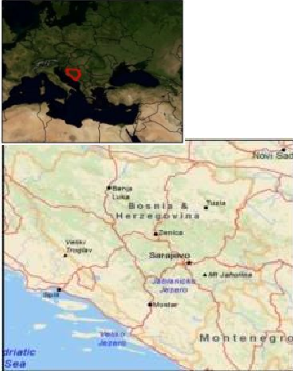
Şekil-1. Bosna – Hersek Cumhuriyeti'nin Konum Haritası