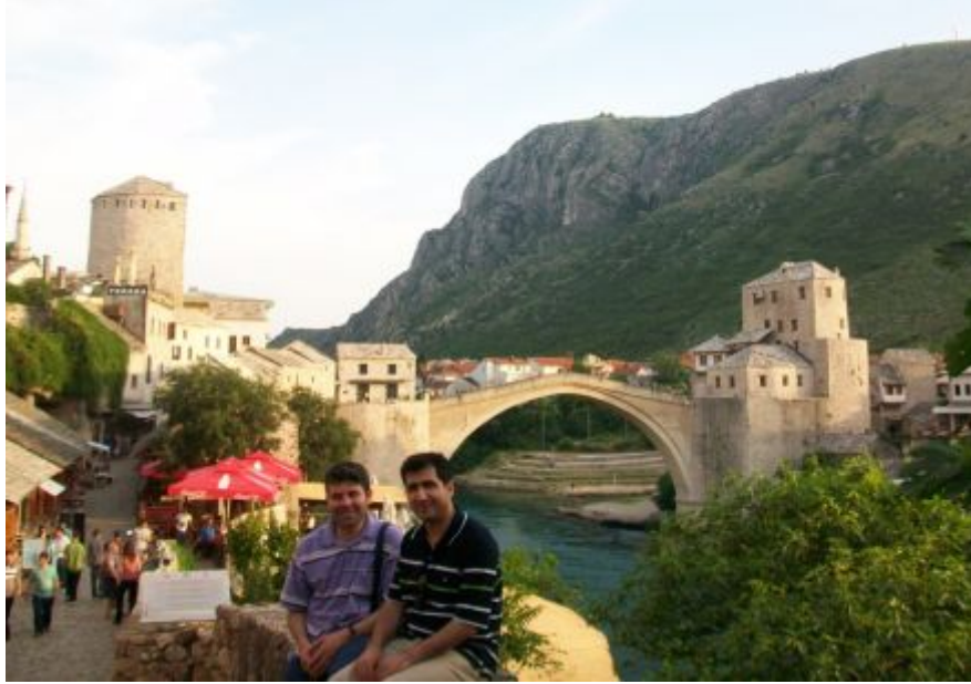
Fotoğraf 13. Türk- İslam Mimarisinin Göstergesi Yenilenmiş Mostar Köprüsü