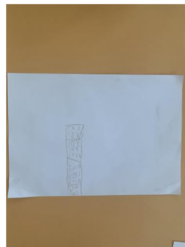
Şekil 19. K7 tarafından sınıfta çizilen yazıt