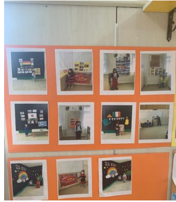
Şekil 5. Fotoğrafların sergilenmesi