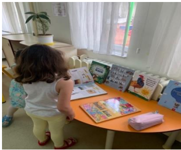
Şekil 2. Kitapları inceliyorlar

Uygulamanın yapıldığı okulda Azerbaycan, Irak, Kazakistan, Rusya olmak üzere farklı kültürden ebeveyne sahip olan çocuklar bulunmaktadır. Uygulamanın yapıldığı sınıfta da farklı kültürden ebeveyne sahip çocuklar yer almaktadır. Çocukların arkadaşları ve öğretmeni ile buna yönelik paylaşımlar yapması ve öğretmenin aile ile iletişimi sonucunda böyle bir proje yapılması planlanmıştır. Farklı ülkeler ile ilgili eğitim ortamı düzenlenerek bir merkez oluşturulmuştur. Merkeze konu ile ilgili resimli çocuk kitapları, atlaslar, gezi broşürleri, haritalar, dünya küresi, farklı ülke bayrakları konulmuştur. Eğer çocuklar da ilgi gösterirse proje yaklaşımı ile etkinliklerin devam ettirilmesi kararlaştırılmıştır. Çocuklar oluşturulan merkeze ilgi göstermiş, birbirleri ve öğretmen ile etkileşime geçmişlerdir. Bu esnada çocuklar daha önce gitmiş oldukları şehirlerden bahsetmiş aile yakınlarının olduğu şehirleri ifade etmişlerdir. Örneğin E3, Yazın Antalya’ da yuzdüğünü söylemiş, K1 Ordu’ ya anneannesini ziyarete gittiklerini ifade etmiştir. Çocukların tahminleri, soruları ve söyledikleri kaydedilmiştir. Çocukların şehir, ülke kavramlarını karıştırdığı görülmüştür.