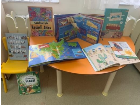
Şekil 7. Ülkeler temalı kitap merkezi

mağaraları gezdiğini belirtmiştir. Öğretmen bunları not etmiş ve eğer bununla ilgili fotoğraf varsa sınıfa getirerek paylaşmasını istemiştir. Aynı zamanda sınıfa farklı ten rengine sahip oyuncaklar ve kuklalar da çocukların oynaması için bırakılmıştır.