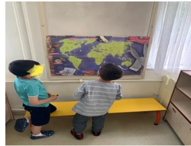
Şekil 3. Haritayı inceliyorlar