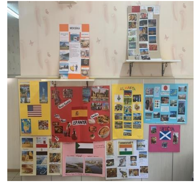
Şekil 6. Sunumların sergilenmesi