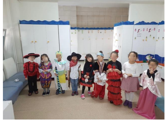
Şekil 23. Farklı ülke kostümleri