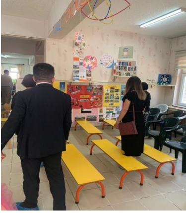
Şekil 22. Ailelerin sergi ziyareti

V10: "Hem bizler hem de kızımız seçtiğimiz ülkenin bayrağını, dilini, o ülkenin özelliklerini (kıyafet, yemek, meşhur yerler vb.) öğrenmiş olduk. Aynı zamanda kızımız arkadaşlarından farklı ülkeleri de öğrenmiş oldu."