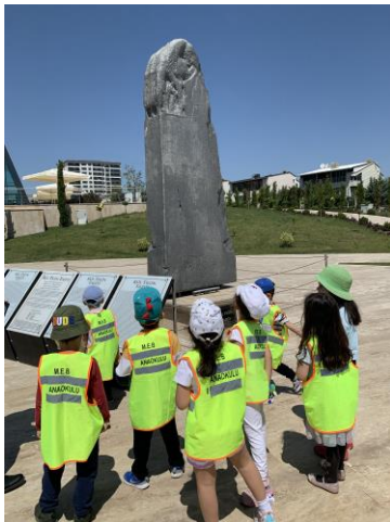
Şekil 18. Müzede incelenen yazıt

Bu örnekte kitabenin çocuğun aklında gerçeğe uygun olarak kaldığı söylenebilir. Çocukların resimleri incelendiğinde resimlerdeki çizimler kitabe, Nasreddin Hoca, bayrak, çadır, müze, çocuklar, Osman Bey, attan düşen asker heykeli, Atatürk ve arkadaşı olarak ifade edilmiştir. Resimlerde en çok çizilen tema ise Türk otağı olarak tespit edilmiştir.