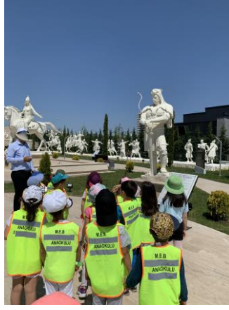
Şekil 16. Uzman bilgilendirmesi