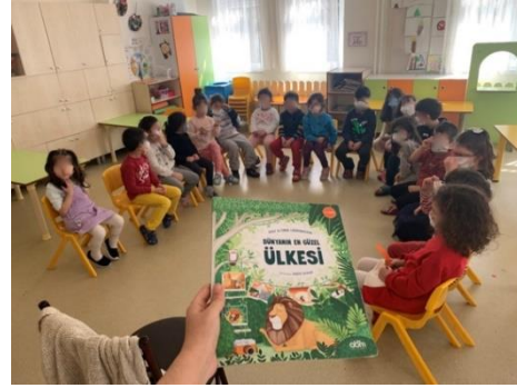
Şekil 8. Kitap okuma etkinliği