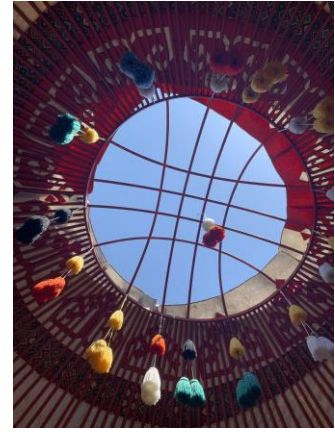
Şekil 17. Otağın tepe kısmı

Gezi sonrası sınıfa döndüğünde çocukların neler hissettiği, neler gördükleri tartışılmış ve çocuklardan resim çizmeleri istenmiştir. Çocukların çizimleri hakkındaki yorumları resimlerin arkasına not alınmıştır.