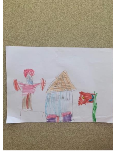
Şekil 21. K2 tarafından sınıfta çizilen Nasreddin Hoca, çadır, bayrak