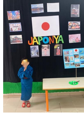
Şekil 9. Çubuklarla yeme denemesi Şekil 10. Oyun hamurundan sushi yapımı Şekil 11. Göster-Anlat etkinliği