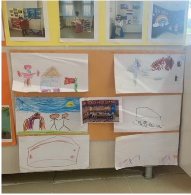
Şekil 4. Çocuk resimleriyle dolan boş duvar

Sudan, Mısır, İskoçya ve Amerika Birleşik Devletleri ülke tanıtımları için belirlenmiş ve bu ülkeler her hafta bir ülke olacak şekilde sıraya konulmuş, ailelere takvim hakkında bilgilendirme yapılmıştır.