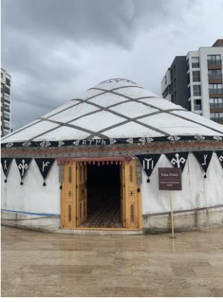
Şekil 15. Müzedeki Türk otağı