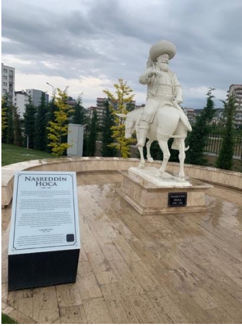
Şekil 20. Müzedeki Nasreddin Hoca heykeli