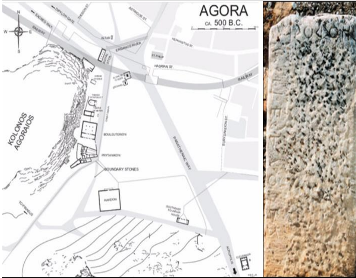
Görsel 1: Solda: Atina agorasının İÖ 400 yıllarına ait planı. Sağda: İÖ V. yüzyıla ait olan agora sınır taşı (Lang, 2004, s. 5-6).

gerçekleştirilmekteydi (Wycherley, 2011, s. 72). Agoralar İÖ V. yüzyılla birlikte hızlı bir mimari gelişim göstermiştir. Agoranın başlangıcındaki basit mimari formu, ticari faaliyetlerin artması, kent nüfusunun çoğalması, toplumdaki siyasi, kültürel ve sanatsal faaliyetlerin yoğunlaşması ile birlikte gelişmiştir. Özellikle İÖ V. yüzyılda Hellen'in birçok polis inde planlı bir yapıya dönüşen agoralar , zamanla polis statüsündeki her yerleşimin temel mimari yapılarından biri olmuştur (Yılmazcan, 2021, s. 295).