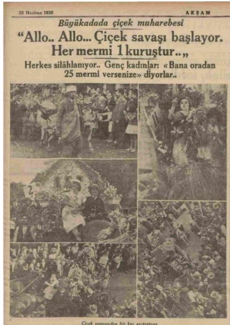
Akşam, 25 Haziran 1935, s.7