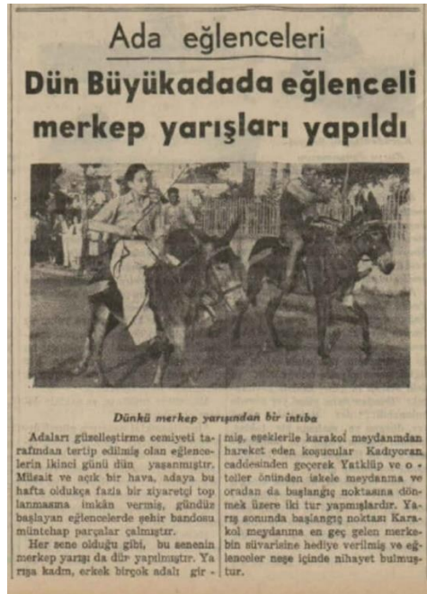
Tan, 29 Haziran 1936, s.2