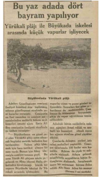
Haber, 19 Nisan 1934, s.1