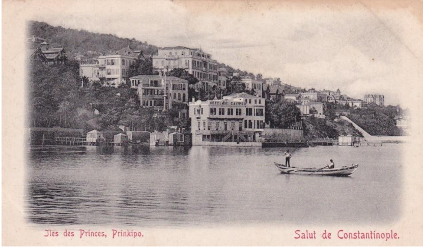
1900'lü yılların başı, Büyükkada oteller bölgesi