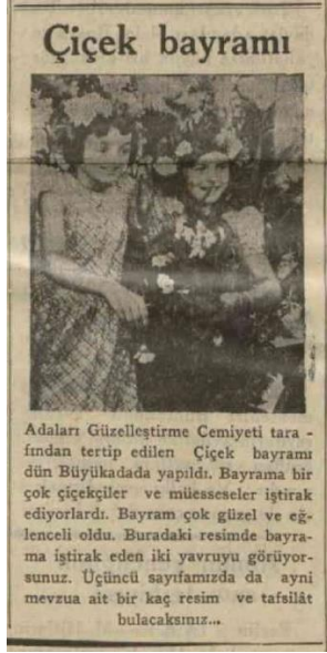
Vakit, 4 Ağustos 1934, s.1