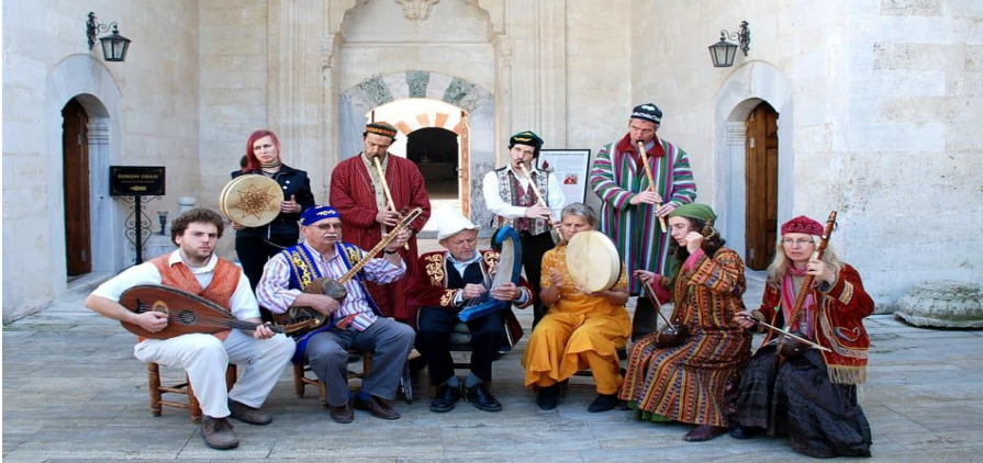
Resim 3: Tümata'nın yaptığı bir etkinlik ile ilgili görsel

1976 yılında Türk Musikisini Araştırma ve Tanıtma Grubu olarak kurulan bu grubun amacı müziğin tedavi amaçlı kullanılması ve eski Türklerde 6000 yıllık bir geçmişe sahip olan bu kültürü yaşatmaktır. Özellikle Altay Türk kültürünün MÖ 3000'li yıllardan itibaren bu kültürün oluşmasında önemli rol oynadığı arkeolojik kalıntılardan elde edilen bulgularla ortaya çıkmıştır. Rahmi Oruç Güvenç, TÜMATA grubunu kökleri çok derinlere giden bu kültürümüzü ve kültürümüze ait olan repertuar, icra şekilleri, danslar, kıyafetler ve buna benzer modern tıpta yeniden keşfedilen müzik terapinin uygulama malzemeleri faaliyet konuları içindedir. Bu konuların bütünlüğünü sağlamak amacıyla üç yüzden fazla otantik Türk musikisi aletini toplamış ve bir müze oluşturmuştur. Rahmi Oruç Güvenç aynı zamanda bu unutulmuş çalgıları gün yüzüne çıkartmak, orijinaline en yakın şekliyle bu çalgıyı yapmakla kalmamış aynı zamanda bu çalgıların nasıl icra edilecekleri konusunda da çalışmalarda bulunmuştur (URL-1).