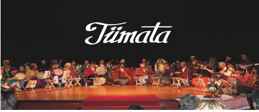
Resim 2: Tümata'nın yaptığı bir etkinlik ile ilgili görsel

1976 yılında Türk Musikisini Araştırma ve Tanıtma Grubu olarak kurulan bu grubun amacı müziğin tedavi amaçlı kullanılması ve eski Türklerde 6000 yıllık bir geçmişe sahip olan bu kültürü yaşatmaktır. Özellikle Altay Türk kültürünün MÖ 3000'li yıllardan itibaren bu kültürün oluşmasında önemli rol oynadığı arkeolojik kalıntılardan elde edilen bulgularla ortaya çıkmıştır. Rahmi Oruç Güvenç, TÜMATA grubunu kökleri çok derinlere giden bu kültürümüzü ve kültürümüze ait olan repertuar, icra şekilleri, danslar, kıyafetler ve buna benzer modern tıpta yeniden keşfedilen müzik terapinin uygulama malzemeleri faaliyet konuları içindedir. Bu konuların bütünlüğünü sağlamak amacıyla üç yüzden fazla otantik Türk musikisi aletini toplamış ve bir müze oluşturmuştur. Rahmi Oruç Güvenç aynı zamanda bu unutulmuş çalgıları gün yüzüne çıkartmak, orijinaline en yakın şekliyle bu çalgıyı yapmakla kalmamış aynı zamanda bu çalgıların nasıl icra edilecekleri konusunda da çalışmalarda bulunmuştur (URL-1).