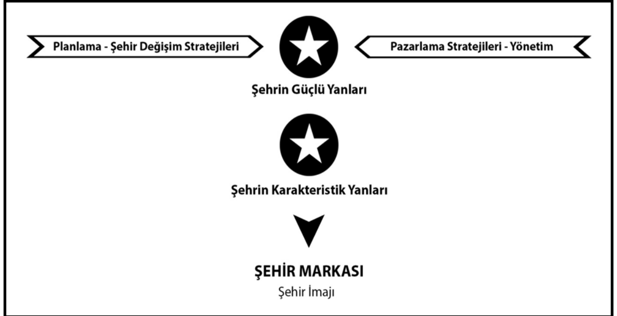
Şekil 1. Kent pazarlaması ile kent markası oluşturma arasındaki bağ

Kent markası oluşturulurken kentsel yörenin karakteristik özellikleri, yönetim ve pazarlama yöntemleri ile sosyo-ekonomik ve mekânsal planlamayı kapsayan stratejiler düşünülmelidir (Peker, 2006: 21). Profesyonel uzmanlık düzeyinde kent markası yaratılması, “planlama” ve “pazarlama” disiplinlerinin uyumunu gerektirir. Şekil 1’de Kent pazarlaması ile kent markası oluşturma arasındaki bağ gösterilmektedir.