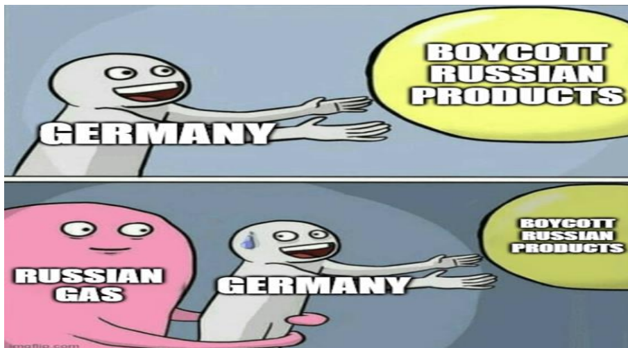
Görsel 4. Almanya, Tamamen Rus Gazına Bağımlı