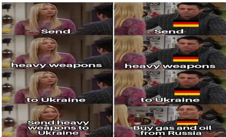
Görsel 6. Friends Dizisi