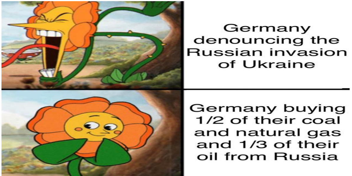
Görsel 3. Come on, Germany ( Hadi Canım, Almanya )