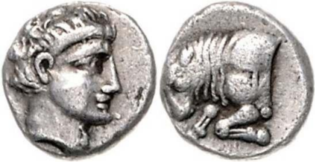
Şekil- 3: Diobol, İ.Ö.400 Gambreion sikkesi

Kentte basılan sikkelerin en erken örneklerinde ön yüzde Apollon başında teania ile sağa bakar şekilde ile betimlenmiştir. Arka yüzde diz çökmüş bir şekilde sadece vücudunun ön yarısı betimlenmiş bir boğa (ve ΓΑΜ lejandı) yer almaktadır.