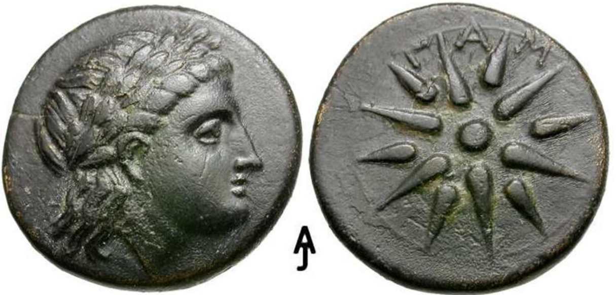
Şekil- 4:AE, İ.Ö.400 Gambreion sikkesi