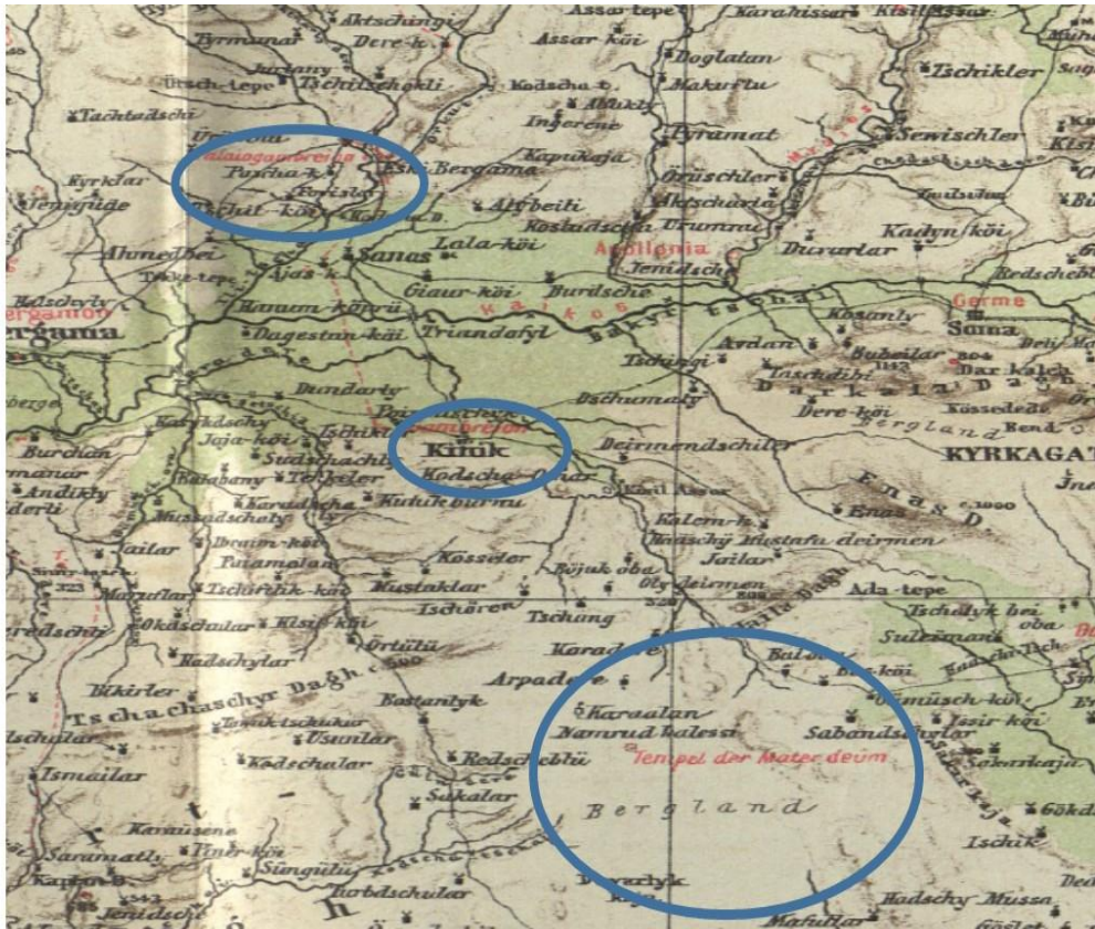
Şekil- 2: Gambreion kentinin olası sınırlarının 19. Yüzyılda yapılmış haritası (Diest, 1889:101-Nordwestlichen Kleinasien)