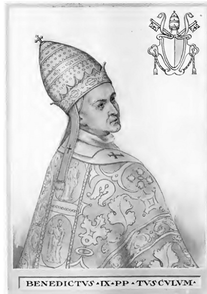
Montor, Artaud de, The Lives and Times of The Popes , c. III, New York, 1911, s. 9a.