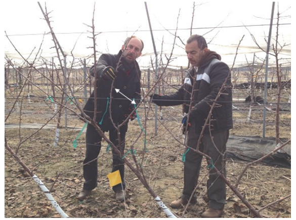
Şekil 13. Dik sürgünlerde çatal oluşumu. Figure 13. Crotch formation on horizontal trunk.

Bu derleme TÜBİTAK (TOVAG 1130234) tarafından desteklenen ‘Türkiye’de Kirazlarda Yeni Terbiye Sistemlerinin Uygulanabilirliği’ isimli projeden elde edilen bilgi ve deneyimler sonucunda hazırlanmıştır. Bu nedenle katkıları dolayısıyla TÜBİTAK’a teşekkürlerimizi sunmaktayız.