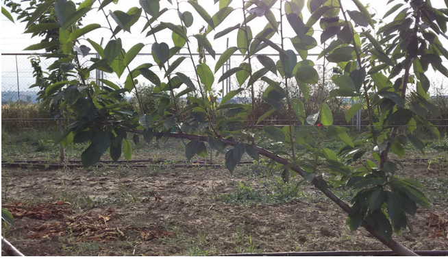
Şekil 1. UFO sistemi (Samsun-2013). Figure 1. UFO system (Samsun-2013).