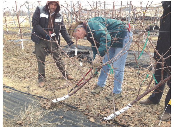
Şekil 15. Sıra arasına doğru yönelen dalın çıkarılması. Figure 15. Removing of the shoot toward to inter row.