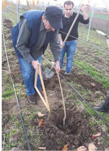
Şekil 4. UFO sisteminde ahşap fidan dikim aparatı (Demirsoy ve ark., 2013). Figure 4. Wood planting tool in UFO system (Demirsoy et al., 2013).