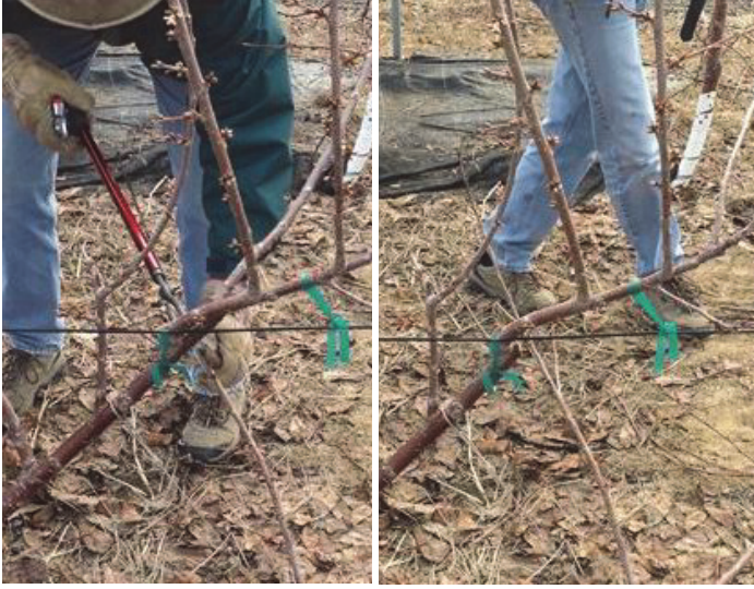
Kesimden önce (Before cutting) Kesimden sonra (After cutting)