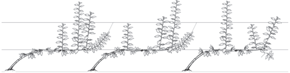
Şekil 6. İlkbaharda bağlama işlemi (Long ve ark., 2015). Figure 6. Tying in spring (Long et al., 2015).