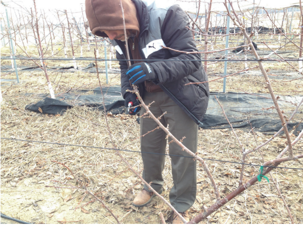
Şekil 12. UFO sisteminde ılımlı derecede meyve veren çeşitlerde dikey sürgünler üzerindeki dalcıkların çıkarılması. Figure 12. Cutting of small woods on vertical shoots on moderately productive varieties by stub cut.

UFO, kısmen merdiven kullanmaksızın kültürel işlemlerin yapılabilceği, ilk yıllarda erken ve yüksek verim elde edilebilecek, daha az işçi ve işçilik isteyecek, kanopide üniform, yüksek meyve kalitesi ile yeterli hava ve ışık dağılımı sağlayabilecek modern bir terbiye sistemidir. İlk kurulum giderleri biraz fazla gibi olsa da, bu sistem ağaç yönetimi kolay ve basit olup mekanizasyona da uygundur. Bu bağlamda, UFO sisteminin ülkemizde kiraz yetiştiriciliğine katkı