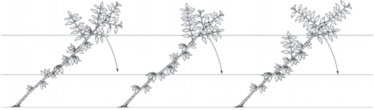
Şekil 5. İlkbaharda yatırma işlemi (Long ve ark., 2015). Figure 5. Bending in spring (Long et al., 2015).