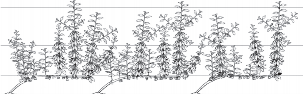
Şekil 8. Bitkilerin tellere bağlanması (Long ve ark., 2015). Figure 8. Tying of vertical shoots (Long et al., 2015).