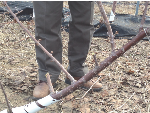
Şekil 14. Stub kesim sonrası. Figure 14. After stub cut.

sağlayacağı düşüncesiyle, en kısa sürede uygulamaya aktarılmasının önemli olduğu düşünülmektedir.