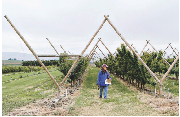
Şekil 2. UFO-Y sistemi (Anonymous, 2015). Figure 2. UFO-Y system (Anonymous, 2015).