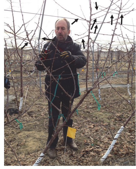
Şekil 10. UFO sisteminde çıkarılması gereken dikey dallar üzerindeki yan dallar. Figure 10. Limbs to be removed on vertical shoots.