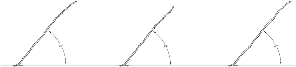
Şekil 3. UFO sistemi dikim açısı (Long ve ark., 2015). Figure 3. Planting angle of UFO system (Long et al., 2015).