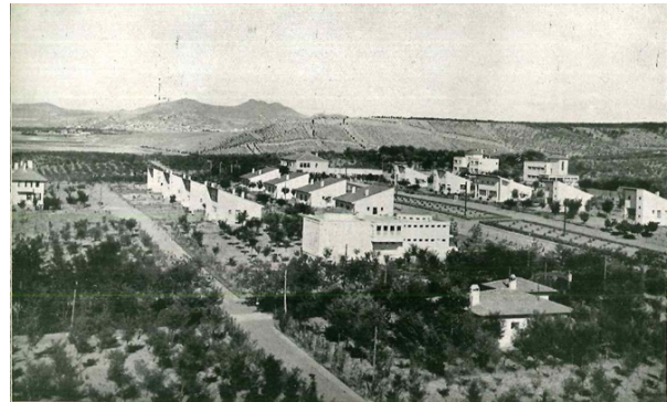
Fotoğraf 7. AOÇ Memur-işçi lojmanları