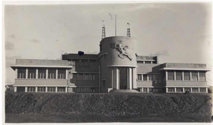
Fotoğraf 19. Refik Saydam Hıfzıssıhha Enstitüsü, Kimyahaneye ve Bakteriyoloji Binası (Salt Araştırma)

Son dönemde Türkiye'nin yaşadığı bir diğer önemli olay, Mart 2020'de Dünya Sağlık Örgütü tarafından ilan edilen Covid-19 salgını; nüfusun kentlerde yoğunlaşması, özelleştirilen sağlık hizmetleri, derinleşen eşitsizlikler bağlamında bir krize dönüşmüştür. Hızlı ve plansız kentleşme, rant amaçlı yoğun yapılaşma ve özelleştirmelere bağlı sorunlar yeniden gündeme gelirken toplumsal ve mekânsal eşitsizlik, sağlıklı kent yaşamı, kamu hizmetleri ihtiyacı, erişimi ve kullanımı gibi konular 32 tartışılmaya başlamıştır.