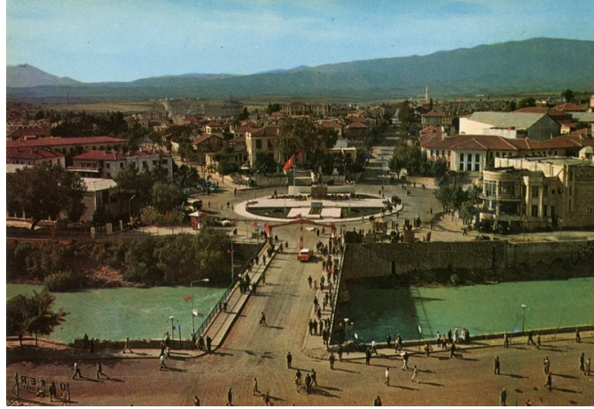
Fotoğraf 20. 1970'ler Antakya genel görünüş

Depremlerden etkilenen kentlerin onarılması sürecinde öncelikli amaç, sağlıklı yaşam koşullarının temin edilmesiyle birlikte kent kimliğini ve hafızasını oluşturan birikimin devamlılığının sağlanmasıdır. Buna karşın Türkiye’de kullanılan tek tip imar yönetmeliği ve TOKİ’nin kamu yararına olmayan bakış açısı doğrultusunda inşa edilen yeni konutlarla bir kentin kültürünün korunması mümkün olmadığı gibi, kentler birbirine benzer hale getirilmektedir (Karakuş Candan, 2023; Tekeli, 2023).