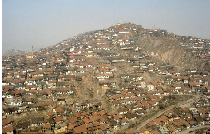
Fotoğraf 13. Ankara'da gecekondular

Büyük kentleri çevreleyen gecekondular 14 , boş ve plan dışı bırakılmış hazine toprakları üzerinde denetimsiz, altyapıdan yoksun, sağlıksız koşullarda önceleri barakalar halinde, sonrasında tek katlı bahçeli evler olarak yapılmıştır (Fotoğraf 13). Ankara'da Altındağ, İstanbul'da Zeytinburnu ve Taşlıtarla, İzmir'de Kadifekale, ilk gecekondular yerleşimleridir. Kentteki sorunlar karşısında yardımlaşma ve dayanışma, geleneksel otorite ilişkilerini koruma gibi nedenlerle akraba ve hemşehri kümelenmesinin görüldüğü gecekondular mahallelerindeki iç çevre, sınırlı ve dışa kapalı bir mekân olarak cemaat yaşamının samimi ve teklifsiz ilişkilerini sürdürmektedir (Ayata, 1989). 1950'lerde belediyenin hizmet alanları dışında kalan gecekonduların ulaşım ihtiyacının karşılandığı, sonraki yıllarda belli bir yaşam tarzının simgesi hâline gelen dolmuş olgusunu kapsamlı ve ayrıntılı ele alan Tekeli ve Okyay (1981), kentin mekânsal örgütlenmesinde kentteki arazi kullanım biçimleriyle ulaşım araçlarının ilişkisini çözümlemektedir.