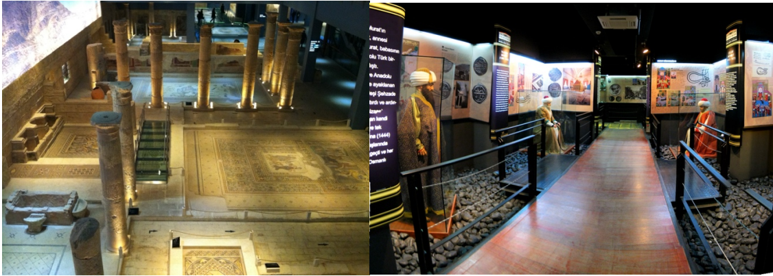
Fotoğraf 16.Gaziantep Zeugma Mozaik Müzesi Fotoğraf 17.Bursa Kent Müzesi (Anonim)

Yeni müzelerin kentsel kolektif bellekle ilişkisi tartışma yaratmaktadır. Örneğin Erman'ın (2013, s.62) belirttiği üzere Gaziantep'te, Cumhuriyet'in ilk dönem eseri TEKEL binası tamamen yıkılarak hafızlardaki izi de silinirken bu alanda Zeugma Mozaik Müzesi inşa edilmiştir (Fotoğraf 16). Balkanay (2017) ise, Ankara Ulucanlar Kapalı Cezaevi'nin hem şiddetin hem de direnişin mekânı olarak toplumsal bellekteki izini ele aldığı araştırmasında, Müze uygulamasının, şiddeti bir gösteri hâline getirdiğini, ziyaret edenlerin mekânın barındırdığı hafızayla ilişki kuramadığını ve şiddetle yüzleşemediğini belirtir (2017, s.172). Kent müzelerinin, kentte yaşamış/yaşamakta olan etnik/dini toplulukları kapsayıcılığını sorgulayan Eklemezler'in (2021) araştırmasına göre, Bursa'daki altı yüzyıllık geçmişlerine rağmen bugün altmış kişiyle azınlık hâline gelen Yahudi cemaatinin, Bursa Kent Müzesi'ndeki temsili yetersiz kalmaktadır (Fotoğraf 17). Müzede göçmen, azınlık ve yerel toplulukları kapsayıcı, bütüncül bir kent tarihinin anlatımına ihtiyaç duyulmaktadır (Eklemezler, 2021).