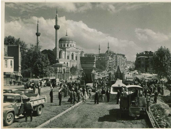
Fotoğraf 11. Aksaray’da yol çalışması