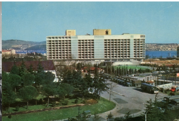
Fotoğraf 10. İstanbul Hilton Oteli