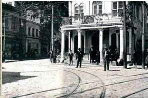
Fotoğraf 12. 1957’de yıkılan Aksaray Karakolu (İğüs ve İsmailoğlu, 2016)

İstanbul’un tarihi şehir dokusunun kaybolmasıyla birlikte, eski konak ve ahşap binalar yerlerini yeni yapılan caddelerin kenarlarını dolduran modern apartmanlara bırakmış ve bu gelişmeden etkilenen orta-üst sınıf ailelerin yeni mekânları olmuştur (Bali, 1999, s.35). DP’nin İstanbul için planladığı mekânsal dönüşümler arasında “Osmanlı konaklarında geniş ailelerin yaşadığı mevcut kentsel doku yerine çekirdek aileler için yapılan apartmanlar” yer almaktadır (de Rouen, 2017, s.33). Teşvikiye-Nişantaşı’nda yeni tip “çok daireli”