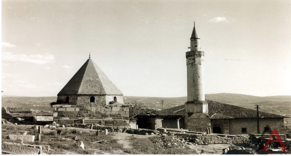
Resim II. Cami, Türbe ve Mezarlık (Ankara Araştırmaları Dergisi’nden)