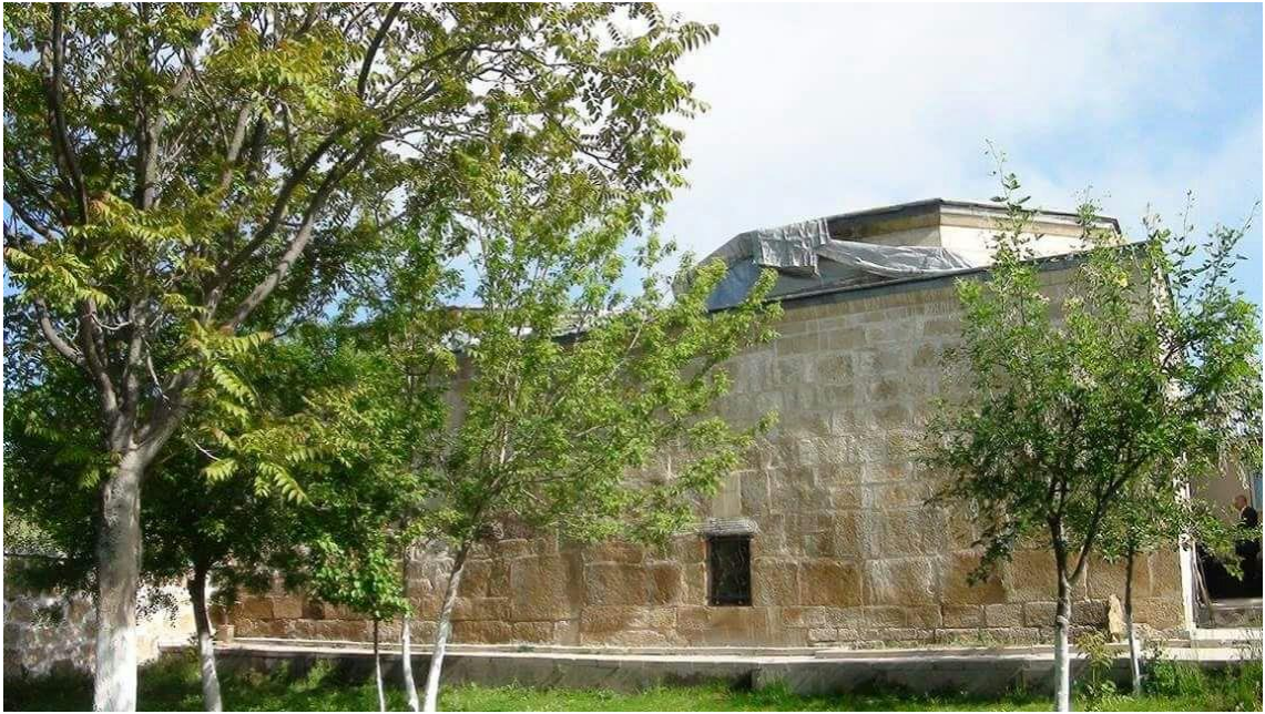
Resim 5: Seyyid Cemal Sultan Türbesi (Döğer Kasabası / İhsaniye, 2017)