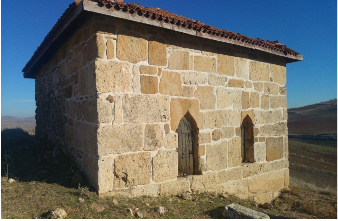
Resim 4: Rasûl Baba Türbesi (Beşkarış Köyü / Altıntaş, 2017)