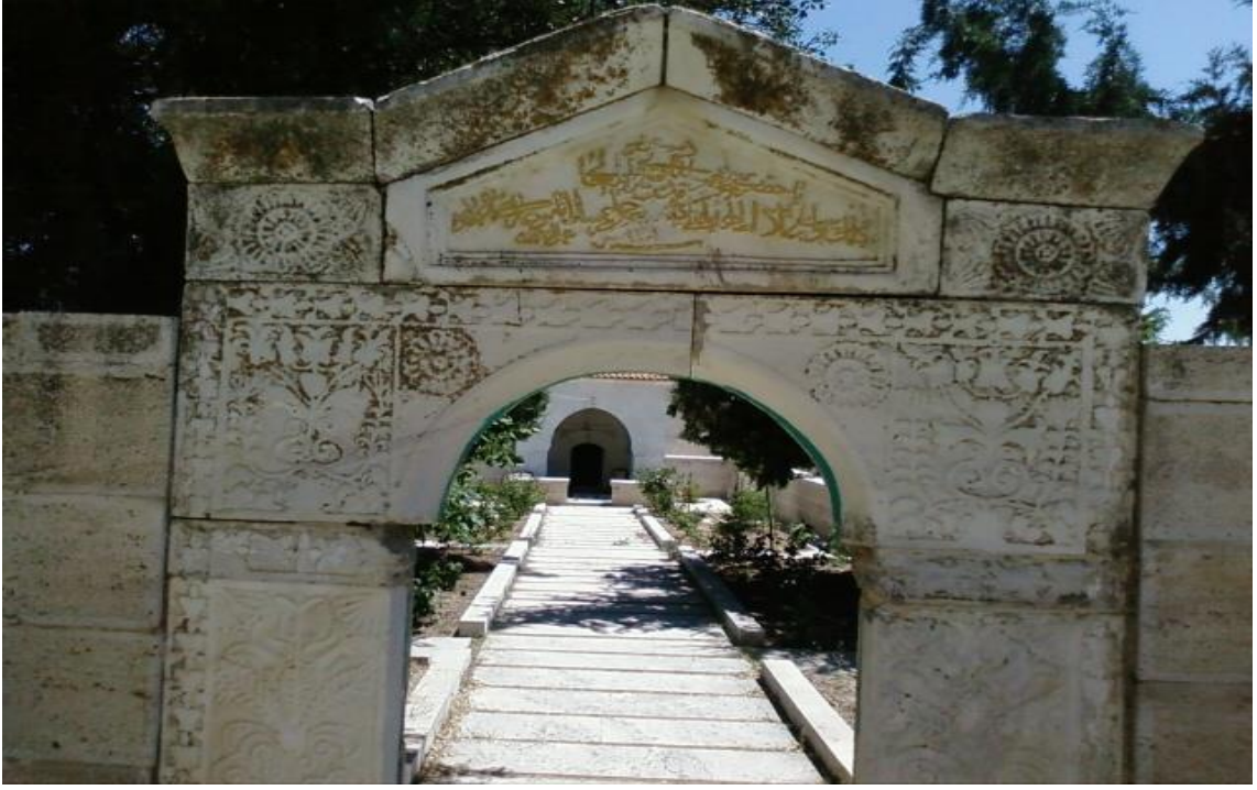
Resim 2: Hacım Sultan Türbesi'nin Girişî (2013)