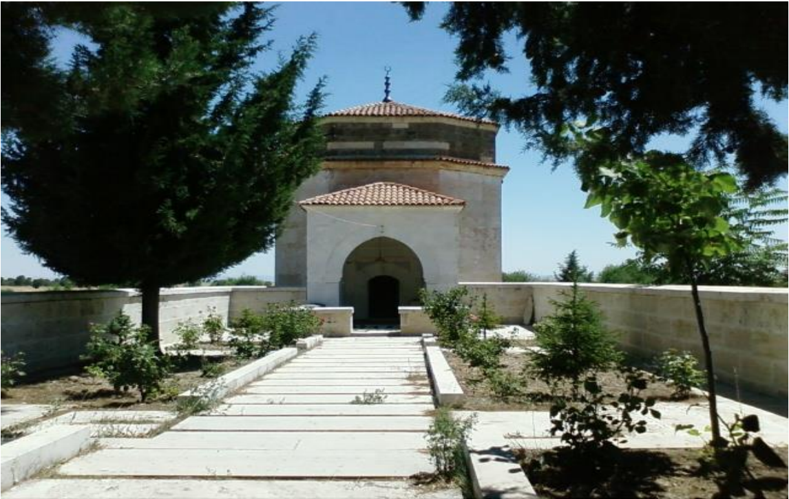
Resim 1: Hacım Sultan Türbesi (Hacı Köyü / Uşak, 2013)