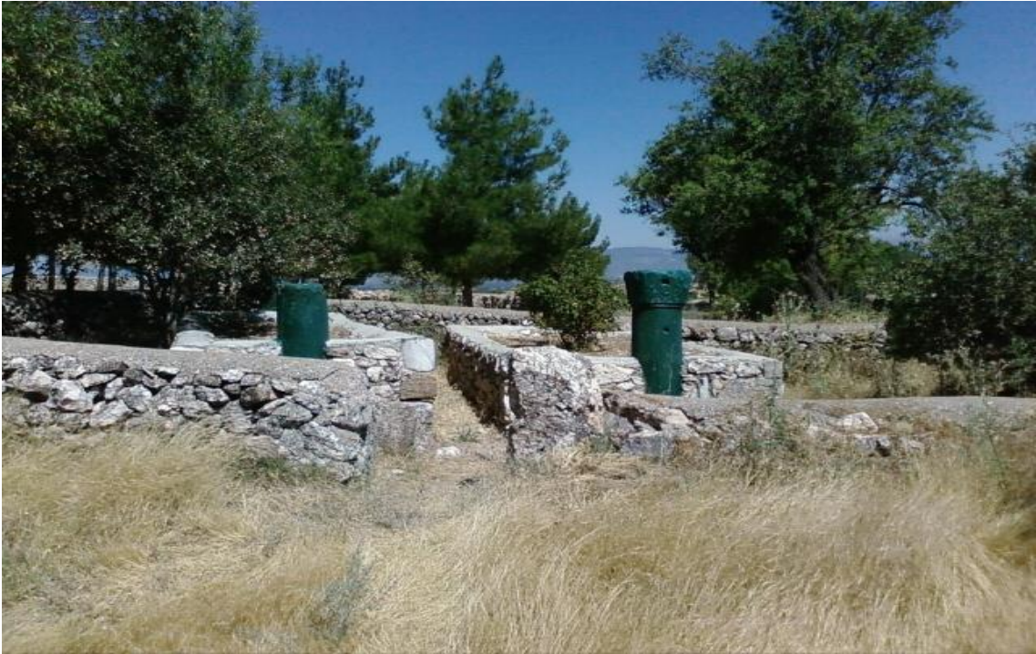
Resim 3: Burhan Abdal (sağda) ve Otman Baba'ya atfedilen mezarlar (Hacım Köyü / Uşak, 2013)