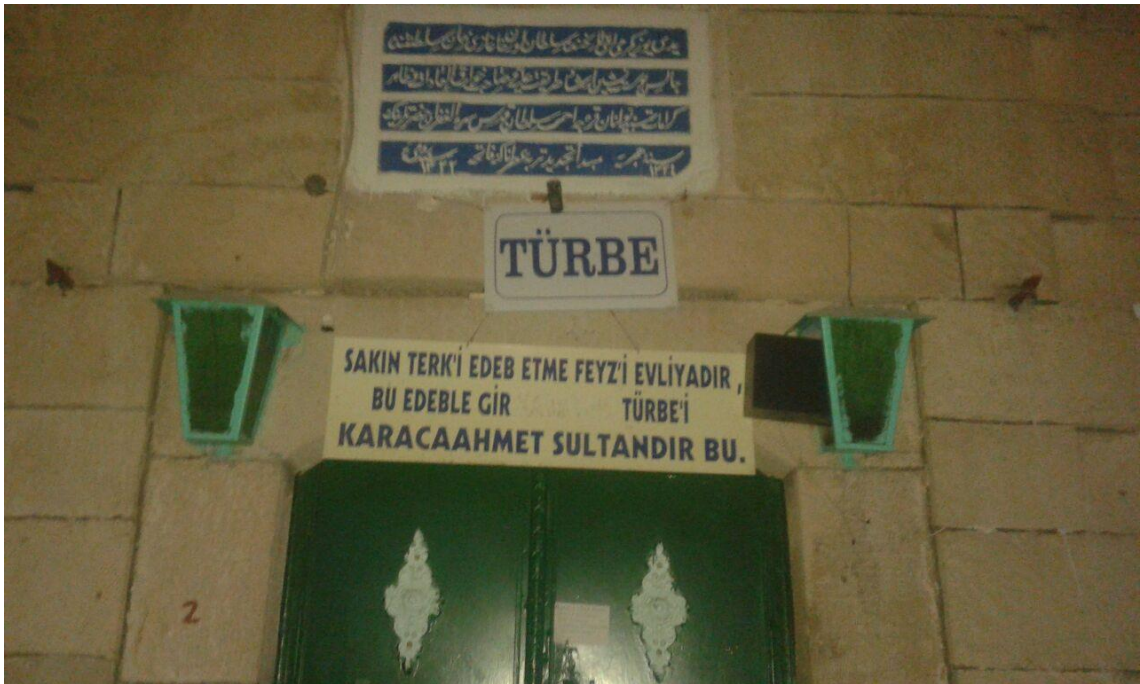
Resim 7: Karaca Ahmed Sultan Tekkesinin Girişi (2017)